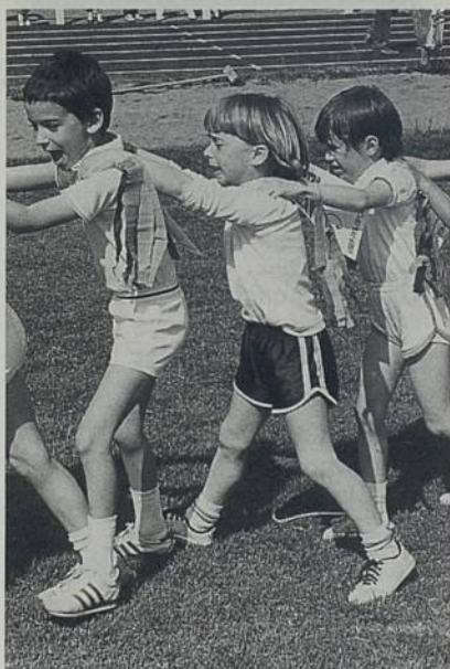
Fête de l'USEP