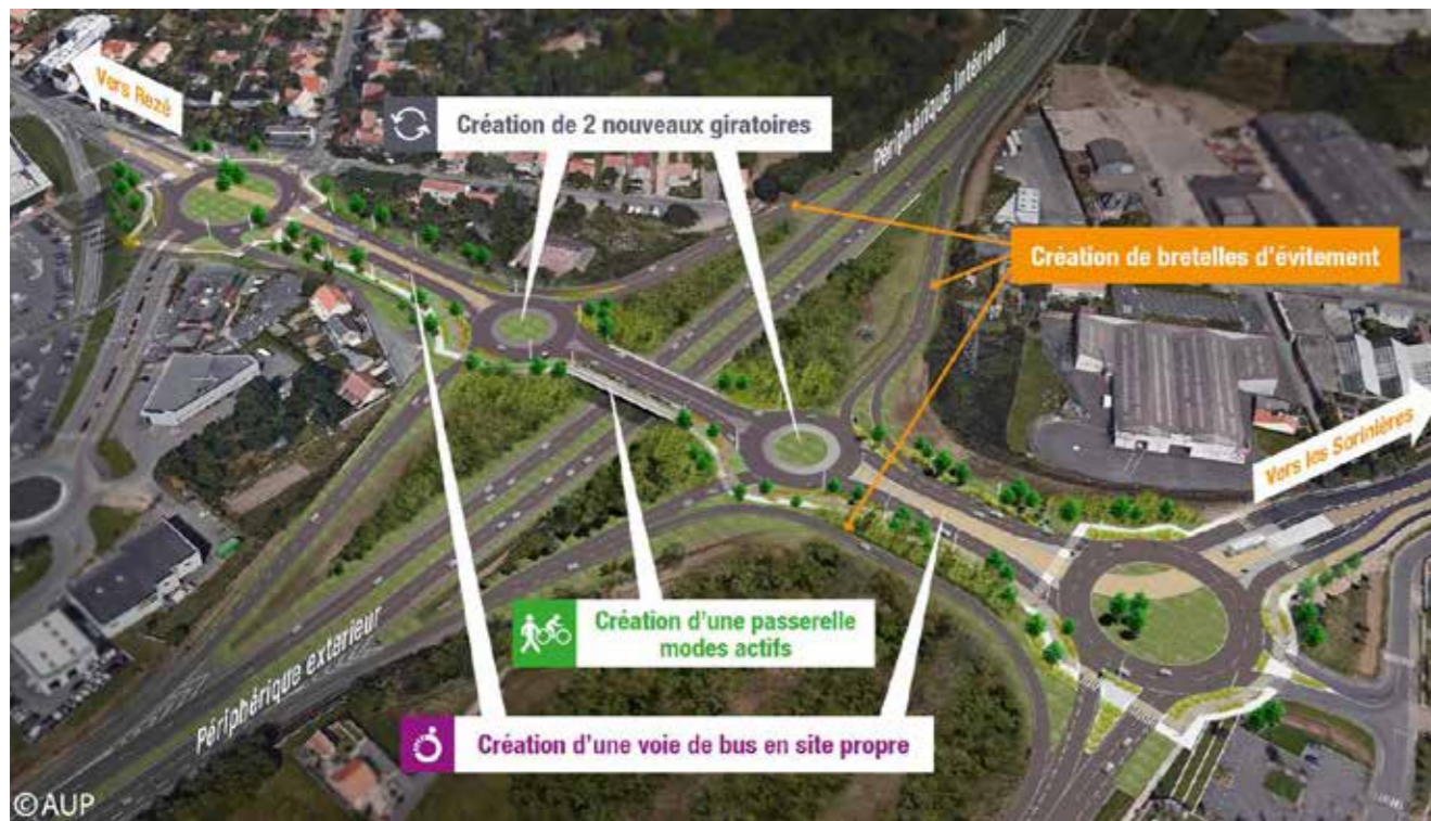
Les travaux d'aménagement de la Porte de Rezé démarrent en octobre 2017. Ils s'achèveront fin 2018.