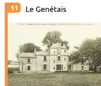
11 Le Genétais Maison de campagne, fin 18 e siècle. Honoré de Balzac y était souvent accueilli.