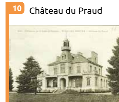
10 Château du Praud Villa bourgeoise édifée en 1844 par l'architecte Chenantais.