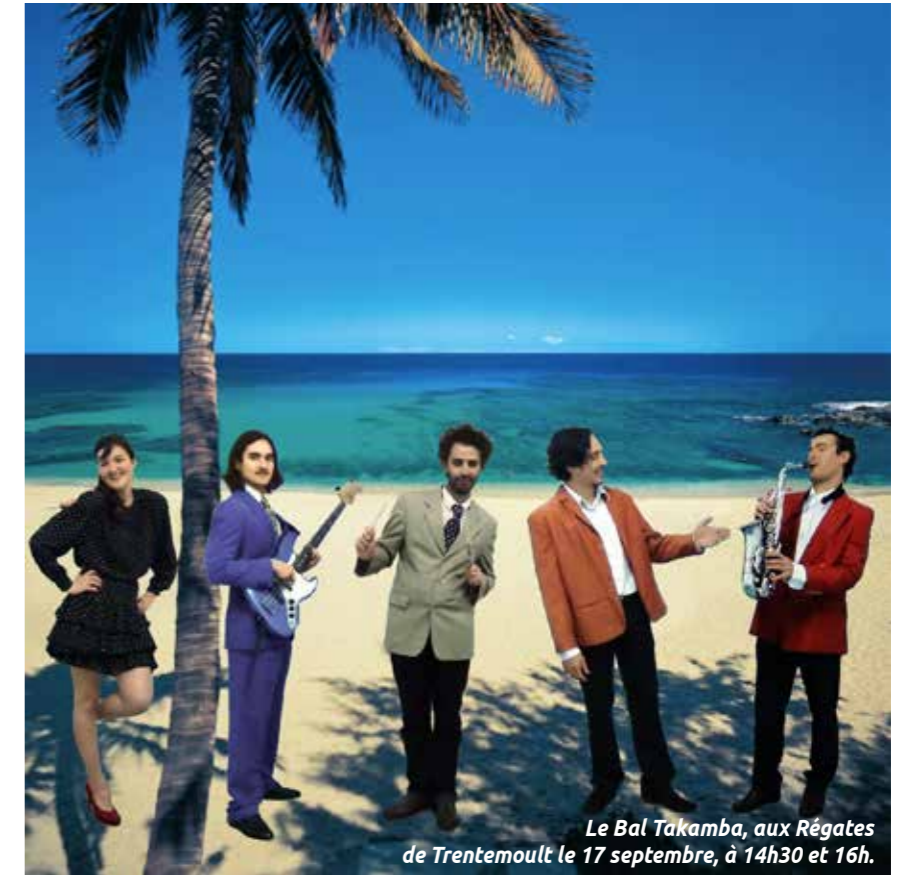
La Soufflerie 2, avenue de Bretagne

Un vent de rentrée souffle sur la culture rezéenne. La Soufflerie a dévoilé le 20 juin sa programmation pour la saison 2017-2018. L'objectif, toujours le même : diffuser la culture pour tous et partout. Temps fort de cette nouvelle année : le retour du Cirque Plume. Présente à Rezé pour la septième fois depuis 1998, la troupe posera ses chapiteaux place du Pays-de-Retz en mars 2018 pour son ultime spectacle. Les événements récurrents sont reconduits, comme le Focus Up ! dédié à la jeunesse, et le Focus Metropolis qui ira lorgner du côté d'Athènes. Grande nouveauté, La Soufflerie s'engage dans la concertation citoyenne avec le dispositif des « souffleurs ». Ce groupe d'habitants portera un regard sur les actions de l'établissement public, pour l'aider à favoriser la participation et l'ouverture vers de nouveaux publics. « La Soufflerie, c'est un outil culturel majeur pour le rayonnement culturel de Rezé », rappelle Philippe Puiroux, conseiller municipal délégué à la culture.