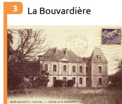
3 La Bouvardière Maison de la fin du 18 e siècle. Propriété d'édiles municipaux au 19 e siècle.