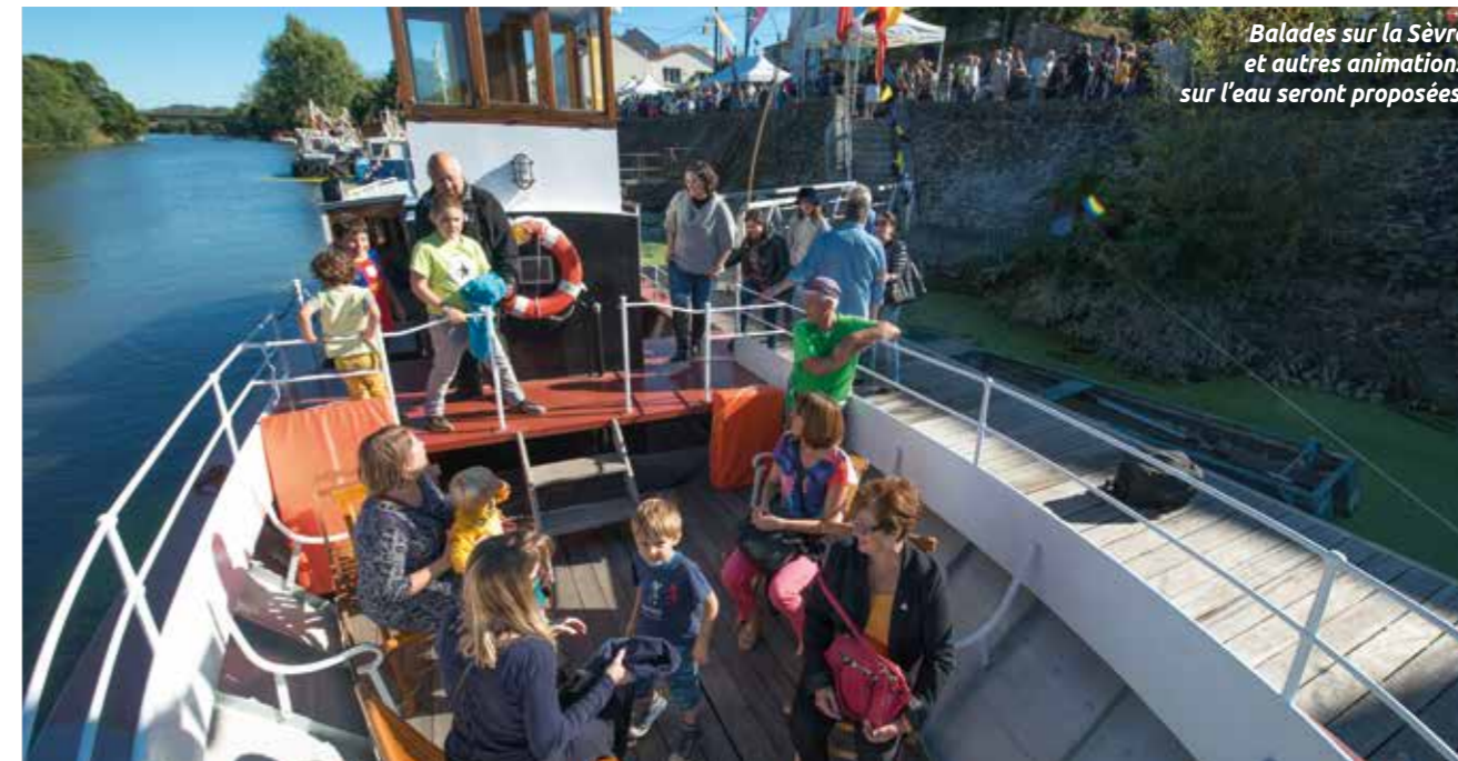
Balades sur la Sèvre et autres animations sur l'eau seront proposées.

Entre 8 000 et 10 000 personnes sont attendues, les 30 septembre et 1 er octobre, à la 22 e Fête du quai Léon-Sécher. Qui a fait du noir et blanc son fil rouge !