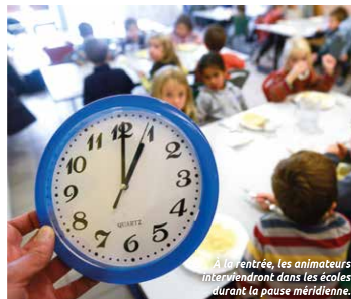
À la rentrée, les animateurs interviendront dans les écoles durant la pause méridienne.

Arpej-Rezé 116, rue de la Classerie 02 51 83 79 20