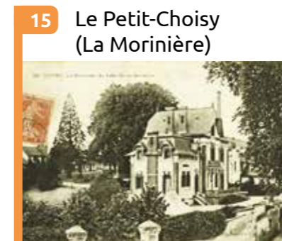
15 Le Petit-Choisy (La Morinière) Site occupé dès le début du 19 e siècle par des activités industrielles (tannerie...).