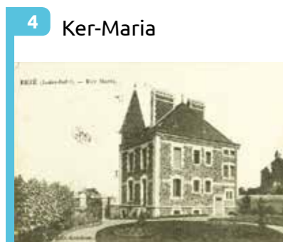
4 Ker-Maria Villa bourgeoise, fin 19 e siècle, démolie en 1987 pour édifier le nouvel hôtel de ville.