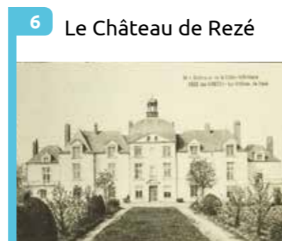
6 Le Château de Rezé Château du 17 e siècle édifé par le Comte Yves de Monti de Rezé. Démoli en 1960.