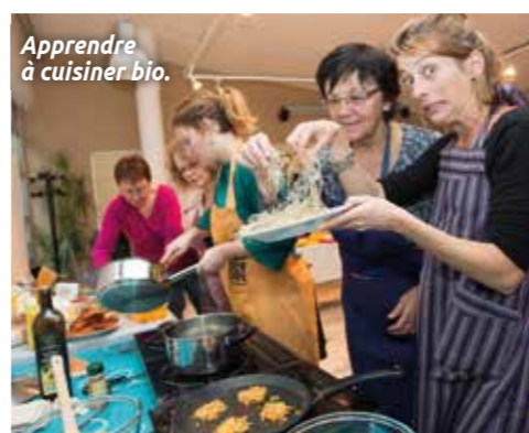
Apprendre à cuisiner bio.

Samedi 16 septembre, entraînement l'après-midi, et dimanche 17 septembre, de 10h à 18h Quai Marcel-Boissard et place des Filets