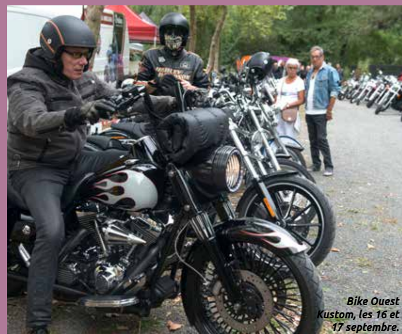
Bike Ouest Kustom, les 16 et 17 septembre.