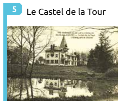
5 Le Castel de la Tour Villa du 19 e siècle, démolie pour construire la Maison radieuse (1953).