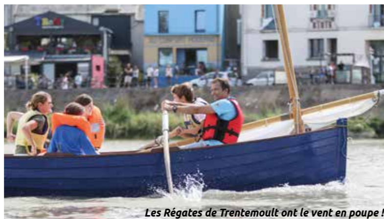
Les Régates de Trentemoult ont le vent en poupe !

+ INFOS : 02 40 13 44 10, maisonduDD@mairie-reze.fr, site web reze.fr