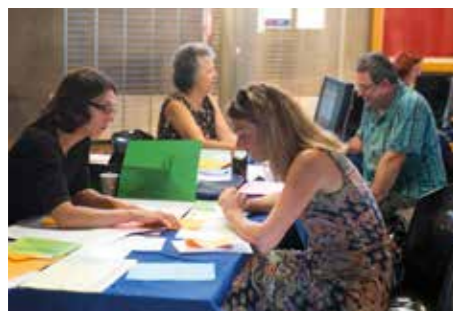
Simplifiez-vous la vie avec le guichet unique !