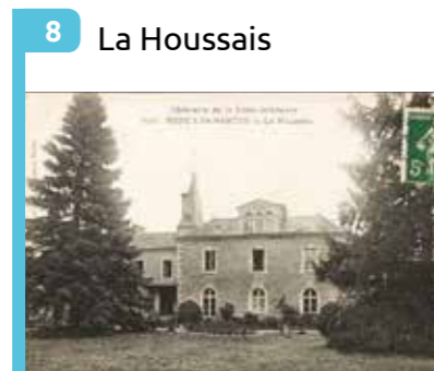
8 La Houssais Château du 18 e siècle, démolie pour édifier le groupe scolaire de La Houssais (1957).