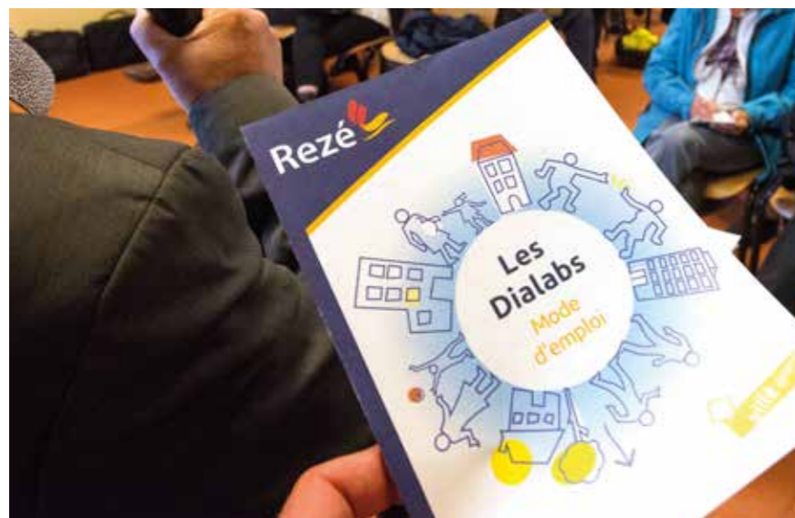
Les habitants ont répondu présents pour le premier Dialab de La Houssais.

Faire vivre la démocratie, c'est aussi engager le dialogue, confronter ses idées, rechercher des solutions entre habitants et élus du territoire. Pour donner de l'élan à une citoyenneté active, la Ville de Rezé a mis en place les Dialabs.