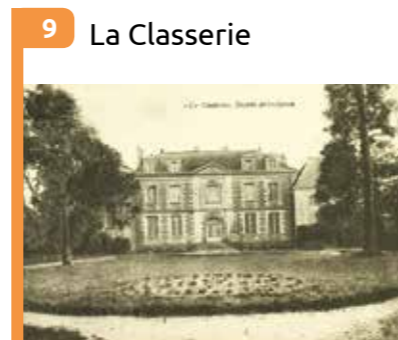
9 La Classerie Édifée au 18 e siècle par le négociant nantais Darquistade.