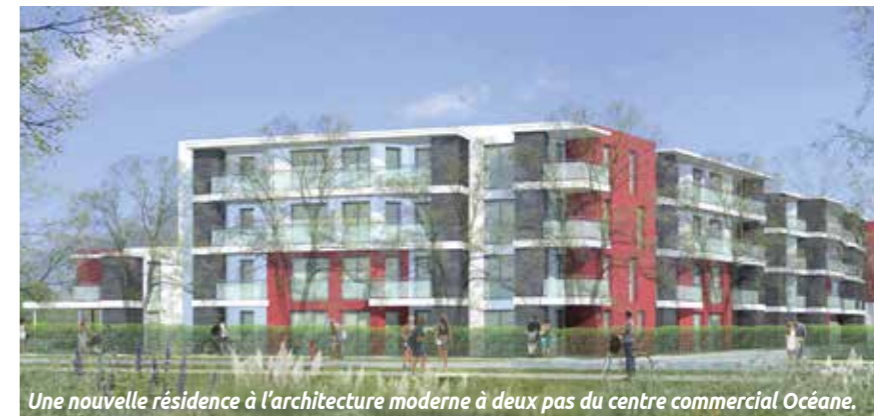
Une nouvelle résidence à l'architecture moderne à deux pas du centre commercial Océane.