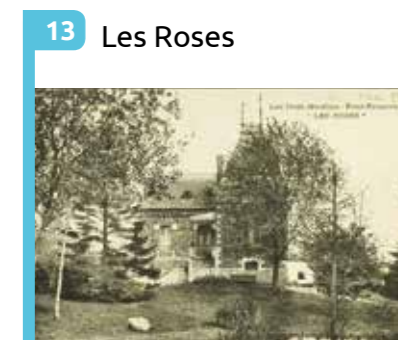
13 Les Roses Villa bourgeoise, début 20 e siècle, remplacée par l'immeuble collectif des Trois-Moulins.