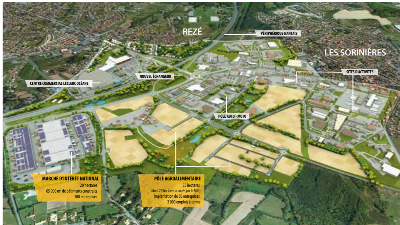
© LOD (Loire Océan Développement) - LOMA (Loire Océan Métropole Aménagement)