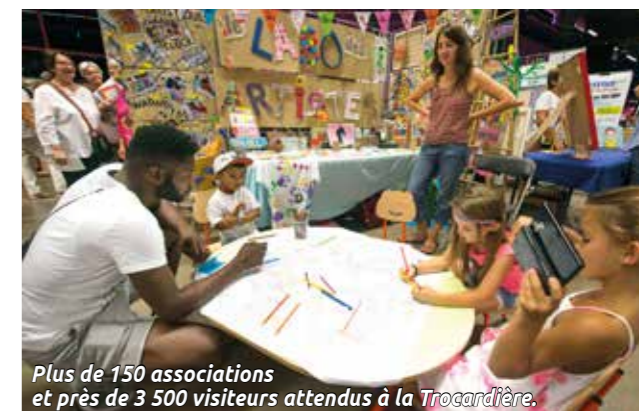
Plus de 150 associations et près de 3 500 visiteurs attendus à la Trocardière.

Événement incontournable de la rentrée, le forum des associations de Rezé se tiendra, samedi 9 septembre, à la Trocardière, avec cette année, une amplitude horaire plus large, et une ouverture dès 11h. Véritable vitrine des associations, ce sera pour les 154 d'entre elles présentes sur place, l'occasion de se faire connaître, de promouvoir leurs activités, de rencontrer les habitants, d'échanger avec eux, et surtout de favoriser l'engagement. Et pour les 3 500 visiteurs attendus, de découvrir la richesse des offres existantes. Et ce, dans des domaines aussi divers que le sport, la culture, les loisirs, la solidarité, la santé, le social, le développement durable... Pour cette 18 e édition, deux nouveautés s'invitent au rendez-vous : un pôle culturel qui réunira l'école municipale de musique et de danse, la médiathèque Diderot, La Soufflerie et le service patrimoine et mémoire de la Ville ; un autre pôle valorisera les nouvelles formes de bénévolat, il sera tenu par France Bénévolat, la Jeune Chambre Économique et Empower Nantes. Une pléiade d'animations (initiations, démonstrations sportives,