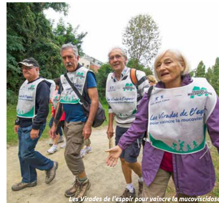
Les Virades de l'espoir pour vaincre la mucoviscidose.

À moto, à pied, à vélo, ils seront des milliers à venir « donner du souffle à ceux qui en manquent », dimanche 24 septembre au Chêne-Gala, à l'occasion des Virades de l'espoir. Un rendez-vous hautement sportif pour sensibiliser le public à la mucoviscidose, une maladie rare et génétique qui atteint les voies respiratoires et le système digestif. Avec l'objectif de récolter des dons au profit de l'association Vaincre la mucoviscidose. Le tout, dans une ambiance festive et familiale, conviviale et solidaire portée par près de 200 bénévoles. Au programme : randonnées pédestres ou à vélo, courses à pied, balades à moto, marche familiale. Sans oublier les spectacles, les concerts et autres animations ludiques qui rythmeront cette journée placée sous le signe de l'espoir. L'édition rezéenne de l'an dernier avait permis de collecter 60 600 euros. Un record qui n'attend que d'être battu, comme cette maladie.