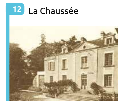
12 La Chaussée Propriété du 18 e siècle. Seule subsiste la chapelle édifée par les moines de St-Clément.