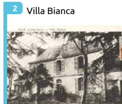
2 Villa Bianca Maison bourgeoise du 19 e siècle, démolie en 1958 pour construire un immeuble collectif.