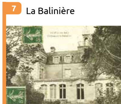
7 La Balinière Château du 18 e siècle, abrite depuis 1999 l'école municipale de musique et de danse.