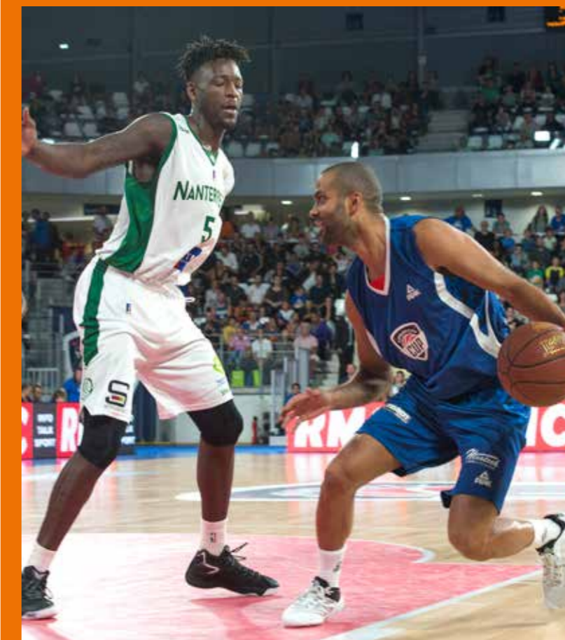
Appart City Cup, les 9 et 10 septembre.

C'est l'événement basket de référence avant le démarrage de la saison. L'Appart City Cup sera de nouveau à Rezé les 9 et 10 septembre prochains. Un plateau sportif d'exception : Nanterre 92, l'AS Monaco, Valence Basket et le FC Barcelone pour un tournoi européen de très haut niveau. Cerise sur