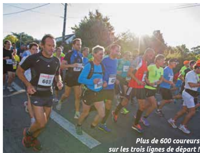
Plus de 600 coureurs sur les trois lignes de départ !

Pour le semi-marathon, les coureurs partiront à 9h pour trois boucles de sept kilomètres entre route et chemins piétonniers. Suivra la nouveauté 2017 : la Rozéenne. Départ à 10h30 pour cinq kilomètres. Course sur route, le défi Raballand démarrera à 9h30. Au terme de 10 km, l'équipe de quatre coureurs ayant cumulé les meilleures places sera récompensée.