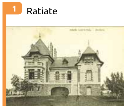
1 Ratiate Villa bourgeoise édifée en 1912 par l'entrepreneur Julien Marchais.

Découvrez l'histoire plus détaillée de ces châteaux et belles demeures sur le site reze.fr (rubrique Découvrir Rezé/Patrimoine)