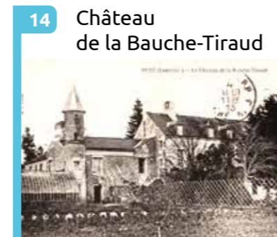
14 Château de la Bauche-Tiraud Maison noble des 16 e et 17 e siècles, démolie en 1998, sauf l'Orangerie (galerie Océane).