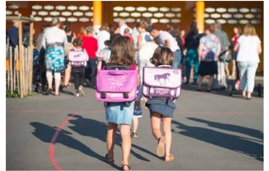
À la rentrée, les élèves découvriront les deux vidéoprojecteurs interactifs installés dans chaque école élémentaire.