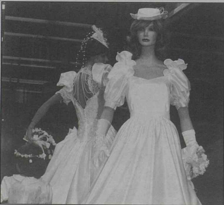
Robes, rubans et strass pour mariage d'éclat.

23 et 24 février 10 h-21 h - Halle de la Trocardière.