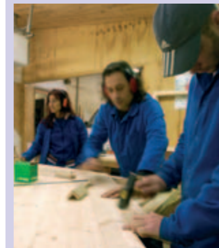
L'insertion, une des priorités du Cucs.

Créé par l'Etat, le contrat urbain de cohésion sociale (Cucs) régit les interventions en faveur des quartiers en difficulté. Sa vocation : apporter des améliorations en matière d'emploi, de logement, de réussite éducative, de santé... A Rezé, trois zones bénéficient de telles aides : Château-Mahaudières, Pont-Rousseau nord et Ragon est-sud. Quant à la Blordière, elle disparaît du dispositif, "signe que les actions menées sur ce quartier ont porté leurs fruits", selon Gilles Retière.