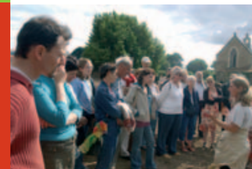
Journées de l'antiquité

Visites guidées sur réservation au 02 40 84 43 96. Samedi 3 mars, 10h. Mercredis 14 et 21 mars, 15h. Tarif : 3 €.