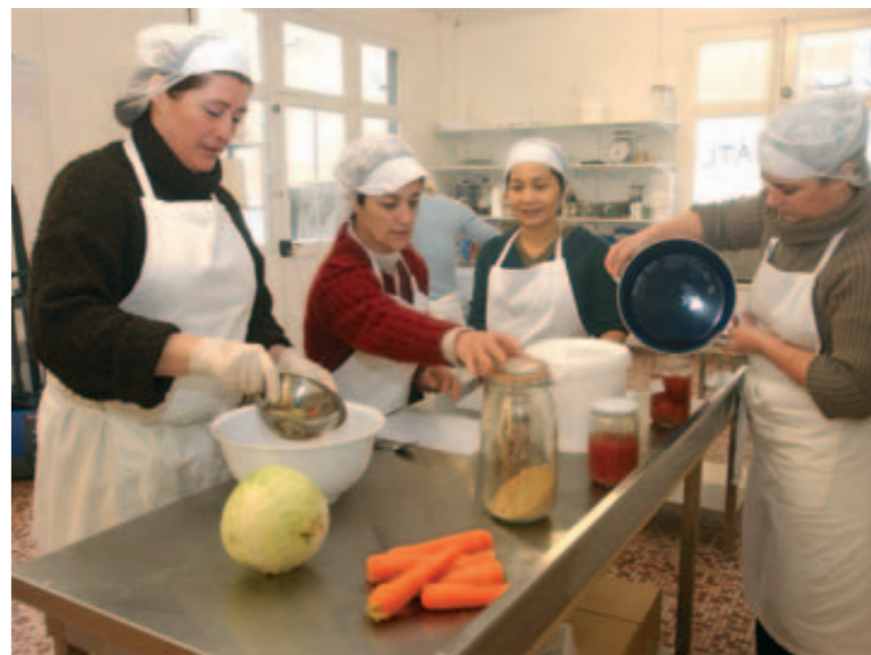
La transformation des légumes ouvre des perspectives d'emploi.

Atelier Méli-Mélo, 53, rue de la Commune-de-1871. Vente des produits : vendredi de 9 à 13 h. Rens. 02 40 05 29 93.