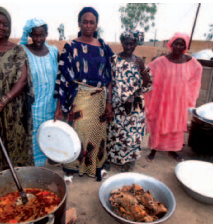
Un concert pour financer un centre d'accueil.

Concert : vendredi 16 mars, église du Rosaire, 20h30. Réservations : Arc 02 51 70 78 00, Leclerc Atout Sud 02 51 70 70 40. Tarif : 10 €. Gratuit pour les moins de 12 ans.