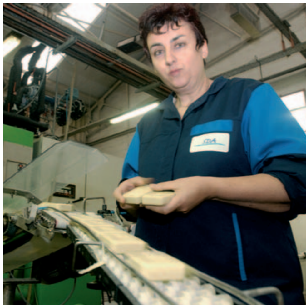
Un an après sa création, l'entreprise emploie 39 personnes.

"Nous nous sommes recentrés exclusivement sur notre cœur de métier : la savon dur de ménage, de toilette et de parapharmacie." Exit les gels douche, shampoings et lessives : "D'autres sont meilleurs que nous sur le marché des produits liquides".