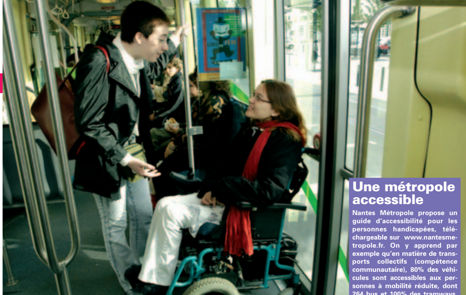
100 % des tramways accessibles aux personnes handicapées.

Bâtiments, information municipale, emploi... La Ville agit dans différents domaines pour faciliter l'intégration des personnes handicapées.