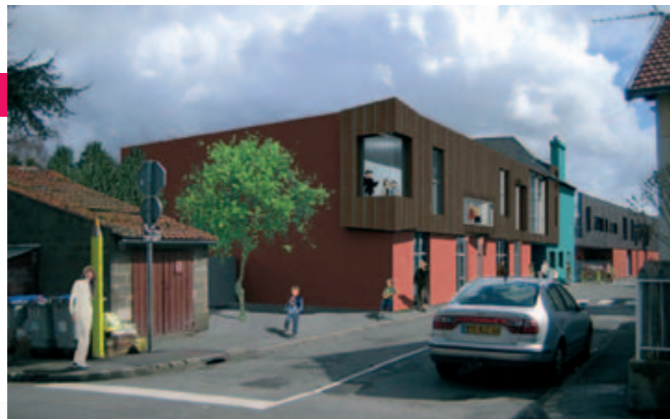
L'aspect de l'école Jean-Jaurès, une fois les travaux achevés.

Après avoir débattu de ses grandes orientations en décembre, le conseil municipal a adopté le budget 2007.