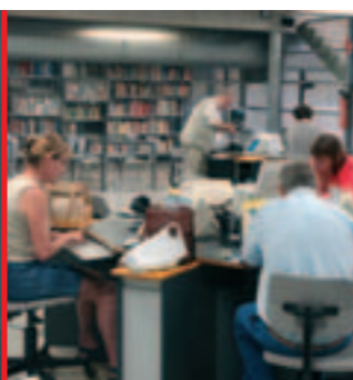
Samedi du net