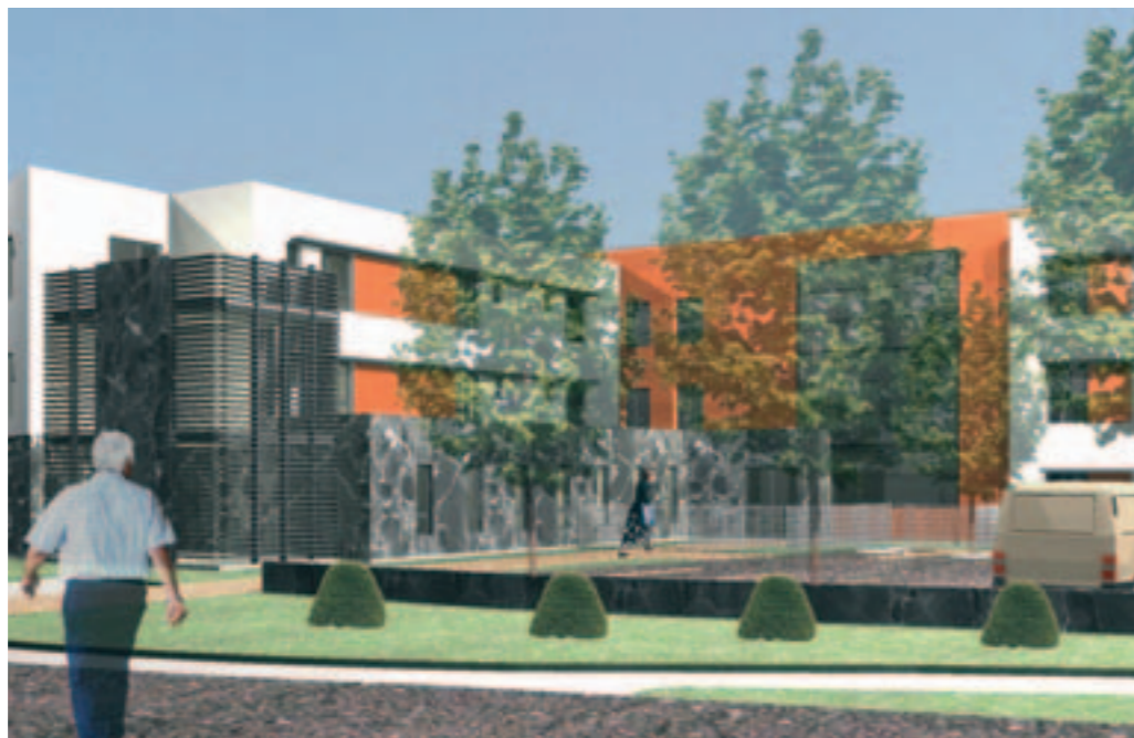
Esquisse de la future résidence pour personnes âgées, les Jardins du Vert-Praud.

Ouverture du vestiaire les 1 er , 7, 14 et 24 mars de 9h à 12h et de 14h à 17h30. Rens. 02 51 70 03 81.