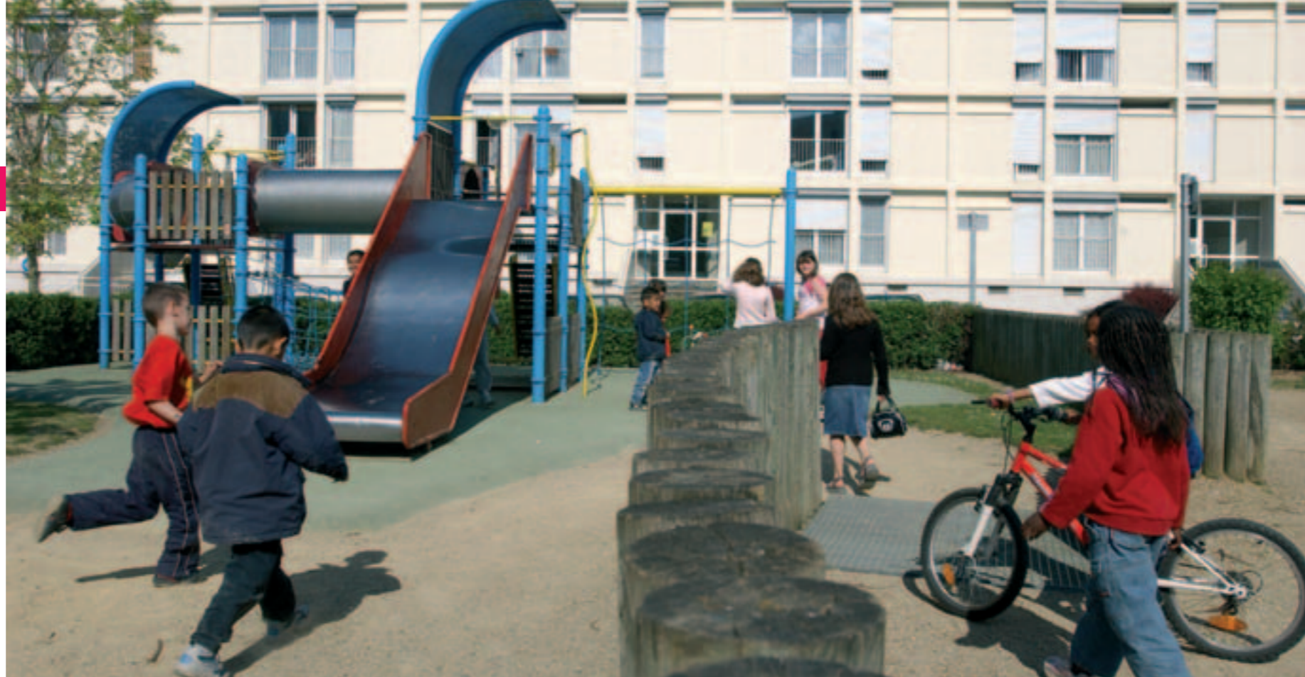
De nouveaux crédits pour lutter contre la précarité au Château.

Davantage de moyens financiers pour les quartiers Château, Pont-Rousseau et Ragon. Pour améliorer la vie de leurs habitants.