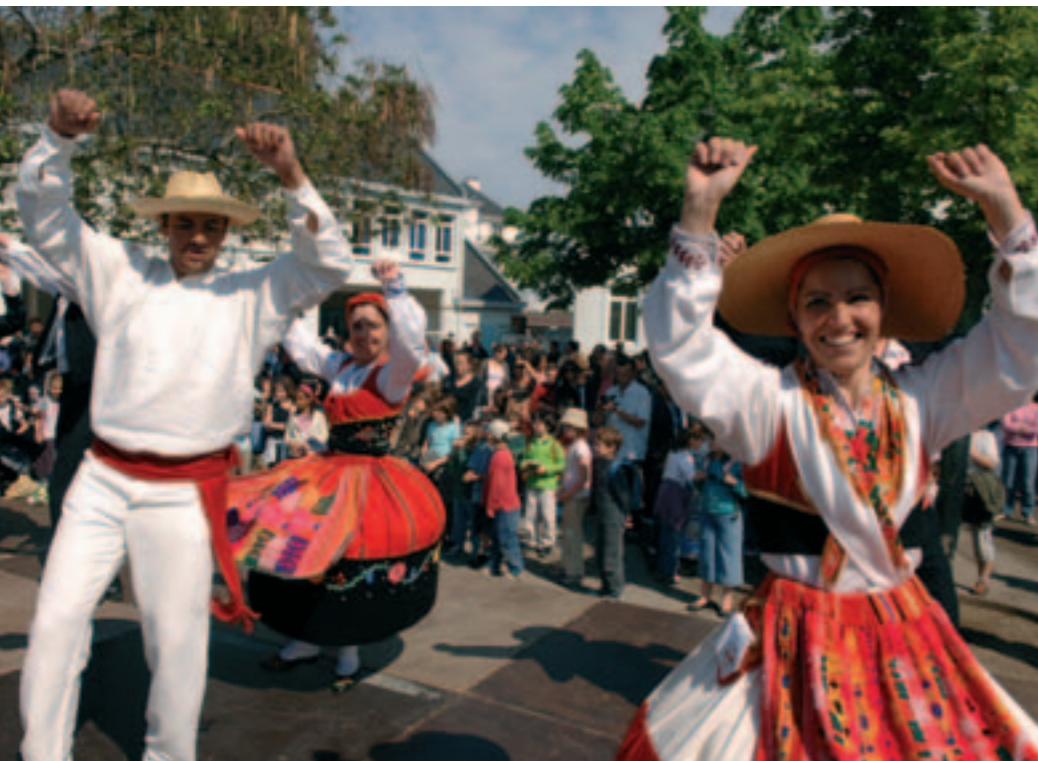
Fête aux couleurs du Portugal le 28 avril dans la cour.

Diversité et richesses de l'Europe en classe et sur place... Pour 25 élèves de Salengro.