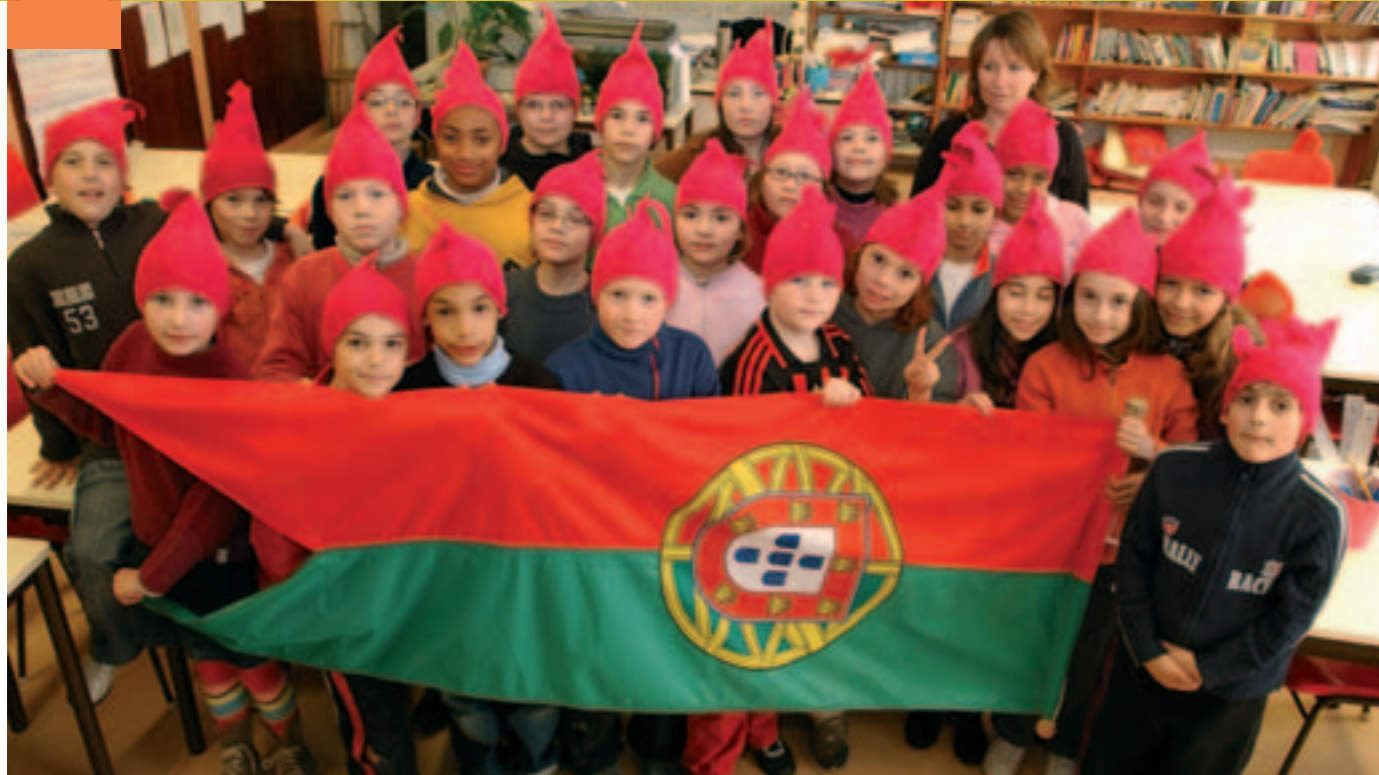
Les CM1 de Salengro avant de boucler leur valise pour Leiria.