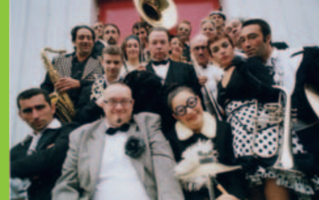
La fanfare Jo Bithume

Le musée Dobrée et la Ville de Rezé s'associent pour un week-end autour de la ville antique de Ratiatum. Le samedi matin, promenez-vous parmi les vestiges du port antique de Rezé, le dimanche après-midi, visitez les collections gallo-romaines du musée. Ces visites menées par des animateurs du patrimoine auront lieu samedi 7 juillet et dimanche 8 juillet à 16h.