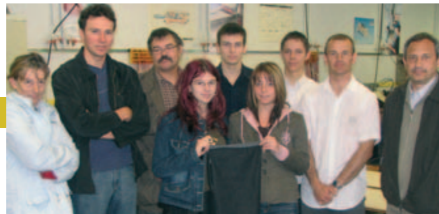
Des étudiants de Jean-Perrin créent une entreprise.