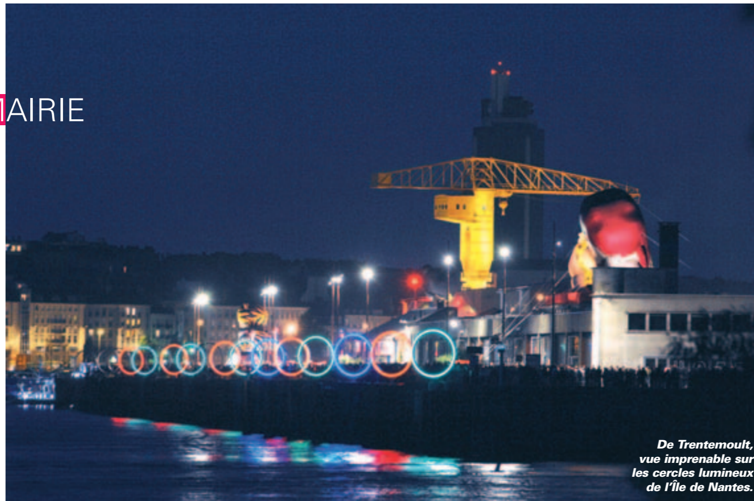
De Trentemoult, vue imprenable sur les cercles lumineux de l'île de Nantes.

Canard géant, maison flottante, cercles lumineux... Tout l'été, les œuvres d'Estuaire 2007 offrent une vision insolite de la Loire et de ses rives. Une invitation à un voyage pas banal.