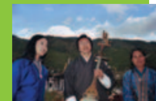
Trio Druk Yul du Bouthan