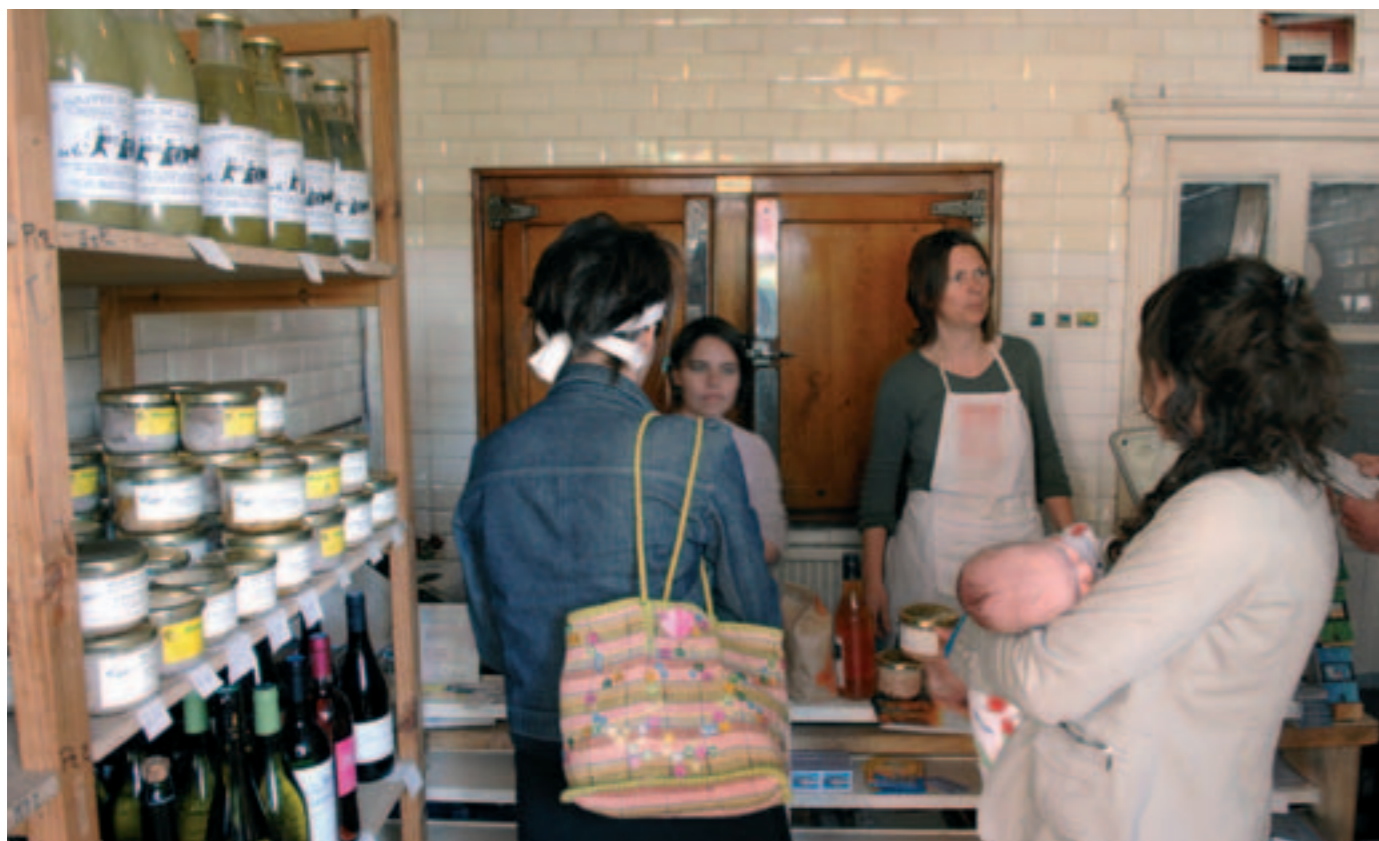
Une adresse associative pour s'approvisionner en produits de la ferme, bio...