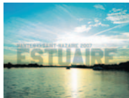
"Estuaire 2007" à Trentemoult