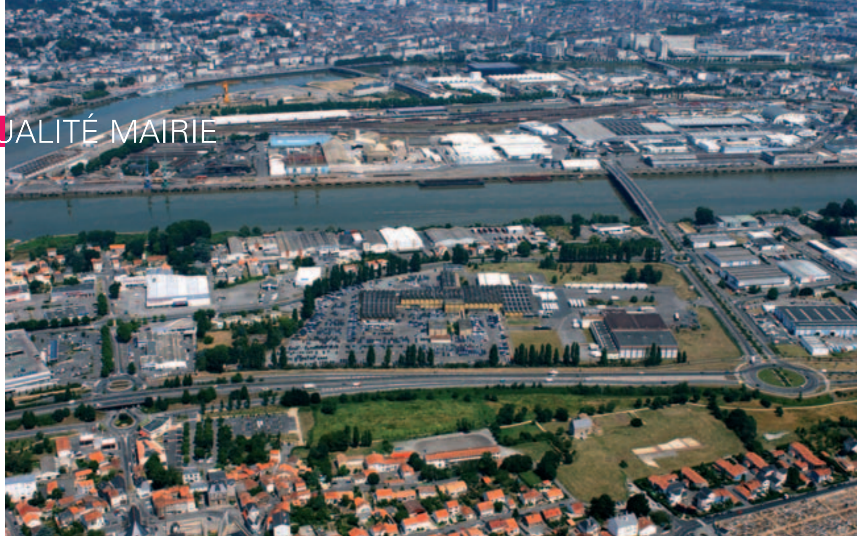
Face à l'Île de Nantes, la future zone des Isles.