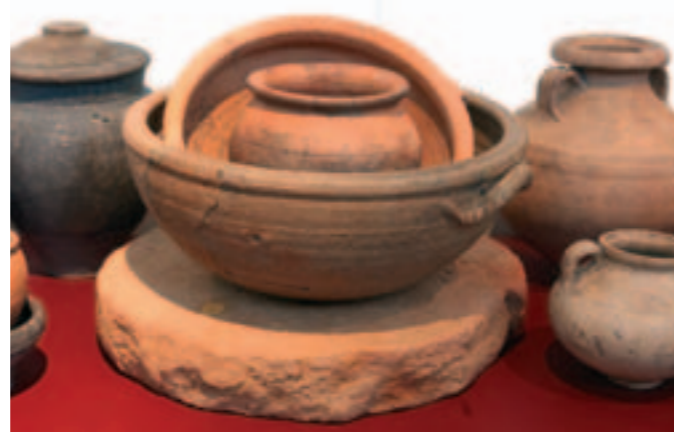
Visitez le port antique le 7 juillet et le musée Dobrée le 8 juillet.

les Morues (ska punk), Bad prophecy (hardcore). Vendredi 6 juillet, de 16h à 22h. Parc Paul-Allain (ex-square de la Fusée). Rens. CSC Château 02 51 70 75 75 www.barakason.com