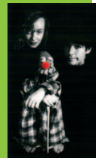
Théâtre, la C ie Hugo et Ines

■ PRÉSENTATION DE LA SAISON ARTISTIQUE 2007/2008 Vendredi 7 septembre à 19h au théâtre municipal de Rezé. Rens. 02 51 70 78 00.