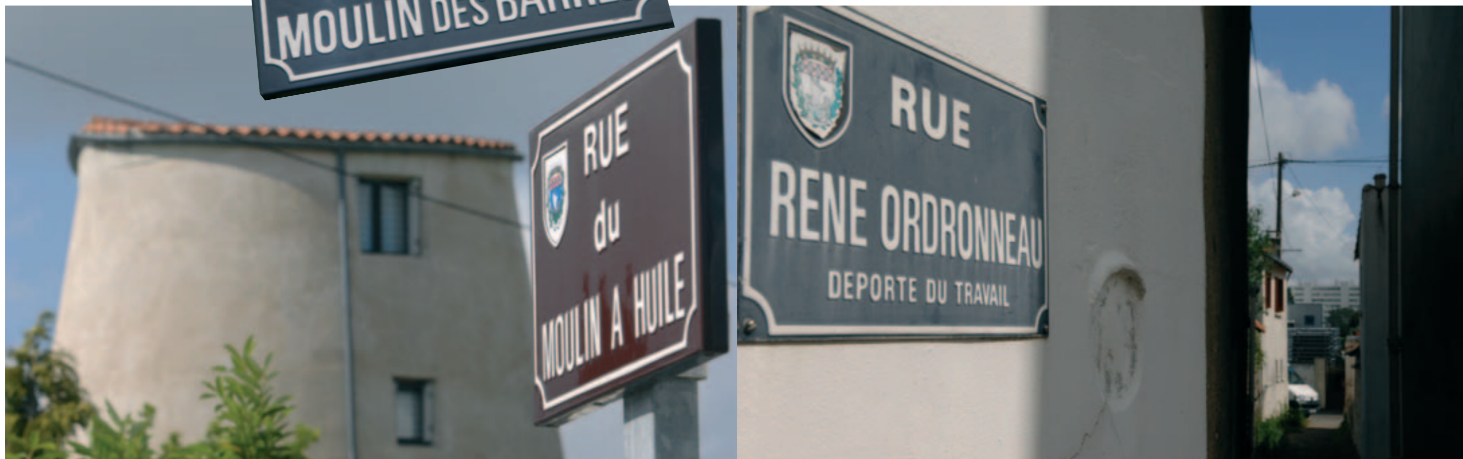
Les noms de rue des Moulins évoquent l'activité passée.