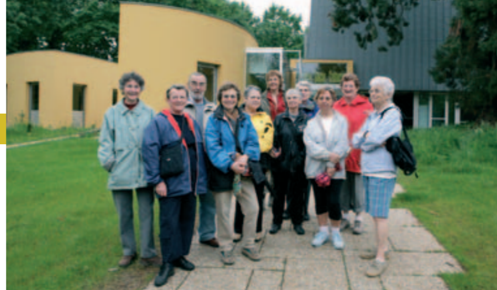
Découvrir la ville en toute convivialité.

Épicerie du port, 15 quai Marcel-Boissard. Ouverte tous les jours de 18h30 à 20h30 et de 11h à 13h30 le week-end. Rens. 09 63 21 15 53 ou epicerieduport@laposte-net