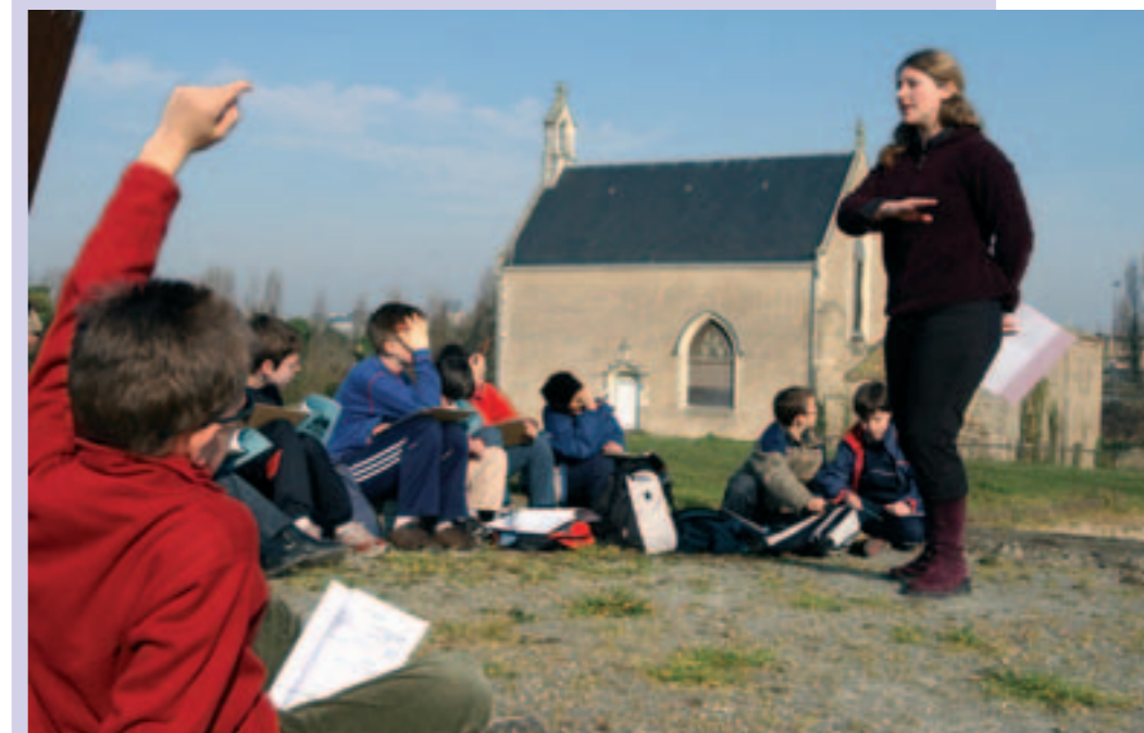
Les collégiens de la Petite-Lande à la découverte du patrimoine.

Les comptes administratifs ont été approuvés par la majorité. L'opposition s'est abstenue.