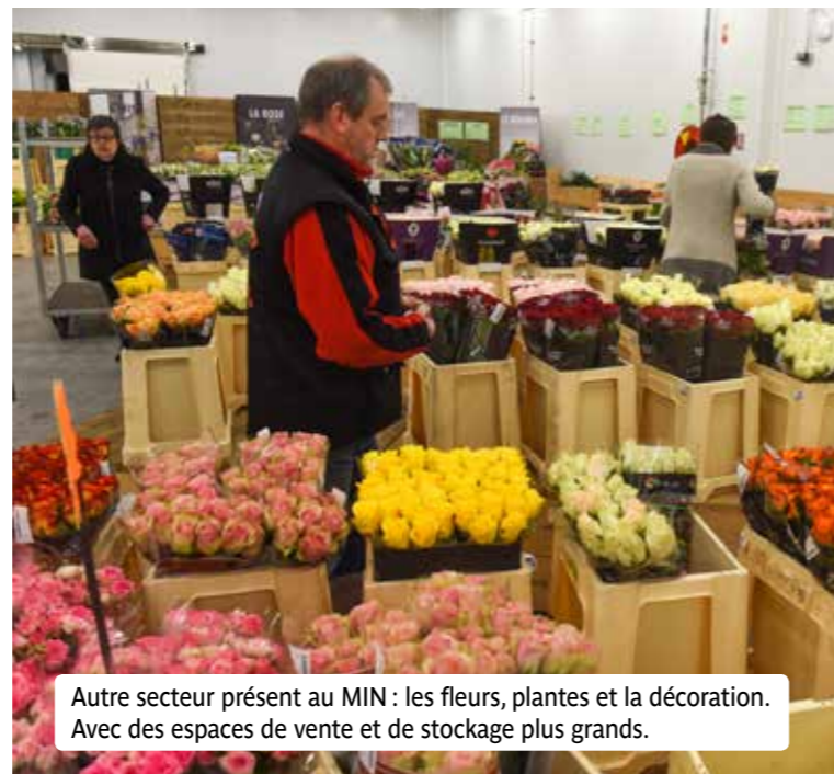
Autre secteur présent au MIN : les fleurs, plantes et la décoration. Avec des espaces de vente et de stockage plus grands.