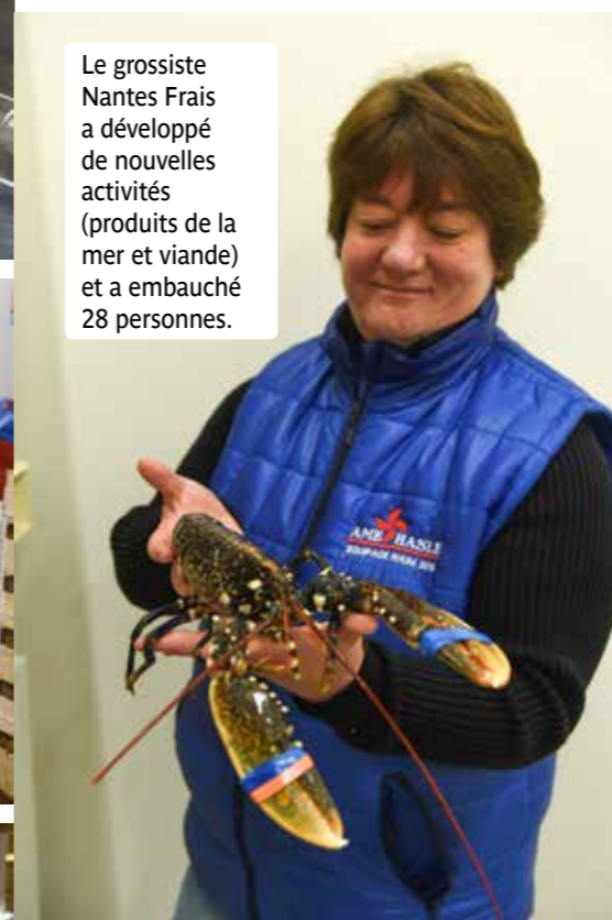
Le grossiste Nantes Frais a développé de nouvelles activités (produits de la mer et viande) et a embauché 28 personnes.