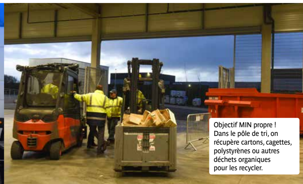
Objectif MIN propre ! Dans le pôle de tri, on récupère cartons, cagettes, polystyrènes ou autres déchets organiques pour les recycler.