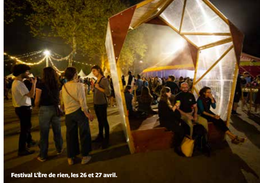
Festival L'Ère de rien, les 26 et 27 avril.