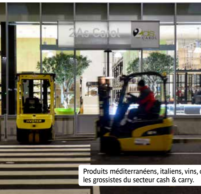
Produits méditerranéens, italiens, vins, olives, foie gras, épicerie, produits frais, crèmerie... ont pris place sur des étales chez les grossistes du secteur cash & carry.