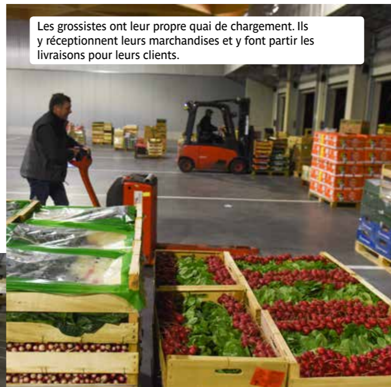
Les grossistes ont leur propre quai de chargement. Ils y réceptionnent leurs marchandises et y font partir les livraisons pour leurs clients.