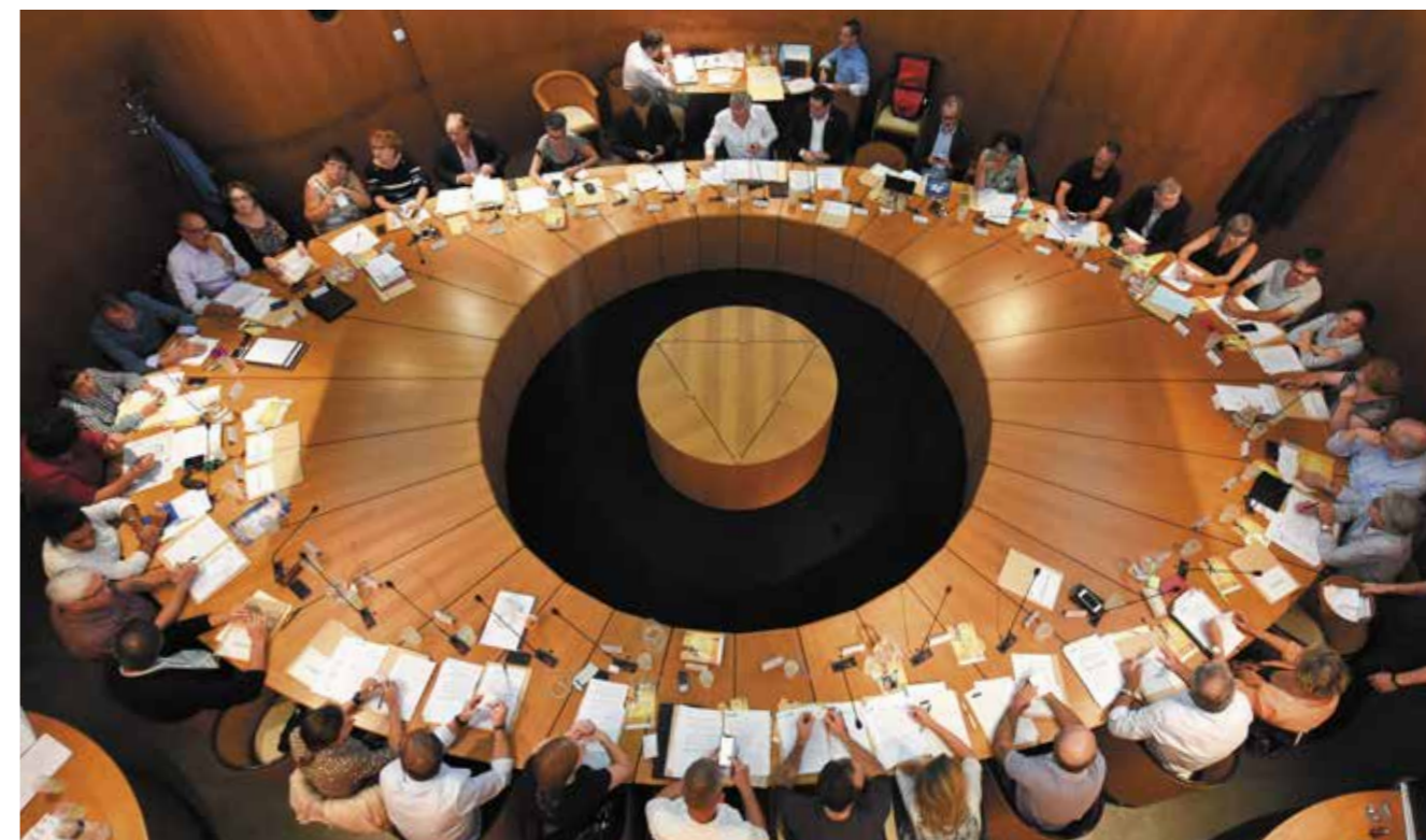
Groupe de la minorité