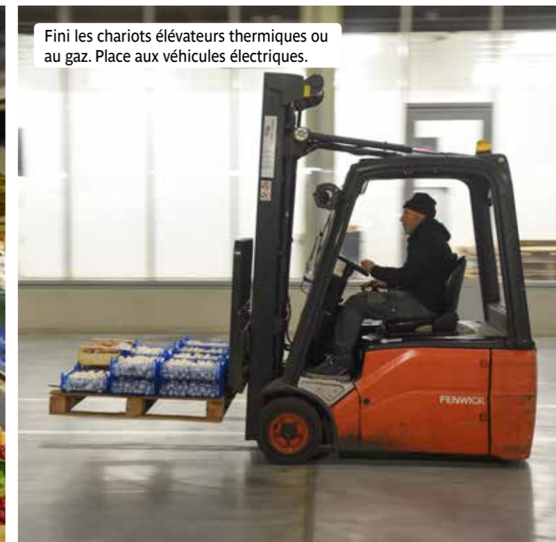
Fini les chariots élévateurs thermiques ou au gaz. Place aux véhicules électriques.