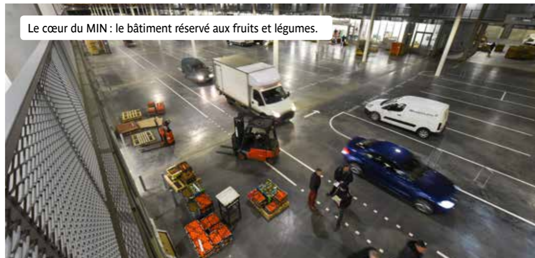
Le cœur du MIN : le bâtiment réservé aux fruits et légumes.