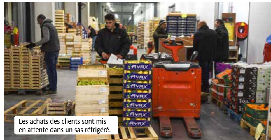
Les achats des clients sont mis en attente dans un sas réfrigéré.