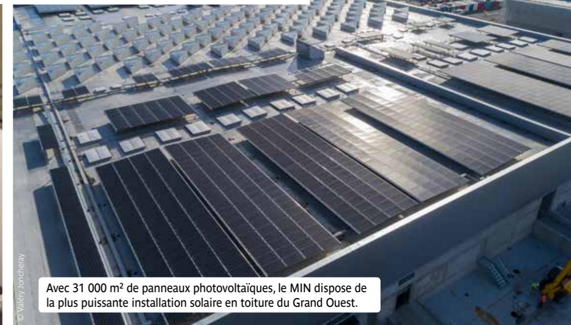
Avec 31 000 m 2 de panneaux photovoltaïques, le MIN dispose de la plus puissante installation solaire en toiture du Grand Ouest.