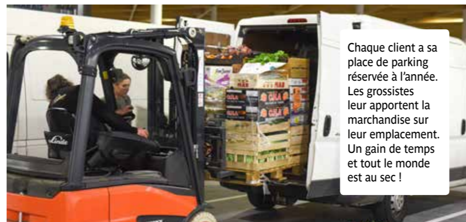
Chaque client a sa place de parking réservée à l'année. Les grossistes leur apportent la marchandise sur leur emplacement. Un gain de temps et tout le monde est au sec !