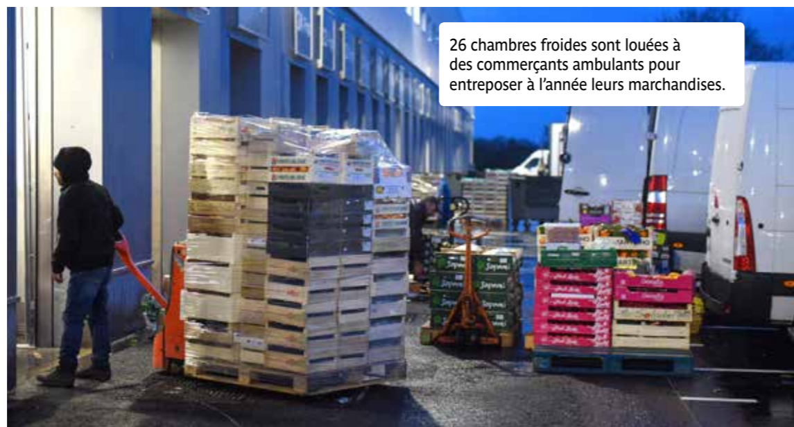
26 chambres froides sont louées à des commerçants ambulants pour entreposer à l'année leurs marchandises.

L'arrivée du MIN a donné naissance à un pôle agroalimentaire qu'il faut désormais appeler Nantes Agropolia. Une vingtaine d'entreprises sont aujourd'hui installées autour du marché de gros. Certaines, présentes dans l'ancien MIN, ont construit leur propre bâtiment. À terme, une cinquantaine d'entreprises y seront basées.