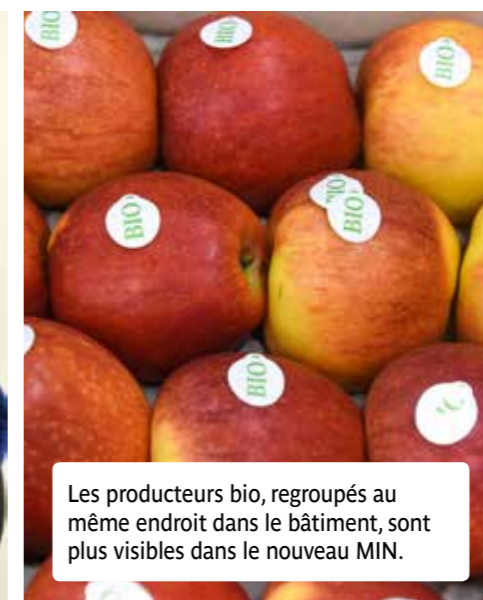
Les producteurs bio, regroupés au même endroit dans le bâtiment, sont plus visibles dans le nouveau MIN.