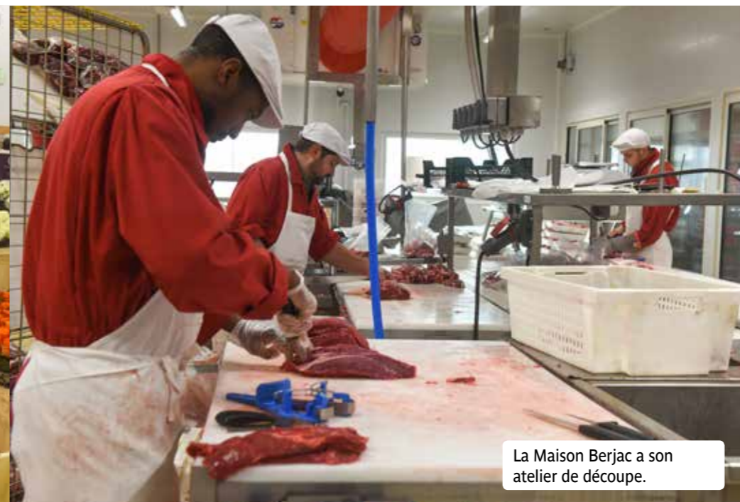
La Maison Berjac a son atelier de découpe.