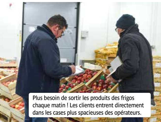
Plus besoin de sortir les produits des frigos chaque matin ! Les clients entrent directement dans les cases plus spacieuses des opérateurs.