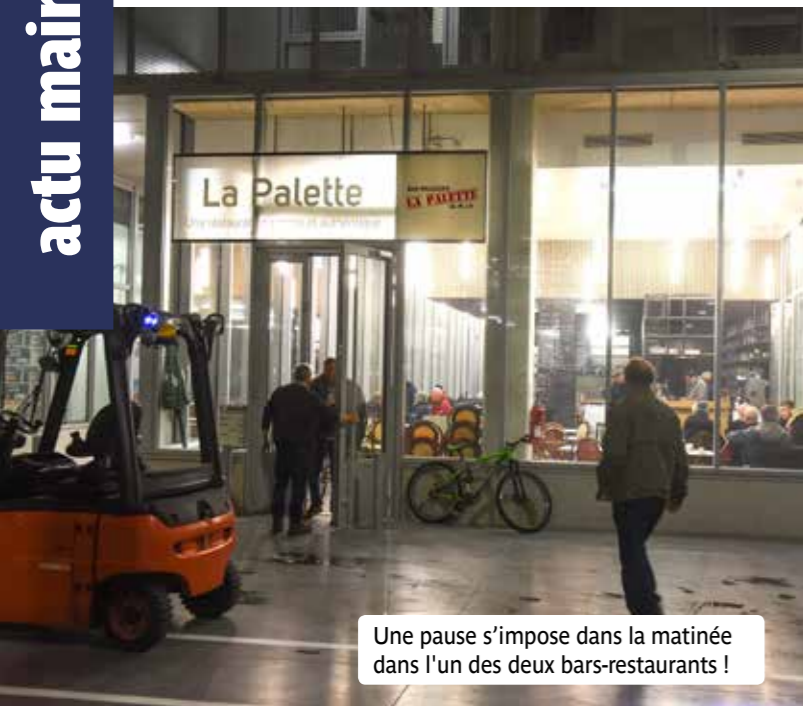
Une pause s'impose dans la matinée dans l'un des deux bars-restaurants !