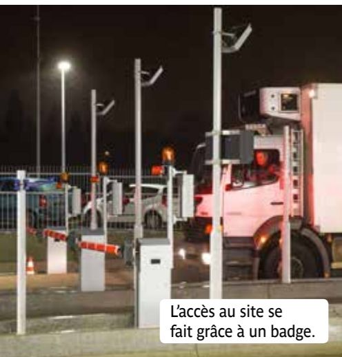
L'accès au site se fait grâce à un badge.

Ça y est ! Le nouveau Marché d'intérêt national (MIN) construit au sud de Rezé a ouvert ses portes aux premiers clients le 5 février. Les dernières entreprises y ont pris place début mars. Le changement est impressionnant, aussi bien pour les enseignes que pour les clients.