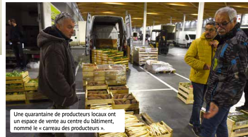
Une quarantaine de producteurs locaux ont un espace de vente au centre du bâtiment, nommé le « carreau des producteurs ».

Un site tout neuf, à la pointe de la technologie. Des espaces de vente plus grands, des locaux sur-mesure, conçus pour répondre aux besoins des entreprises et des clients. Un site plus respectueux de l'environnement. Le nouveau MIN ravit les opérateurs. Mais aussi les clients qui gagnent du temps. Le MIN de Nantes Métropole ferait même des jaloux du côté de Rungis. Coût de la construction : 130 millions d'euros HT (117 millions financés par la Métropole, 10 millions par l'État et 3 millions par la Région).