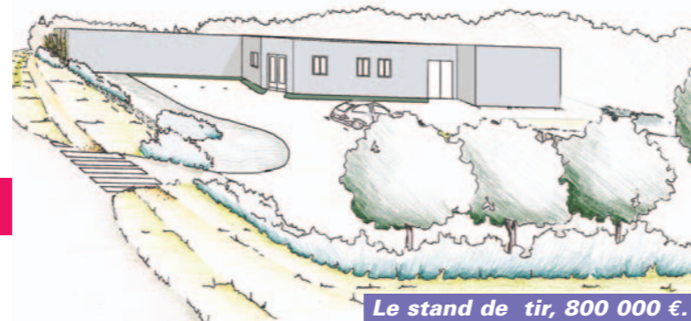
Le stand de tir, 800 000 €.