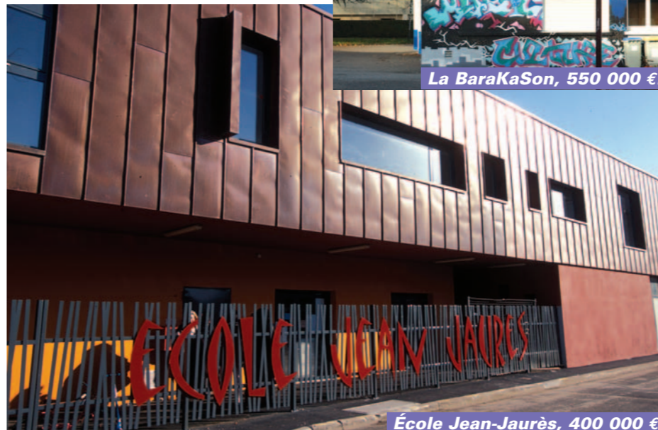
École Jean-Jaurès, 400 000 €.