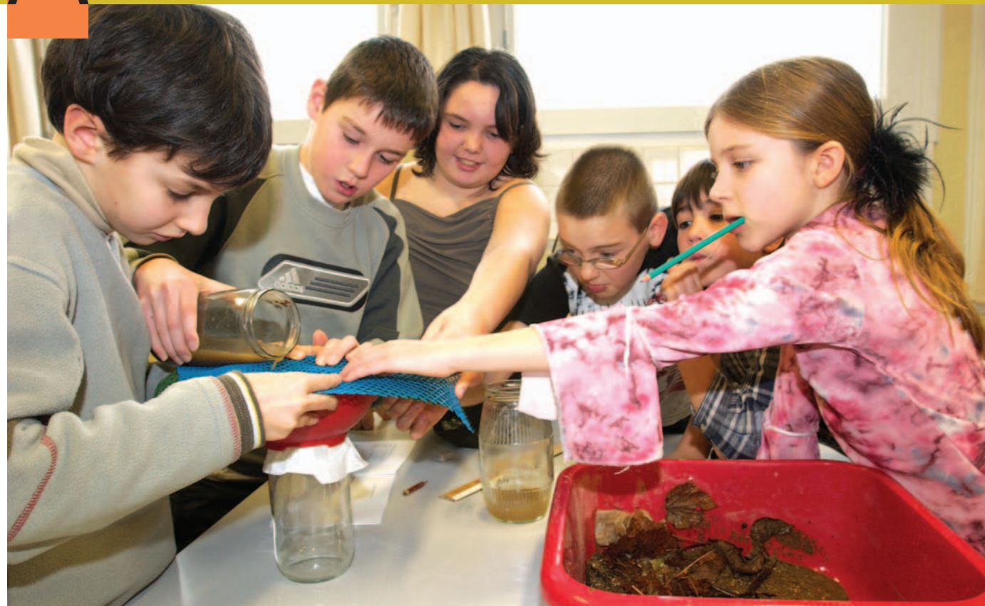
Exercice pratique : filtrage de l'eau et récupération des boues.