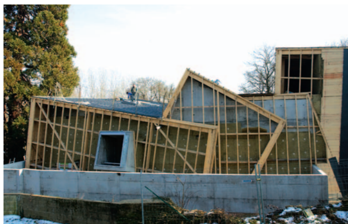
Le centre socioculturel Jaunais-Blordière, 741 000 €.