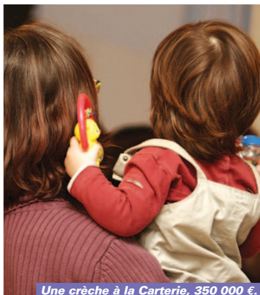
Une crèche à la Carterie, 350 000 €.