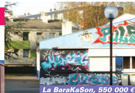
La BaraKaSon, 550 000 €.