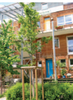
Les quartiers durables.

■ Soufly Soirée métal avec le chanteur-guitariste de l'ex-Sepultura et son groupe. Lundi 20 mars, 19h30, à La Trocardière, 19 à 24 €.