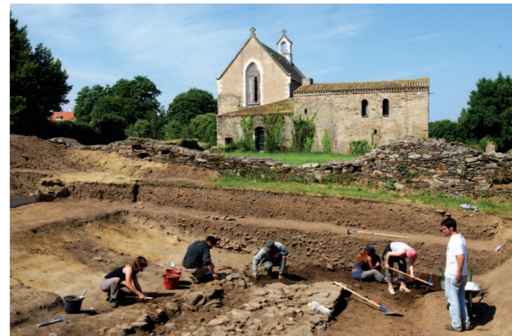
Une nouvelle campagne de fouilles doit avoir lieu au printemps prochain.

Conférence le 31 mars à 18h30 à l'Espace Diderot. Tout public. Entrée libre (p. 20).