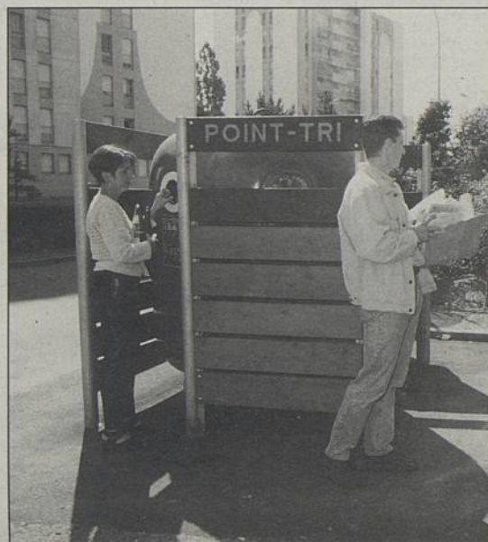
Une augmentation des points-tri pour desservir les grands immeubles.

A partir du mercredi 6 novembre, le ramassage des déchets recyclables sera modifié.