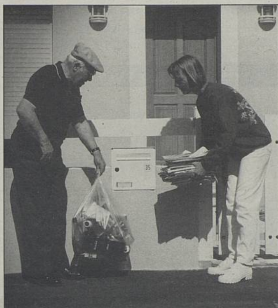
Un ramassage à domicile 1 mercredi sur 2 pour les maisons particulières et les petits immeubles.