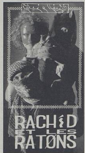
RACHID ET LES RATONS Samedi 16 Novembre

Samedi 16, ouverture des portes et apéro offert à 20h.