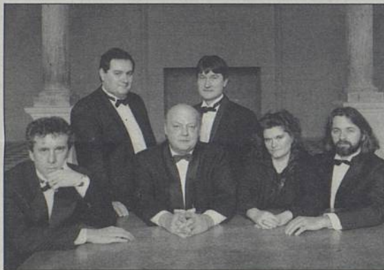
A SEI VOCI - Jeudi 7 Novembre

A Sei Voci. Plus de 50 musiciens pour revivre une messe festive du XVII e . Jeudi 7 à 21h, église du Rosaire rue Alsace-Lorraine. Tarif plein 90 F, tarif réduit 70 F, abonnés 55 F.