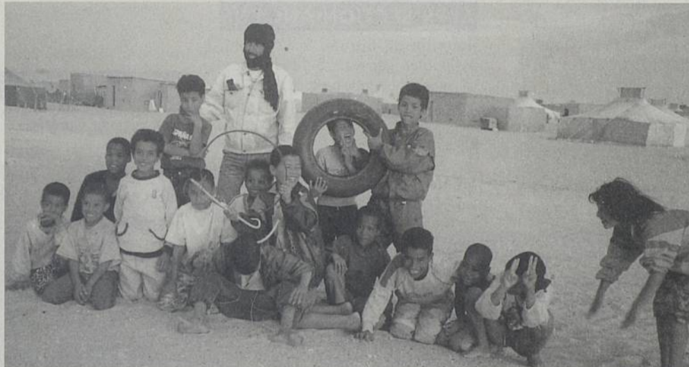
Les camps sahraouis comptent 165 000 réfugiés.

Depuis 1982 et l'accueil d'un groupe d'enfants réfugiés sahraouis au centre de vacances de la Pinelais, la ville de Rezé a renforcé ses actions de coopération avec le peuple sahraoui. Dernière initiative en date, pour répondre à une demande de l'association Enfants réfugiés du monde, l'envoi d'une partie du matériel du centre de soins municipal à l'école d'infirmiers des camps de réfugiés : boîtes d'instruments, pansements, table d'auscultation, armoire, meuble de rangement... En effet, pour Enfants réfugiés du monde, l'apprentissage des techniques de soins, aussi bien à l'école d'infirmiers que dans