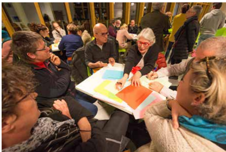
Première réunion de l'Observatoire citoyen des politiques publiques.

Deux nouveaux dispositifs de participation citoyenne ont été présentés aux Rezéens fin 2016. Tout d'abord, l'Observatoire citoyen des politiques publiques, dont la première réunion a rassemblé une quarantaine de personnes. Ensemble, celles-ci ont décidé de plancher sur le développement urbain et la place de l'habitant dans la cité. D'ici quelques mois, elles présenteront l'avancée de leur réflexion en séance publique. Simultanément, une trentaine de Rezéens ont participé à la présentation des Dialabs. Conçue pour être accessible au plus grand nombre, la nouvelle plateforme « Dialabs » (accessible sur www.reze.fr ) permet de demander une réunion dans son quartier. Grâce à un simple clic, votre demande est enregistrée et prise en compte par le service dialogue citoyen. Vous êtes également invité(e) à laisser