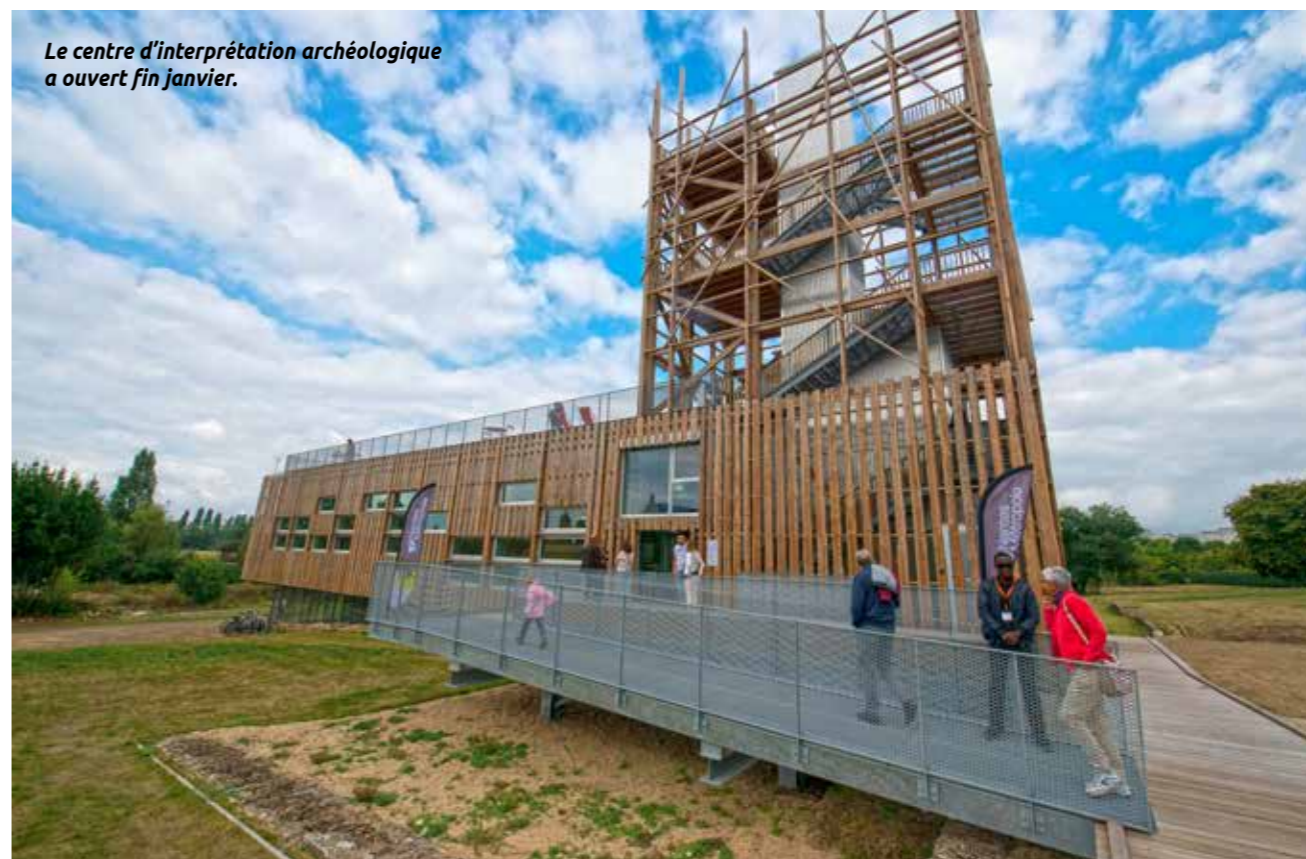
Le centre d'interprétation archéologique a ouvert fin janvier.