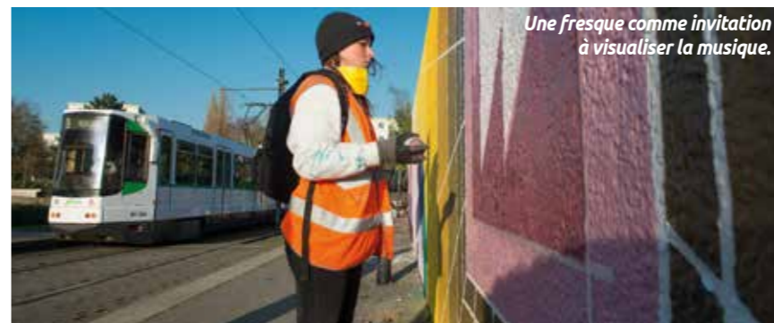
Une fresque comme invitation à visualiser la musique.

Les murs rezéens prennent des couleurs. Après Ragon et Château, c'est au tour de la station Balinière de s'ornier d'une fresque.