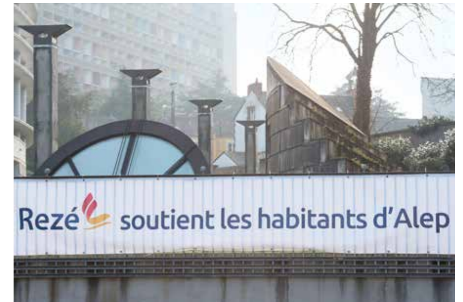
Rezé affiche son soutien aux habitants d'Alep sur le fronton de l'hôtel de ville.

Les habitants de la ville d'Alep en Syrie ont tout perdu à cause de la guerre. Les élus de Rezé veulent les aider. Ils vont donner de l'argent à la Croix-Rouge, une association humanitaire qui aide les habitants d'Alep.