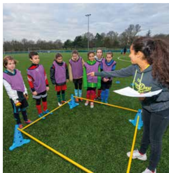
Les filles en force à l'AEPR football.