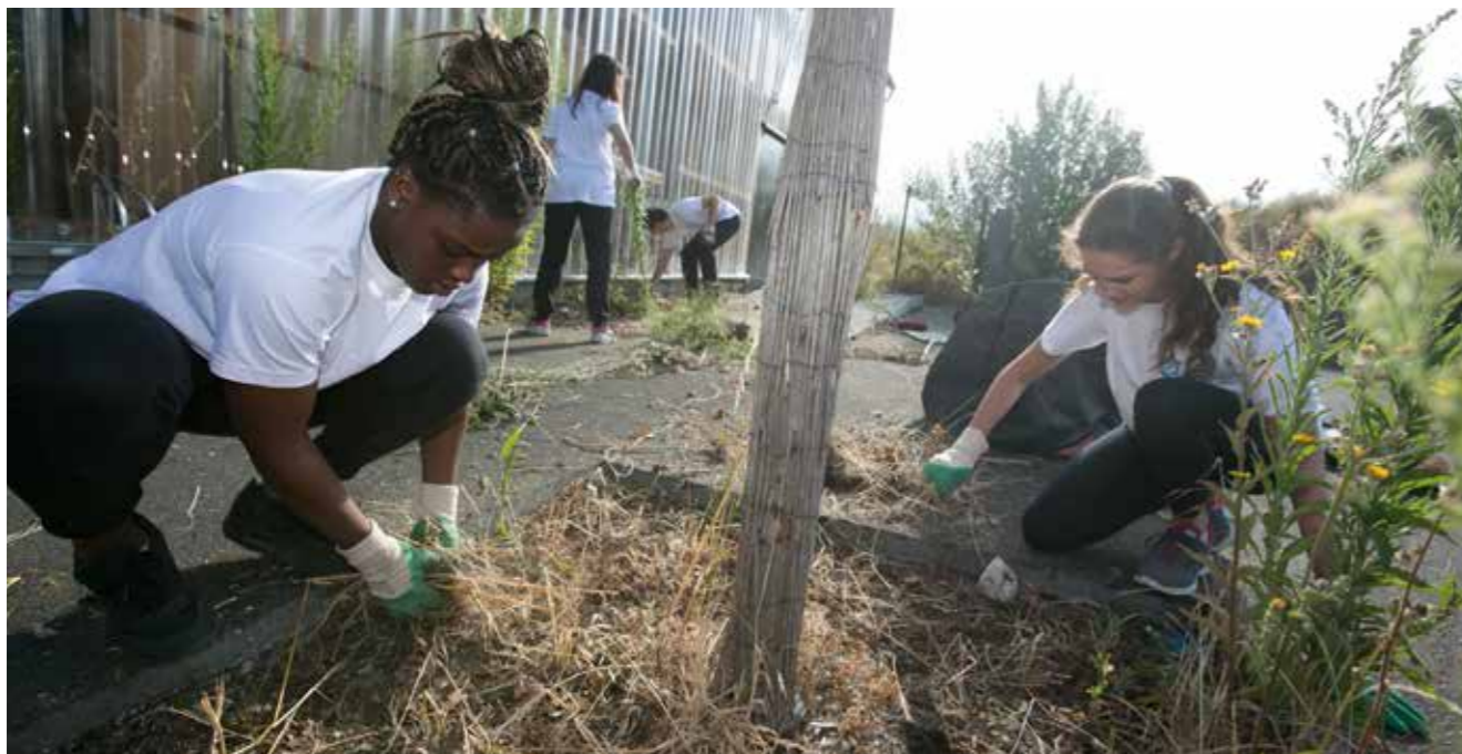
Treize jeunes, dont sept du quartier Château, ont proposé leurs services aux entreprises et aux particuliers l'été dernier, avec la Coopérative jeunesse de services.

Donner la priorité aux jeunes. Les élus de la majorité s'y étaient engagés. Plus de la moitié des actions inscrites dans le projet de la Ville en direction des Rezéens âgés de 11 à 25 ans sont déjà réalisées ou en cours de réalisation.