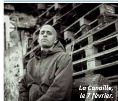
La Canaille, le 7 février.