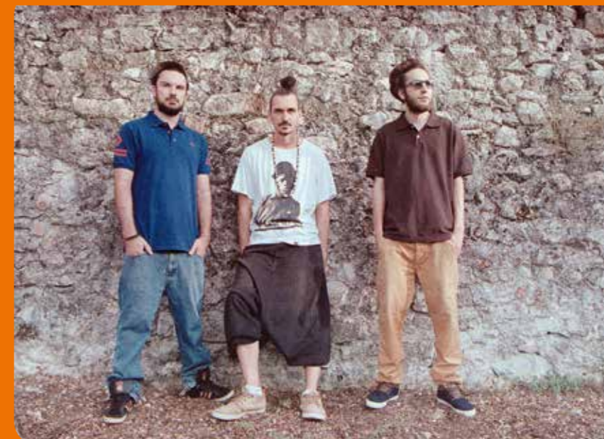
ASM Soundsystem, le 24 février.

Maison du développement durable Entrée libre