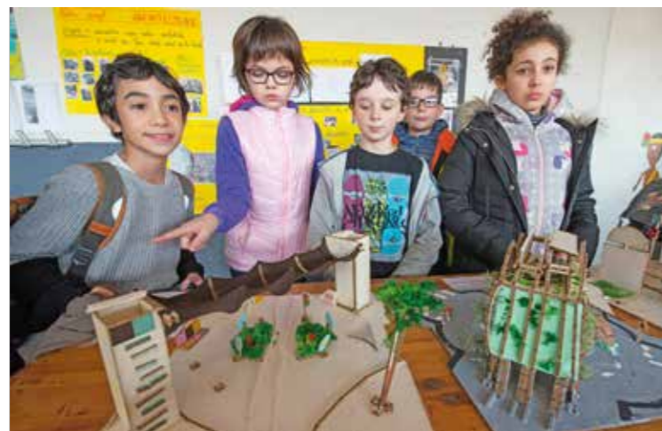
L'école Château-Sud : nouveau vivier d'apprentis architectes.