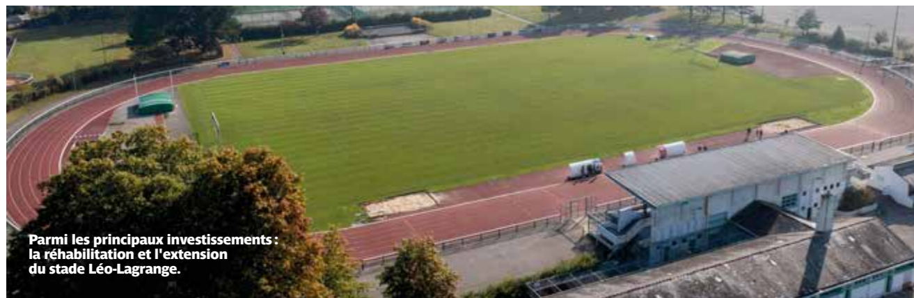
Parmi les principaux investissements : la réhabilitation et l'extension du stade Léo-Lagrange.