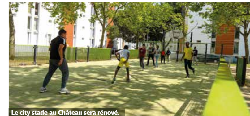
Le city stade au Château sera rénové.

La Ville veut développer le sport en plein-air. Au conseil municipal du 16 décembre, les élus ont acté les équipements qui seront rénovés et créés durant les trois prochaines années.