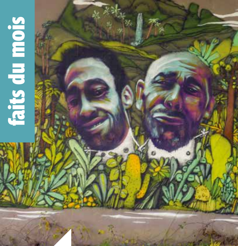
Pont des Bourdonnières