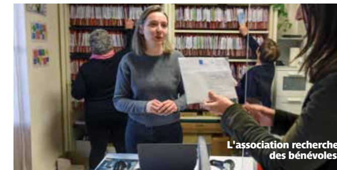
L'association recherche des bénévoles.

« Gens du voyage », « itinérants », « nomades », ou simplement « voyageurs »... Ces Français vivent traditionnellement de façon non sédentaire. Ils sont nombreux dans les environs de Rezé, où l'activité maraîchère requiert de longue date des travailleurs saisonniers. Depuis près de cinquante ans, l'association Services régionaux itinérants (SRI) aide ces habitants aux besoins spécifiques. Domiciliation (réception et distribution du courrier), alphabétisation des adultes, soutien scolaire au domicile des enfants, aide aux démarches administratives ou orientation vers les structures compétentes sont assurés par neuf salariés et une cinquantaine de bénévoles. Depuis 2007, un service accompagne aussi les travailleurs indépendants. « Nous avons toujours besoin de bénévoles, souligne