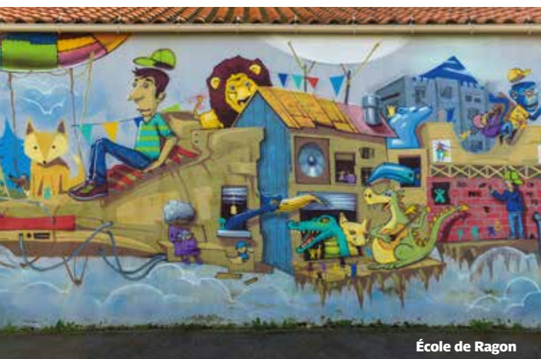
École de Ragon

INFOS – reze.fr (rubrique Pratique/Urbanisme et cadre de vie). Circuit fresques : reze.fr (rubrique La ville/Le territoire/Balades et parcs)