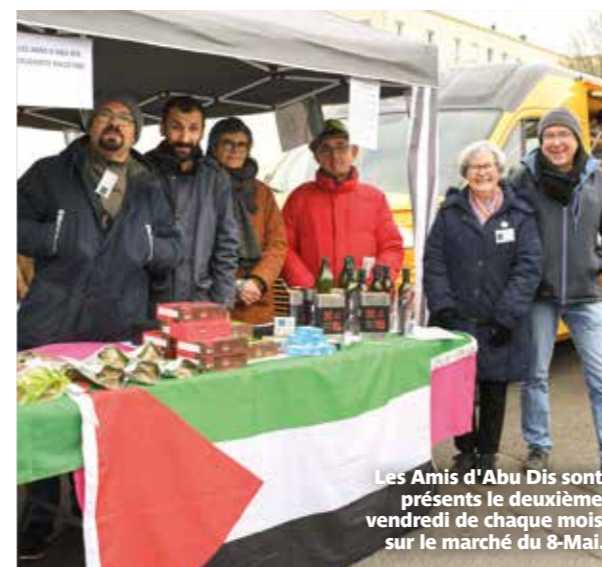
Les Amis d'Abu Dis sont présents le deuxième vendredi de chaque mois sur le marché du 8-Mai.

Une fois par mois, l'association les Amis d'Abu Dis vend quelques spécialités pour soutenir les producteurs palestiniens.