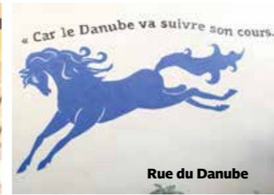
Rue du Danube