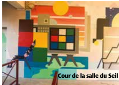
Cour de la salle du Seil