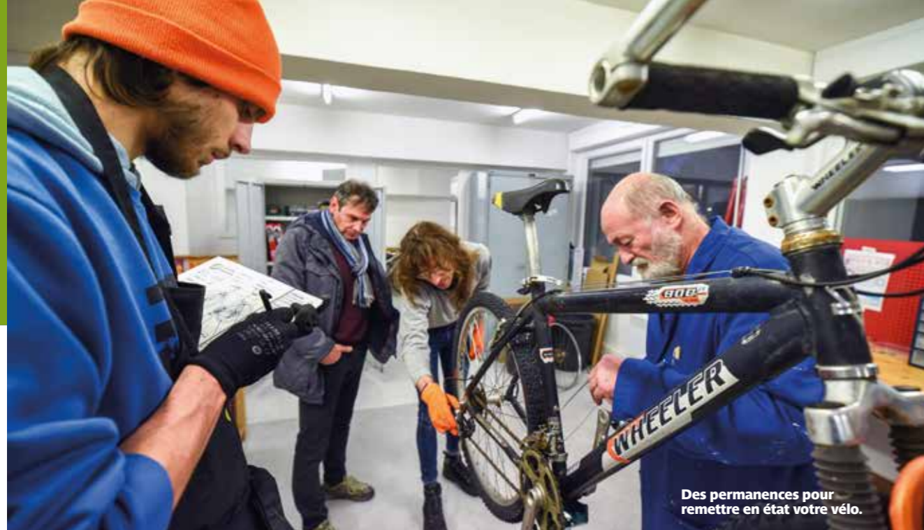
Des permanences pour remettre en état votre vélo.