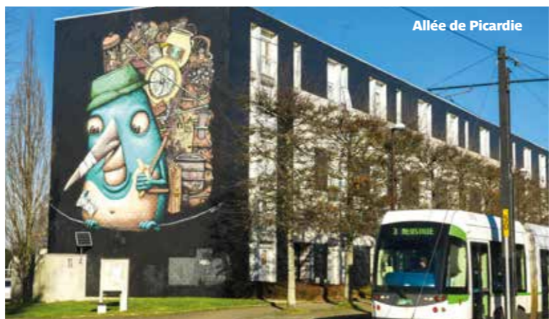
Allée de Picardie