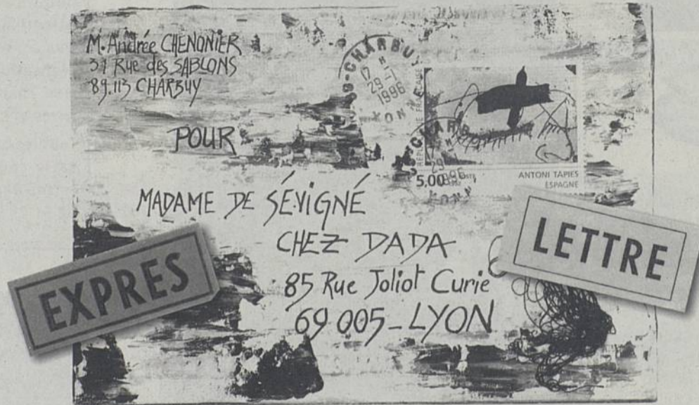
Extrait du livre « Le Sévigné, 19 artistes répondent à 19 lettres de la Marquise », disponible à la médiathèque Diderot.