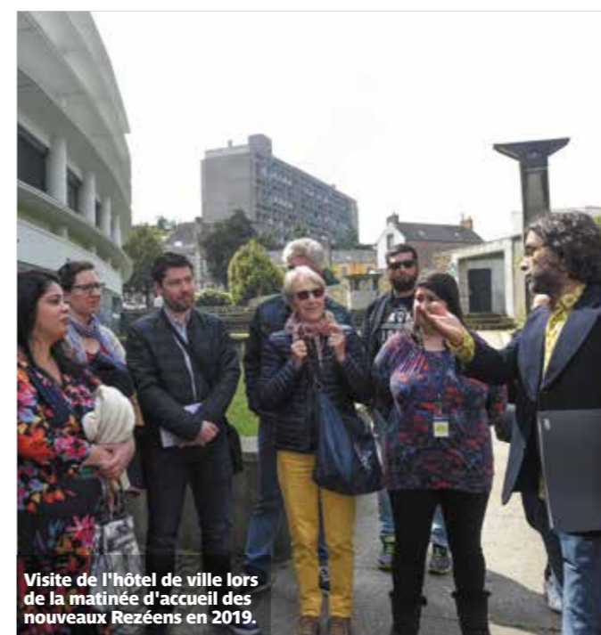
Visite de l'hôtel de ville lors de la matinée d'accueil des nouveaux Rezéens en 2019.