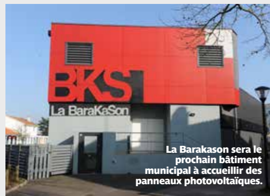
La Barakason sera le prochain bâtiment municipal à accueillir des panneaux photovoltaïques.

devrait accueillir des panneaux photovoltaïques en 2021. Chaque année, la Ville prévoit d'investir dans l'énergie solaire. L'objectif : atteindre 32 % de part d'énergie renouvelable en 2030, comme préconisé dans la loi sur la transition énergétique de 2015.