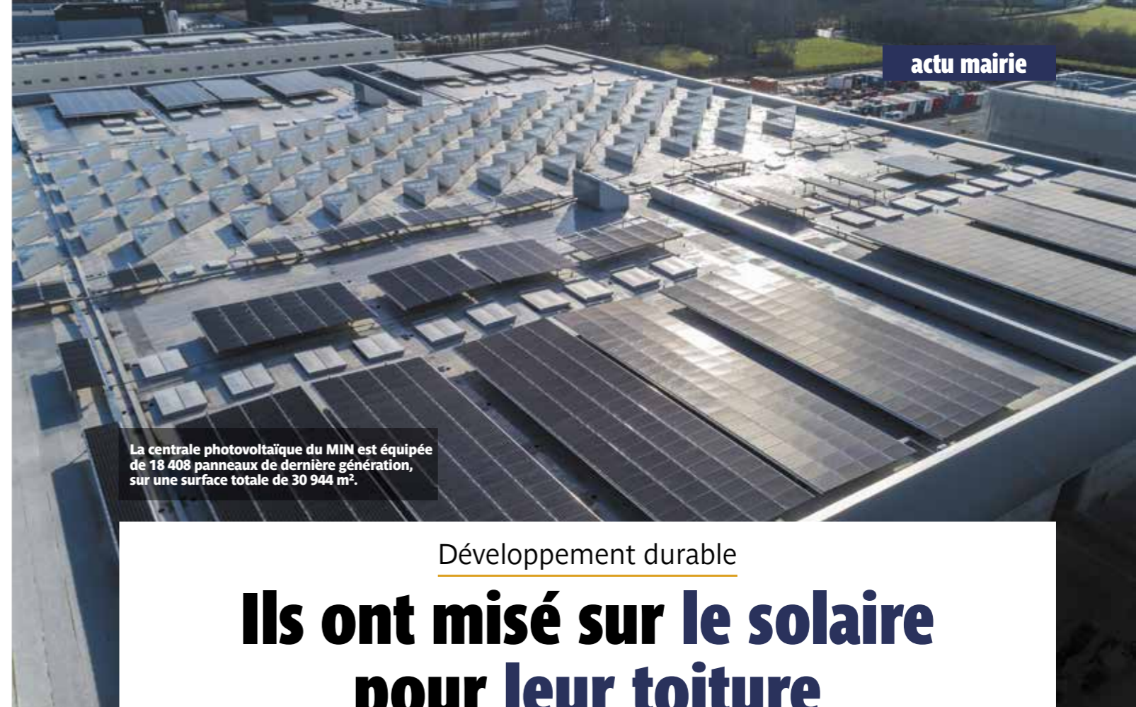
La centrale photovoltaïque du MIN est équipée de 18 408 panneaux de dernière génération, sur une surface totale de 30 944 m 2 .