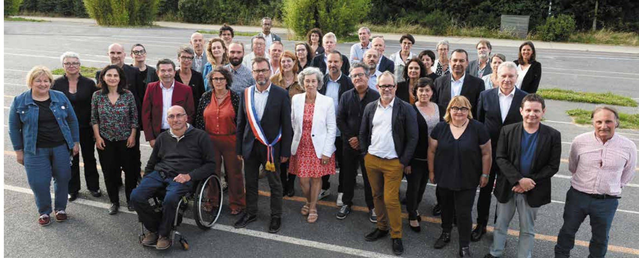
Groupes de la majorité

Retrouvez les tribunes des groupes sur reze.fr