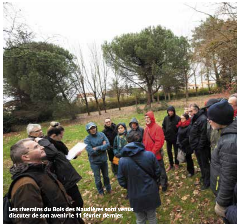
Les riverains du Bois des Naudières sont venus discuter de son avenir le 11 février dernier.

Au fil de leur balade dans le parc, les habitants ont exprimé leurs premiers souhaits en termes d'usage, d'équipements, d'accès et de sécurisation de cet espace de 8 000 m 2 richement boisé. Ils ont écouté attentivement le père Crusson, ancien séminariste aux