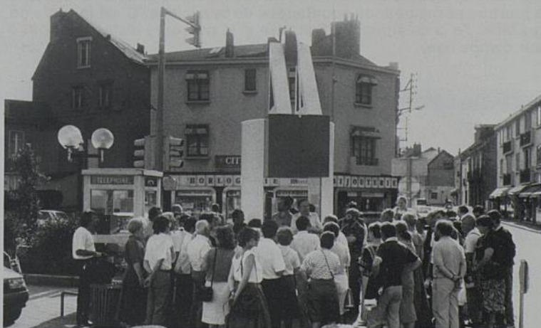
Un haut-lieu de la Révolution : Pont-Rousseau