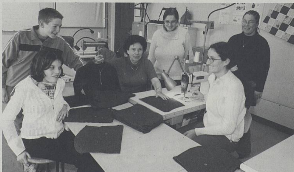
Des élèves du collège Salvador Allende fabriquent des vêtements en atelier couture.

La Ville lance la quinzaine de la citoyenneté des jeunes. Dans les écoles, les collèges et les structures de loisirs et d'animation de l'ARPEJ, des groupes d'enfants et de jeunes ont mené ou s'apprennent à mener des actions citoyennes. Ils les présenteront du 10 au 21 mai à la Maison des projets. Au total, 30 initiatives seront exposées sur des thèmes aussi divers que l'environnement, la solidarité, les droits et les devoirs, ou le « vivre ensemble ».