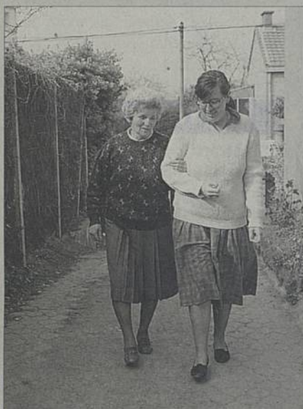
Rompres la solitude : un des objectifs de l'accueil du jour.

Rezé envisage la mise en place d'un accueil de jour dans les maisons de retraite de la commune. Concrètement, il s'agit de proposer à des personnes âgées dépendantes et hébergées dans leur famille, ou qui vivent seules à leur domicile, d'être accueillies à la journée dans des établissements spécialisés. Cette prise en charge permettrait de soulager les familles : le personnel de la résidence prodiguerait les soins. En proposant des activités à la journée, cette mesure serait aussi une réponse à la solitude dont souffrent de nombreuses personnes âgées.