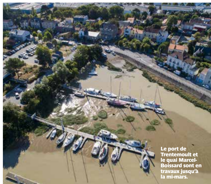
Le port de Trememout et le quai Marcel-Boissard sont en travaux jusqu'à la mi-mars.

Deux opérations sont en cours à Trememout : la rénovation du quai Marcel-Boissard et le dragage du port. Elles se dérouleront jusqu'au printemps..