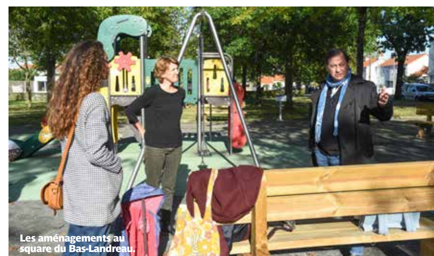
Les aménagements au square du Bas-Landreau.

Autre lieu, autre fréquentation. Le square du Bas-Landreau, réaménagé autour de jeux pour enfants de 2 à 8 ans, est devenu un « spot » régulier pour les parents et leurs enfants à la