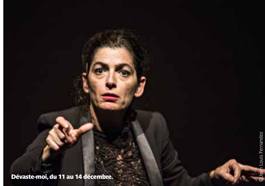
Dévaste-moi, du 11 au 14 décembre.