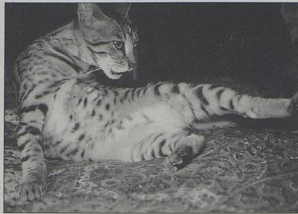
Chat Bengal, surnommé le «léopard de poche».

▲ Exposition féline. Organisée par l'Office félin d'élevage de Loire et du Centre. Présentation de chats de différentes races, à poils courts, mi-longs et longs tels que Birmans, Chartreux, Orientaux, Persans, etc. Présence d'un chat très rare : le Bengal. Son surnom ? Le «léopard de poche». Les 19 et 20 de 10h à 18h30, à la Trocardière. Entrée : adultes, 25F ; 6-12 ans, 15F ; moins de 6 ans, gratuit.