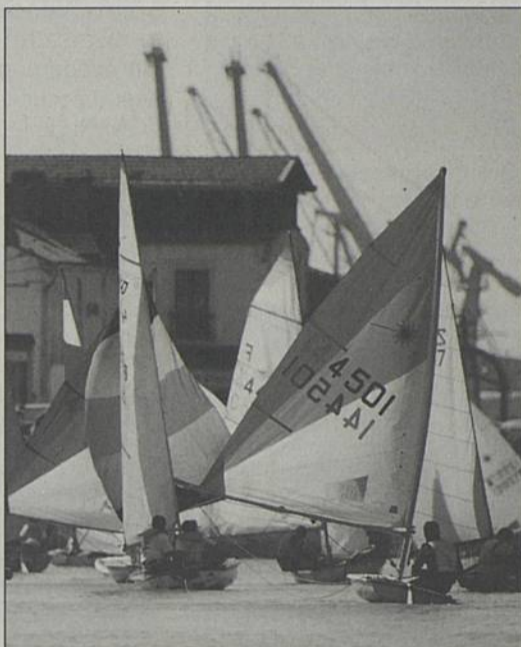
Le spectacle sera sur l'eau, mais aussi dans les rues...

D es dizaines de dériveurs quillards et habitables voile-avirons sont attendus le dimanche 27 sur la Loire pour participer à la 108 e édition des Régates de Trentemoult. Organisée par le Centre nautique Sèvre et Loire, avec la participation de la Ville, l'ARC, l'association Bouguenais contre-courants et la Ligue régionale de la Fédération française de voile, la manifestation avait drainé, l'an dernier, plus de 5 000 spectateurs.