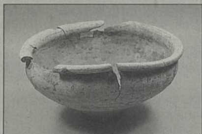
Des visites guidées auront lieu à St-Lupien et sur le site des Bourderies où les fouilles archéologiques se poursuivent.

Une précision : la visite des appartements de la Maison Radieuse n'aura finalement pas lieu pour des raisons de sécurité, des travaux étant actuellement réalisés sur le site. L'accès au parc reste néanmoins possible.