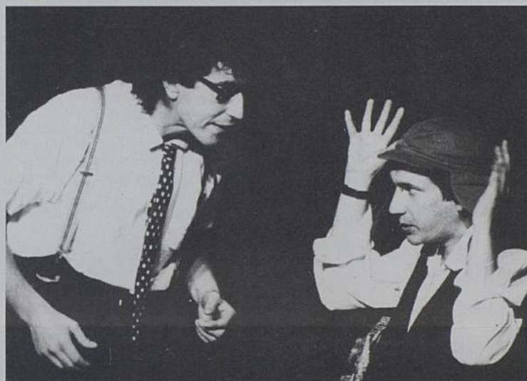
Azimuth et Trémouillé