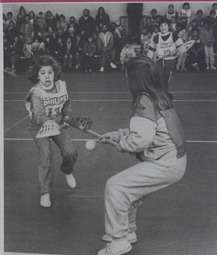
Samedi 23 Novembre, le 10ème gymnase rezéen a été inauguré : celui de l'Ouche-Dinier. Discours et démonstrations sportives ont égayé cette journée, avec notamment une partie «crosse québécoise», nouveau sport enseigné dans les écoles.