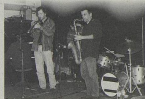
L'ensemble UNIT 5

«Big Up» soirée de clôture des 10 ans de JET FM, organisée par l'Éclipse, la MJC et Jet FM. Au programme : Lofofora (hard core), Grim Skunk (hard core, Montréal) et Bumpkins (tendance hard core Nantes). Exposition sur la répression et animations.