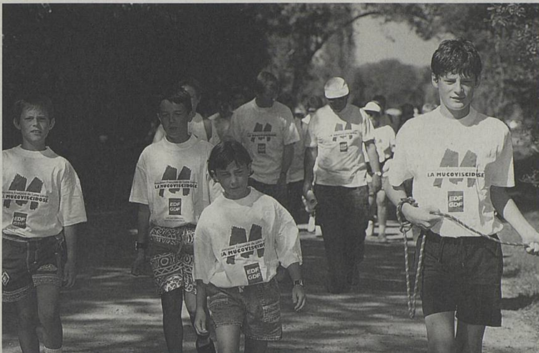
Comme l'an passé, les organisateurs de la Virade comptent sur la présence de nombreux jeunes pour lutter contre la mucoviscidose.

C'est quoi la Virade ? C'est une fête où adultes et enfants marchent pour d'autres enfants qui ne peuvent pas le faire car ils ont la mucoviscidose.