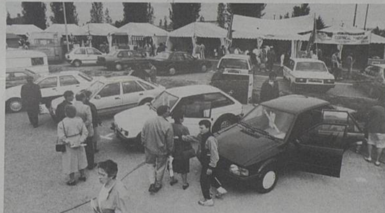
Foire Expo de Rezé - 88.

Inutile d'aller jusqu'à Nantes, pour toutes vos démarches (renseignements, réservations, réductions, cartes, billets, etc.) la gare de Rezé Pont-Rousseau est en mesure de vous offrir tous ces services : 40 75 65 24.