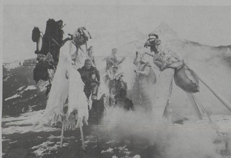
Du spectacle avec Malabar.

En tout cas la soirée sera chaude. Avec l'ARIA en ouverture et ses mélodies baroques. Avec Dadadang, Malabar, des groupes étranges qui font vibrer les pierres et frissonner les enfants. Avec un feu d'artifice qui embrasera la nuit rezéenne. Et en point d'orgue : un bal. Danserez-vous la Carmagnole à cette fête concoctée par l'ARC ?