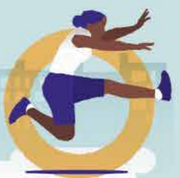
Athlétisme (piste, aire de saut)