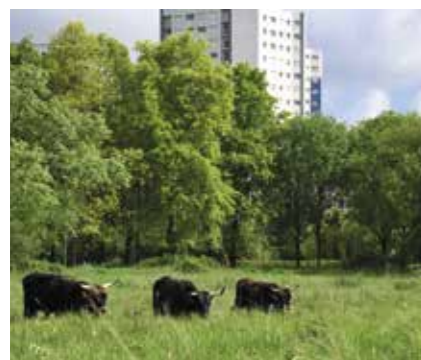
Les aurochs ont élu domicile sur les bords de la Sèvre.

La Maison du développement durable nous invite à le découvrir, pour mieux le protéger.