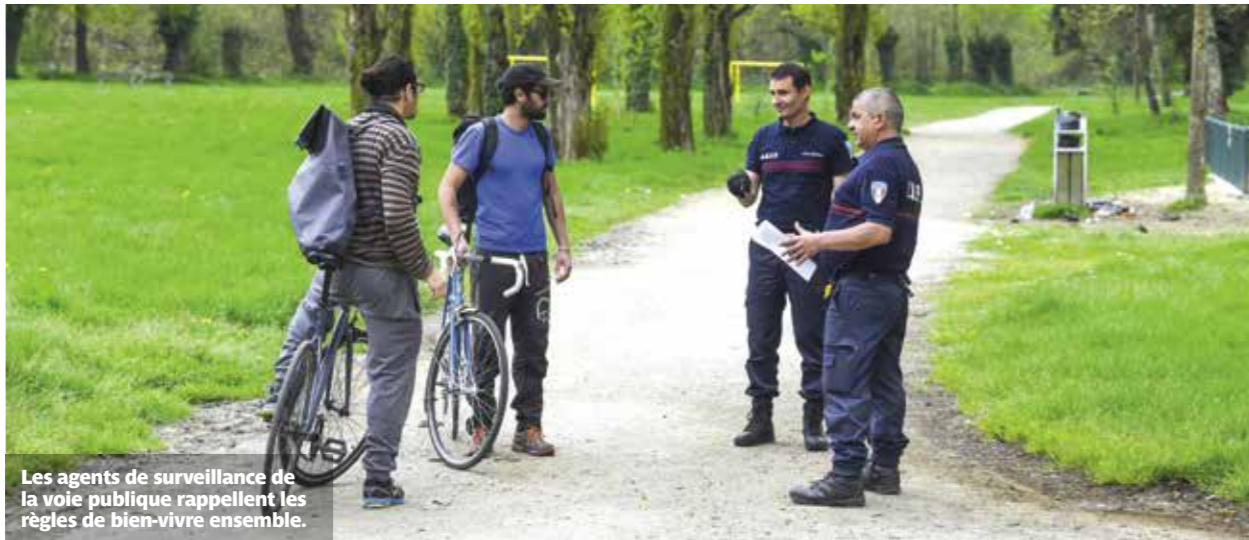
Les agents de surveillance de la voie publique rappellent les règles de bien-vivre ensemble.

Jusqu'au 30 juin, les habitants sont invités à donner leur avis sur leur cadre de vie, s'ils s'y sentent en sécurité. Cette enquête est l'occasion de mettre en lumière les services de la tranquillité publique de la Ville. Des hommes et des femmes qui œuvrent au quotidien, en complément de la police nationale, pour le bien vivre ensemble.