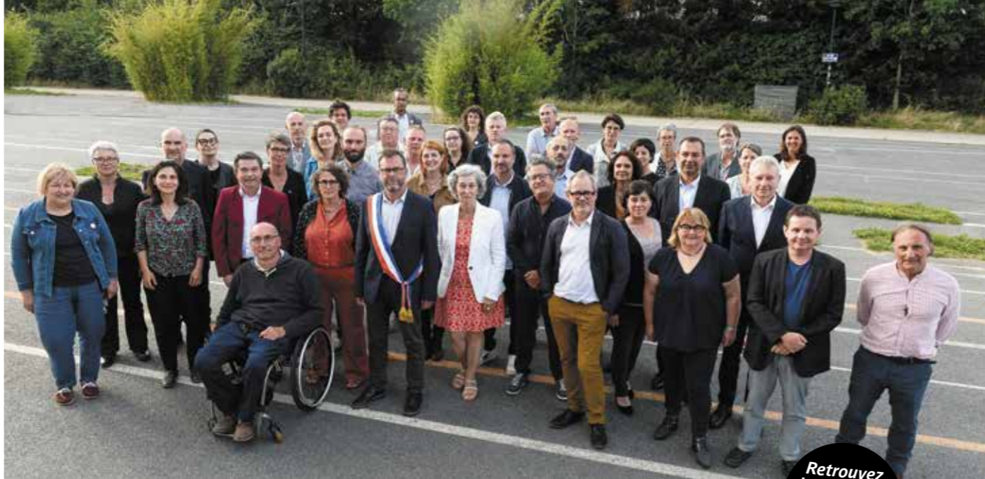
Cette double page est dédiée à l'expression des groupes politiques représentés au conseil municipal.

Retrouvez les tribunes des groupes sur reze.fr