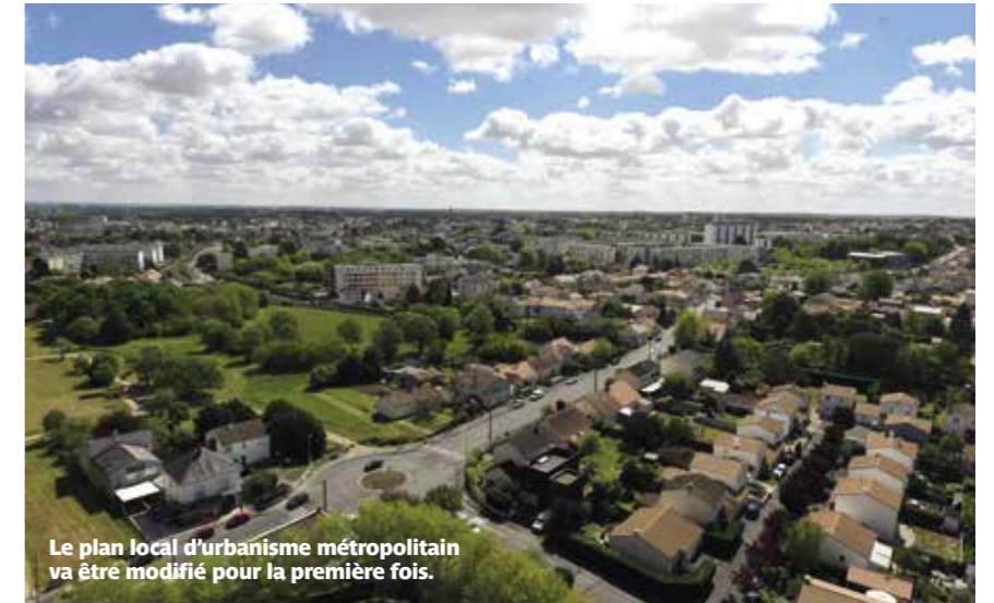
Le plan local d'urbanisme métropolitain va être modifié pour la première fois.

Soucieuse de préserver les poumons verts de son territoire et de conserver des éléments architecturaux emblématiques de l'identité urbaine, la Ville a invité, au mois d'avril, les habitants à recenser les arbres mais aussi le petit patrimoine