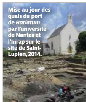
Mise au jour des quais du port de Ratiatum par l'université de Nantes et l'Inrap sur le site de Saint-Lupien, 2014.

Partagez vos astuces autour des loisirs créatifs.