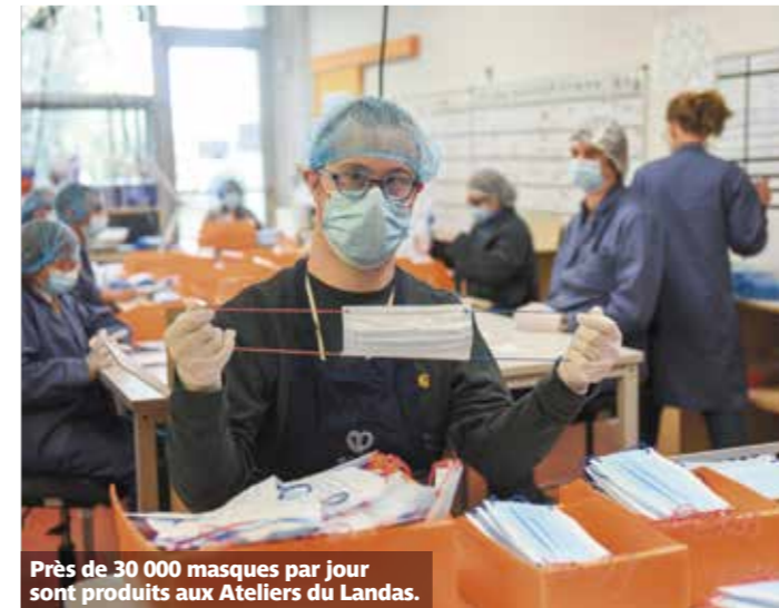
Près de 30 000 masques par jour sont produits aux Ateliers du Landas.