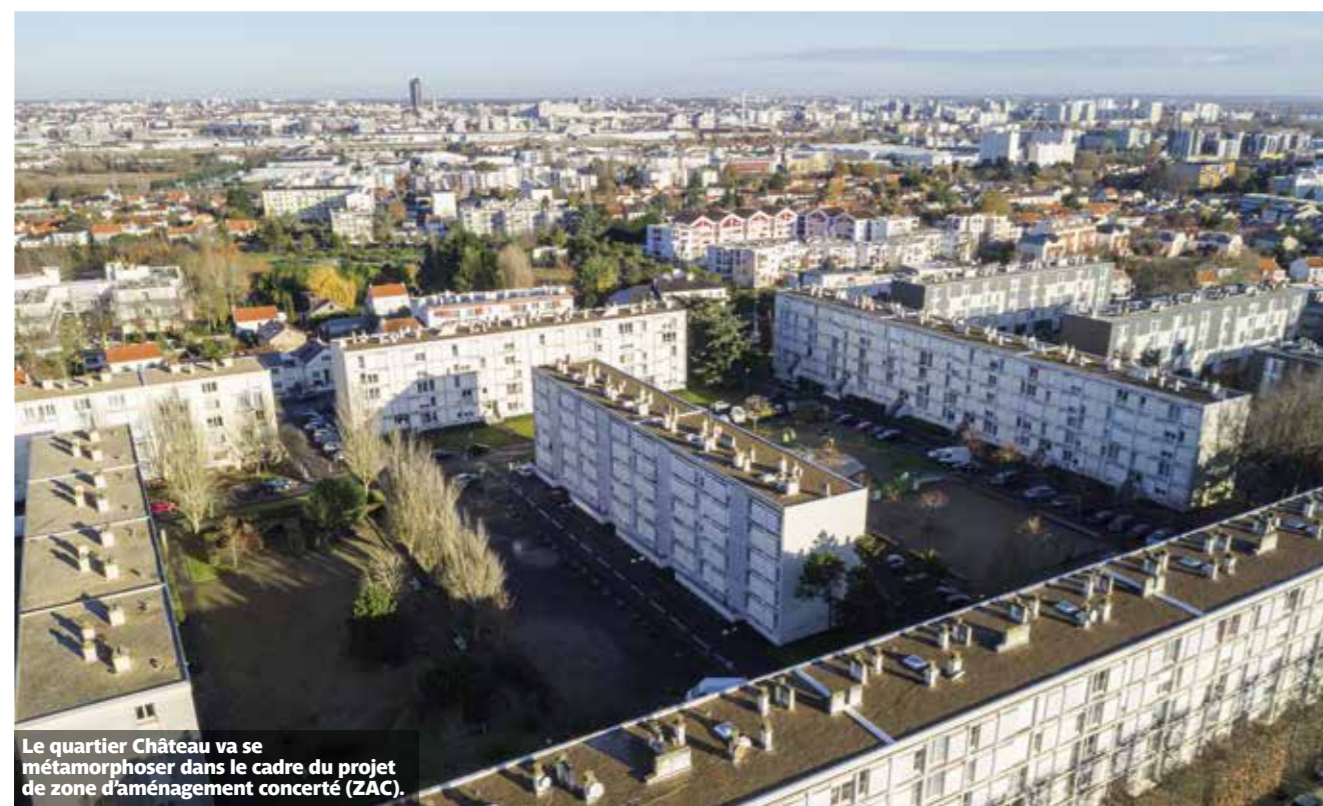
Le quartier Château va se métamorphoser dans le cadre du projet de zone d'aménagement concerté (ZAC).