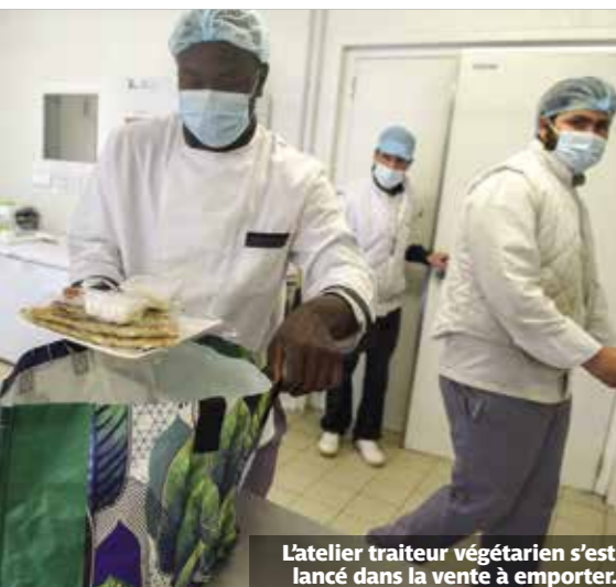
L'atelier traiteur végétarien s'est lancé dans la vente à emporter.

Frappé par la crise sanitaire, Méli Mélo, l'atelier traiteur végétarien de l'association Oser-Forêt Vivante, a renoué avec l'activité grâce à la vente à emporter.