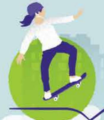
Skatepark (BMX, trottinette, skate, roller)