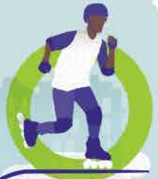
Anneau de roller