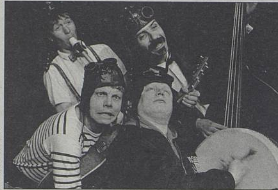
Les Druides Saumonés.