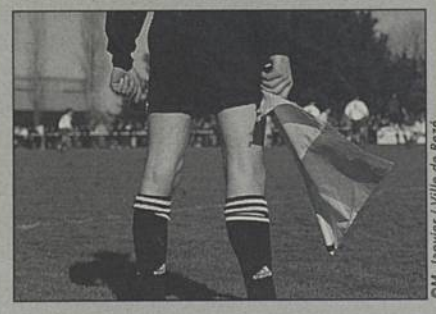
O.M. Janvier / Ville de Rezé