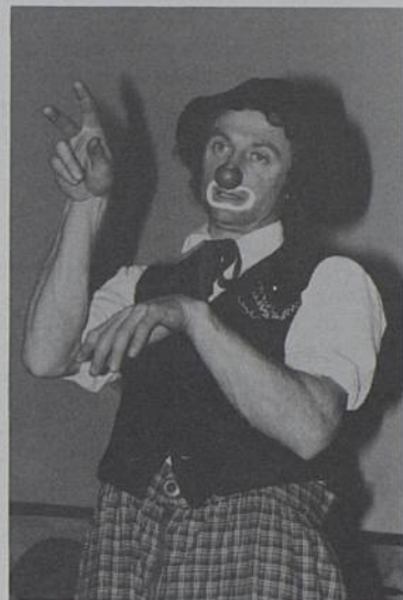
Popol : le clown «cousu main».

Renseignements et réservations : M.J.C. au 40 75 57 28.