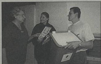
La distribution des nouveaux bacs et du guide de collecte sélective a été effectuée rue par rue, domicile par domicile.

Plus facile d'usage, les bacs jaunes collectés une fois par semaine devraient augmenter de façon significative les quantités recyclées. Depuis les mesures d'extension du tri sélectif en 1996, près de 3 000 tonnes ont été collectées, soit une économie d'environ 600 000 F sur les coûts de traitement.