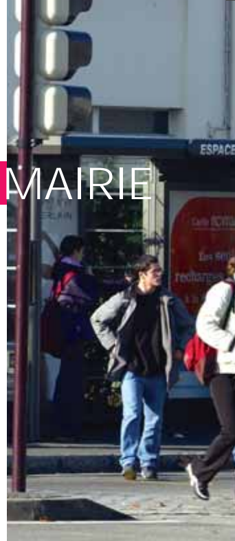
Les membres du CESC en visite à la Houssais.

développement durable, se devait de montrer l'exemple, étant le premier employeur de la commune. Elle propose désormais des alternatives pour réduire la pollution atmosphérique due à la circulation automobile et