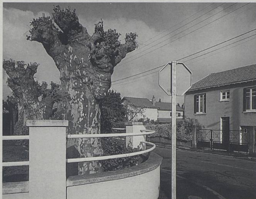
Avenue des Platanes, les arbres (sur des jardins privés) rappellent l'ancienne allée du château de la Houssais, aujourd'hui disparu.

La galerie Diderot héberge actuellement une exposition qui présente Rezé sous un jour original. On y voit, non pas les bâtiments prestigieux, mais la ville de tous les jours, celle que l'on parcourt pour faire ses courses, pour aller au travail ou pour jouer au foot.