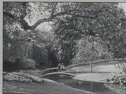
L'embellissement de la ville par le service des espaces verts

Une juste récompense a estimé le jury, qui a retenu dans sa sélection, les ronds-points fleuris, l'ensemble des plantations et SIFU le long de la ligne de tramway (4578 arbustes, 360 arbres, 3375 bruyères, 595 rosiers, 5150 bambous, etc.) et la création du parc des Mahaudières avec 9000 arbustes, 2000 rosiers et 600 arbres (dont 70 variétés différentes de magnolias) sur 3 ha, la réalisation des squares de la Fraternité et de la rue de Guérande.