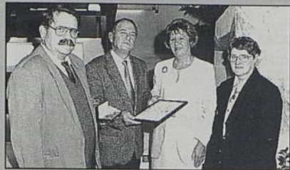
Remise du 1er prix départemental des villes fleuries aux élus rezéens

L'automne est la saison des fruits et on récolte avec plaisir les distinctions.