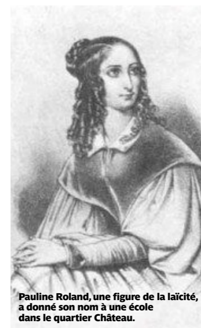
Pauline Roland, une figure de la laïcité, a donné son nom à une école dans le quartier Château.

Pour découvrir la laïcité autrement, et notamment à travers ses grands promoteurs et défenseurs, la Ville et ses partenaires organisent des balades ludiques autour de cette thématique. La première aura lieu le 10 décembre, pendant la Semaine de la laïcité.