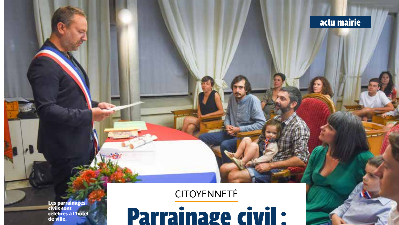
Les parrainages civils sont célébrés à l'hôtel de ville.

INFOS – Mission locale : 8, rue Jean-Baptiste-Vigier, 02 51 70 26 93 ; Service municipal jeunesse et citoyenneté : 19, avenue de la Vendée, 02 40 13 44 25