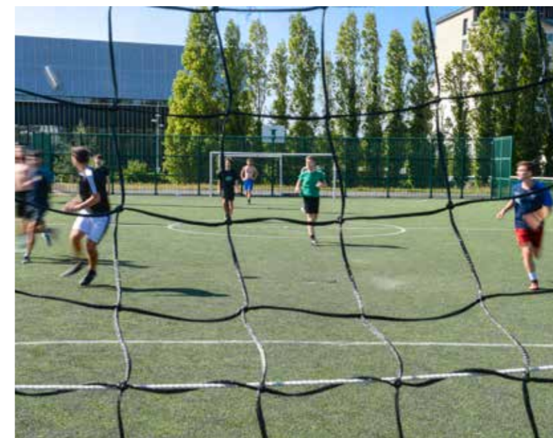
Le terrain de hat trick va être rénové et adapté en terrain de cécifoot.

Le terrain de hat trick va être rénové et transformé pour permettre aux personnes ayant un handicap visuel de pratiquer le football en extérieur.