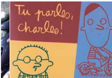
Cuvellier à la Médiathèque