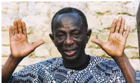
Doudou N'Diaye Rose

Vendredi 25, 20h30, la Barakason, de 6 à 10 €.