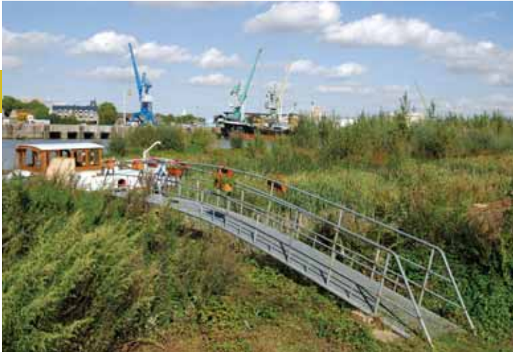
L'aménagement des bords de Loire respecte le caractère végétal des berges.