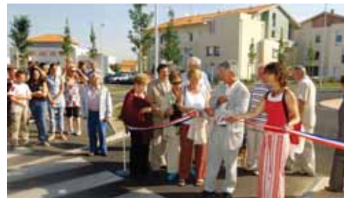
L'avenue Marie-Claude-Vaillant-Couturier, inaugurée en mai 2005 à Rezé.

29 rues en grand chantier (rénovation, bandes ou pistes cyclables, éclairage, eau et assainissement...).