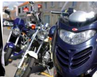
Exposition sur La Brosse