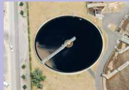
L'un des bassins de la station d'épuration de la Petite Californie.

Sur le bilan d'activités de Nantes Métropole et les projets d'amélioration du traitement des eaux usées (travaux de la station d'épuration de la Petite Californie) et d'une promenade le long de l'Illette. Lundi 28 à 20h30, Hôtel de ville, salle Moyano Delgado.