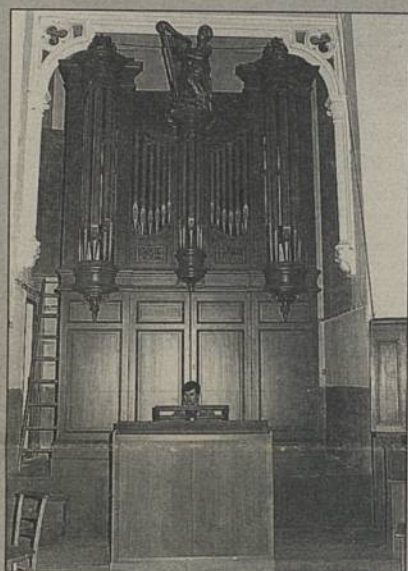
Restauration de l'orgue de Saint Paul

L'association des Amis de l'orgue Saint-Paul lance une grande souscription pour financer la part qui lui revient dans la rénovation de l'instrument. Souscription très originale : pour 300 F, votre nom ou celui d'un être cher sera gravé sur un tuyau qui chantera ainsi pour vous... pendant des siècles.