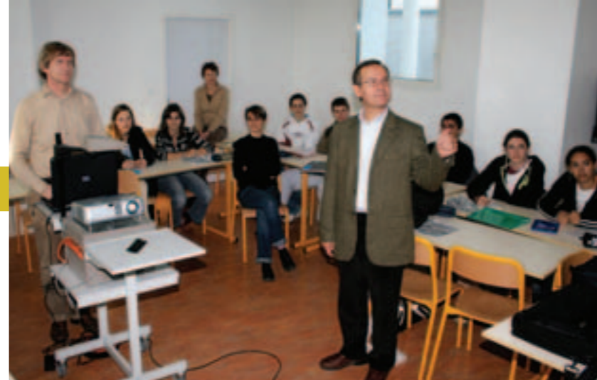
Les élèves de 3 e et leurs professeurs accueillent deux DRH.