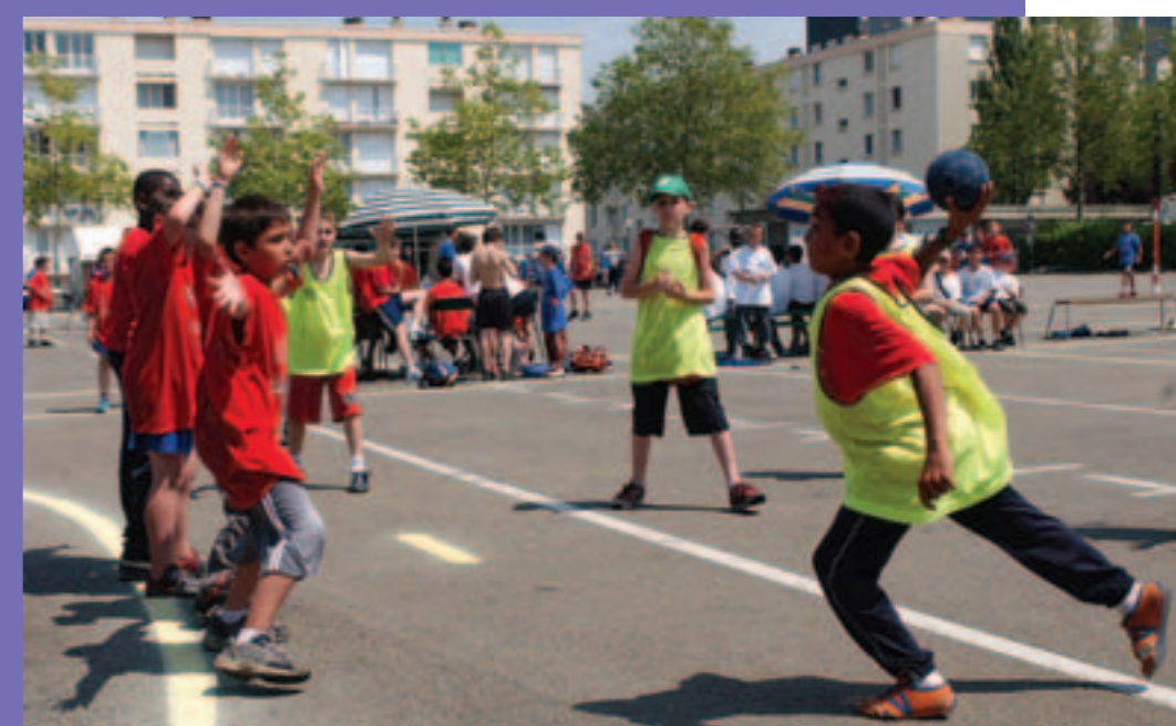
Le tournoi Handball'toi dans le quartier Château.

Parallèlement, nous organisons des mini-tournois et un tournoi festif subventionné par la Ville : Handball'toi (place du Pays de Retz), qui permet aux joueurs sans licence de découvrir le hand."