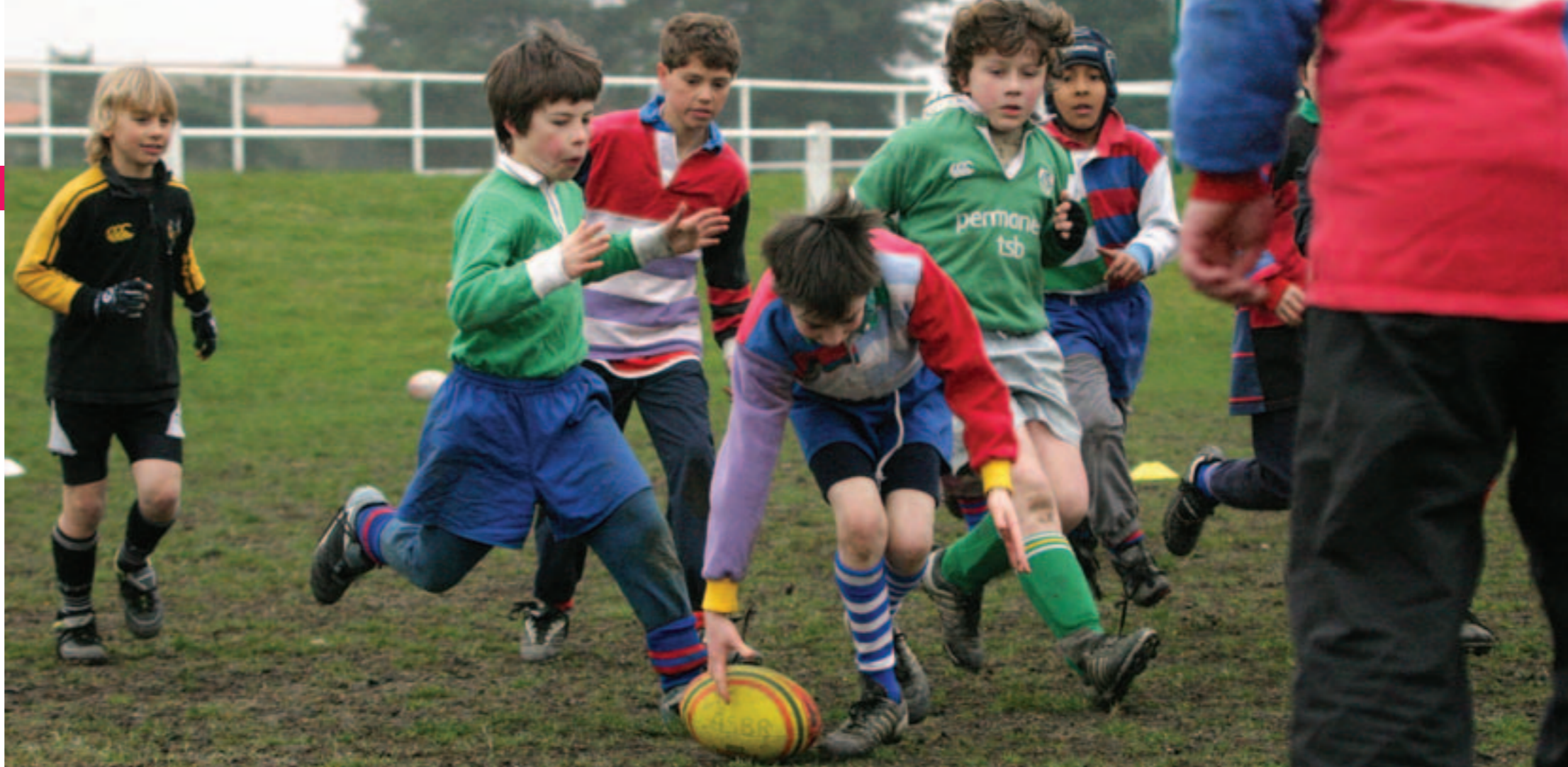
Développer la technicité des jeunes sportifs mais aussi les valeurs de fair-play.

Formation des entraîneurs, compétences des dirigeants... La Ville soutient les clubs qui améliorent leur encadrement.