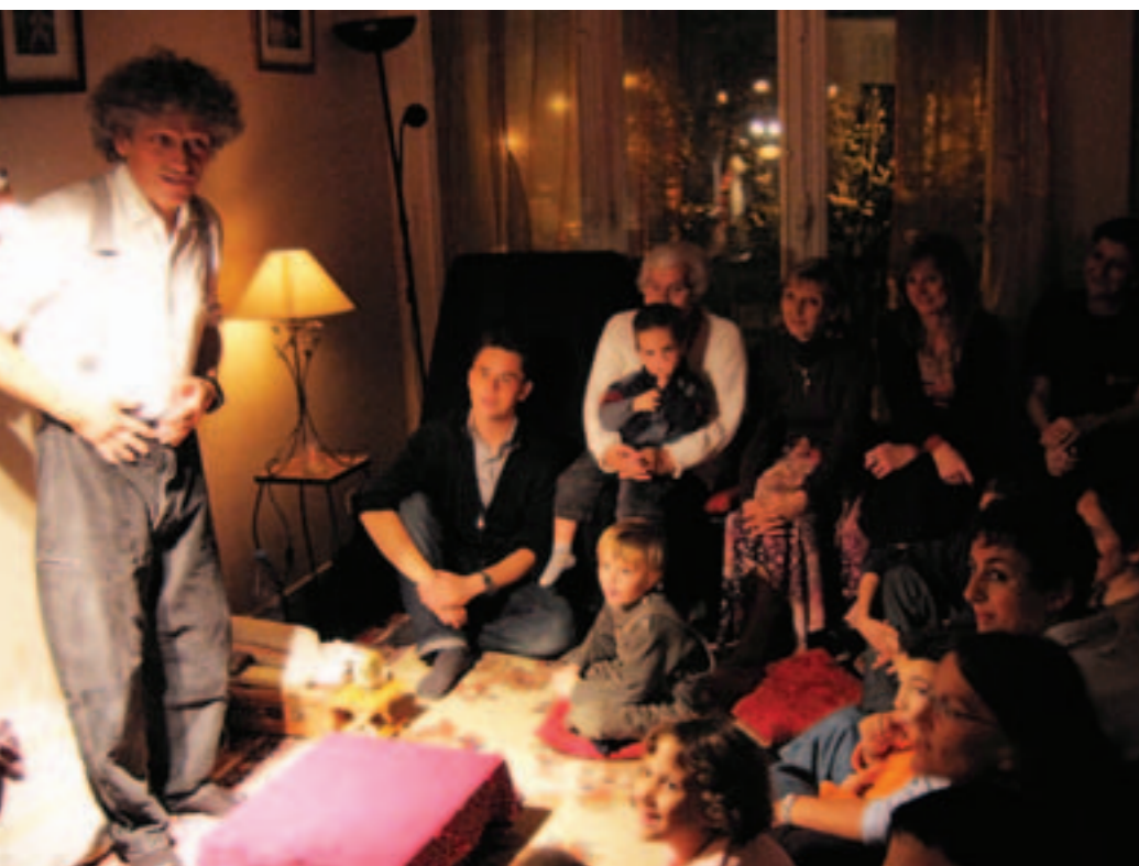
Soirée contes dans le salon d'une famille du Château. En janvier, le conteur sera à Ragon ; en février à la Blordière.

L'Arc et les centres socioculturels proposent un parcours de contes à domicile dans trois quartiers de Rezé.