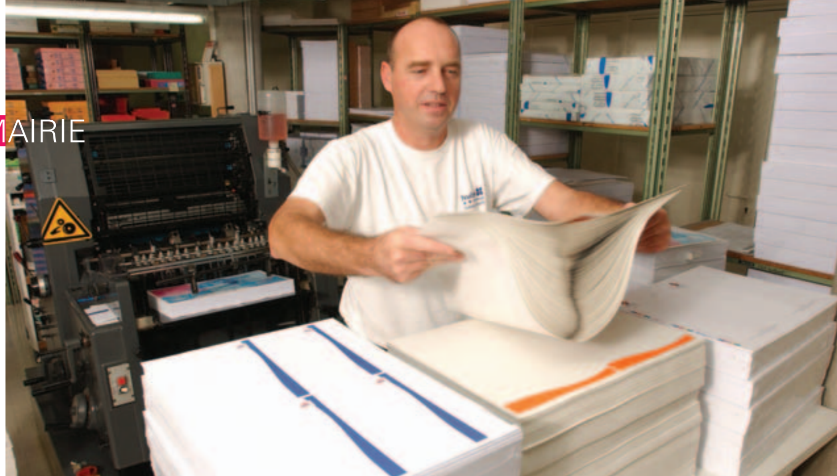
L'imprimerie municipale va accroître la part de papier recyclé.

Très présent dans l'administration, le papier est un enjeu. La Ville privilégie les éco-gestes : recyclage et réduction des produits chimiques.