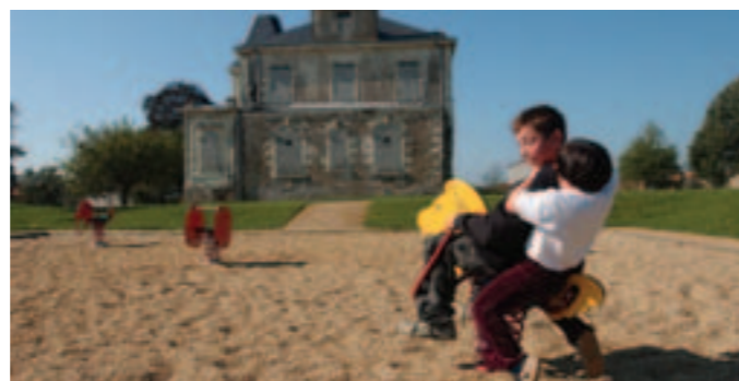
Une aire de jeux dans le bowling.

A utour du logis de Praud, l'espace naturel a reconquis sa noblesse végétale lors d'une première phase de travaux qui s'est achevée en 2006. Les promeneurs peuvent désormais emprunter des cheminements très structurés bordés d'essences horticoles. A proximité du manoir, un bowling (parterre de gazon décaissé) a été aménagé avec l'une des deux aires de jeux pour enfants du parc. Hêtres, chênes, séquoias, ifs communs ont rejoint les beaux sujets du lieu dont un tilleul remarquable. Coût de l'aménagement : 180 000 €. Cette année, la seconde tranche des travaux se déroulera sur la partie sud du parc : valorisation du bassin, aménagement d'un mail depuis les jardins de Praud jusqu'au manoir, grosse structure de jeux complémentaire.