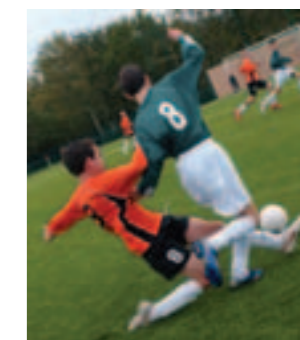
Tournoi de football

Le 14 janvier, organisé par l'amicale des Donneurs de sang. De 14h à 19h30 (ouverture des portes à 11h), Halle de la Trocardière. Rens. 02 40 75 86 97