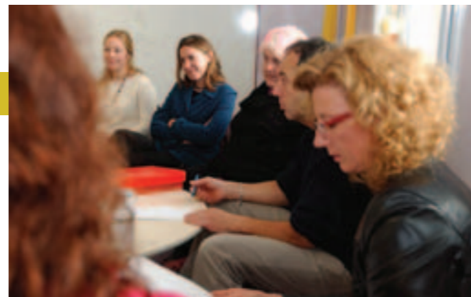
À Parents'T, les parents peuvent s'entraider.