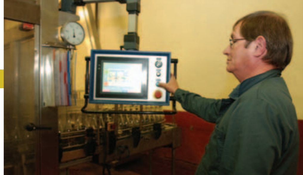
Le métier de négociant en vins-embouteilleur expliqué aux élèves.

Une deuxième phase est en cours (fin des travaux fin 2007) : il s'agit d'améliorer l'écoulement et la qualité de l'eau, notamment en protégeant les berges et la végétation. Quant aux piétons, ils pourront longer l'Ilette grâce à un futur sentier, reliant la Sèvre à la route des Sorinières. L'aménagement devrait s'achever à l'horizon 2009. Coût de l'opération : 842 000 € HT, financés par Nantes Métropole et l'Agence de l'eau.