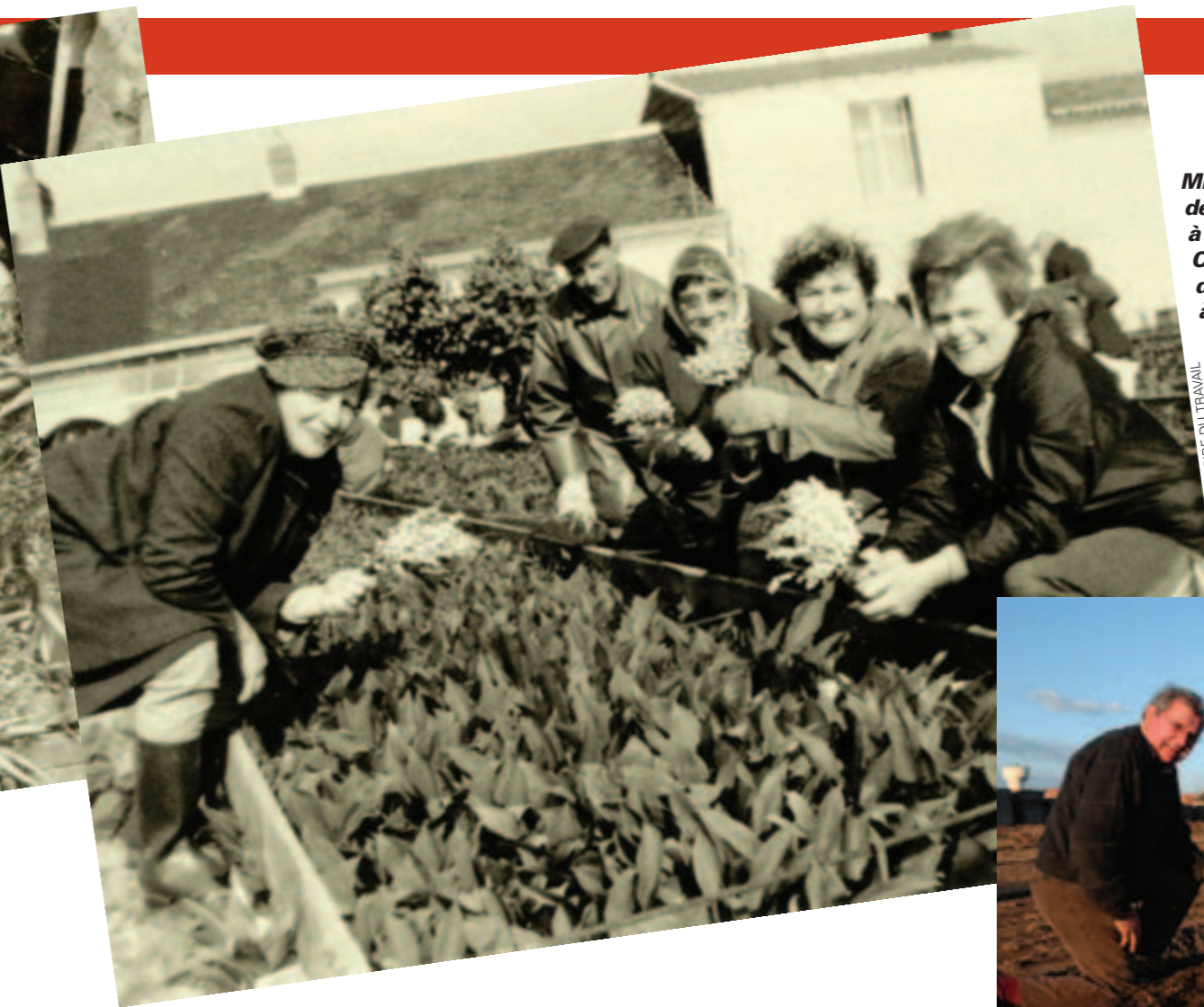
Mise en botte de carottes à la Blordière. Cueillette de muguet à la Morinière.