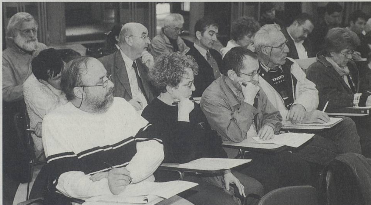
Le CESC est composé d'une soixantaine de membres.

En 1993, la Ville de Rezé a été l'une des premières communes de l'Hexagone à se doter d'un Conseil économique et social communal (CESC). A l'occasion du 10 e anniversaire de cette instance consultative, une conférence-débat est organisée le mardi 23 septembre à 20h30, à l'Hôtel de Ville, salle Moyano.