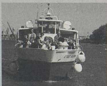
Des navettes fluviales relieront les deux rives de la Loire

A Rezé, comme l'an dernier, les quais de Trentemoult seront fermés à la circulation automobile toute la journée. Concrètement, pour les véhicules à moteur, y compris les