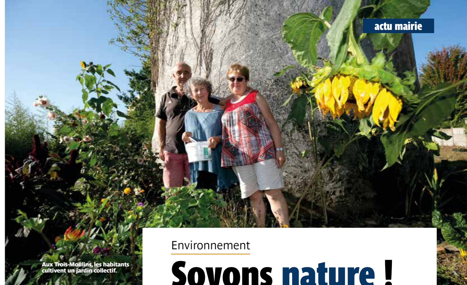
Aux Trois-Moulins, les habitants cultivent un jardin collectif.