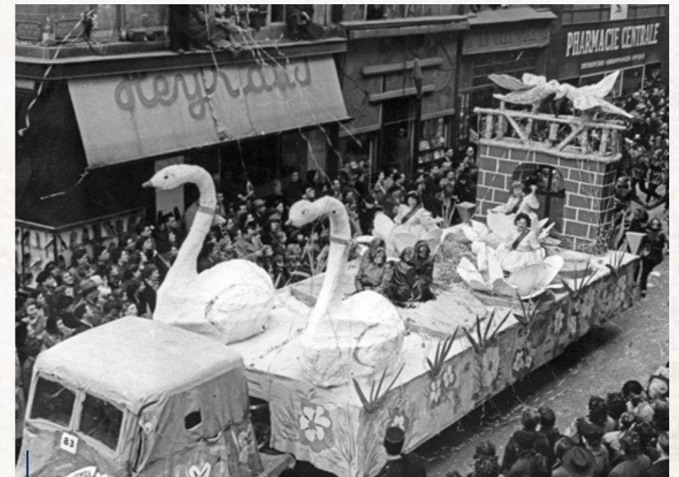
1953, le char des Reinettes dans les rues de Nantes. André Soulas construit les plus grands chars du carnaval de Nantes.