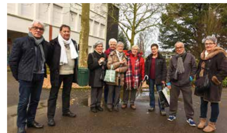
Quelles actions pour améliorer le cadre de vie au Château ? Les habitants proposent. La Ville, Nantes Métropole, les bailleurs agissent.