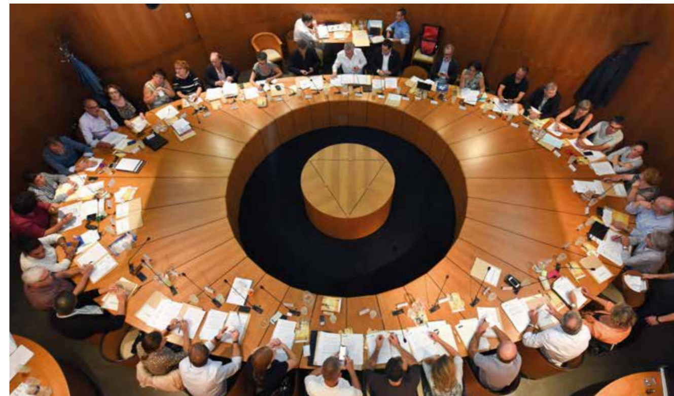
Groupe de la minorité

elusecologistesreze@gmail.com / elusecologistesreze.fr