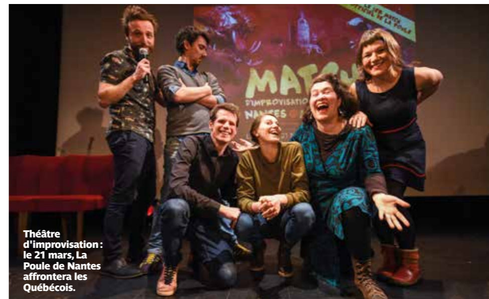
Théâtre d'improvisation : le 21 mars, La Poule de Nantes affrontera les Québécois.

L'association Catégorie libre organise un match de théâtre d'impro qui verra s'affronter la célèbre ligue québécoise à La Poule, nouvelle troupe nantaise.