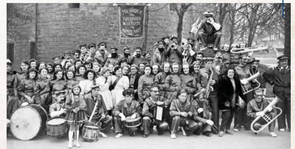
1953, Les équipages de la flotte de Trentemoult devant le château des Ducs.

1952 La reine des neiges passe la Loire pour saluer les Nantais.