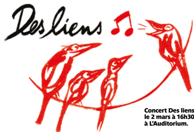
Concert Des liens, le 2 mars à 16h30 à L'Auditorium.