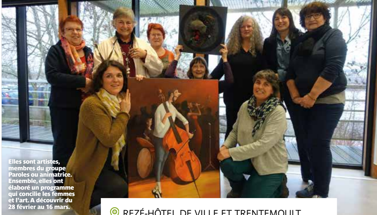
Elles sont artistes, membres du groupe Paroles ou animatrice. Ensemble, elles ont élaboré un programme qui concilie les femmes et l'art. A découvrir du 28 février au 16 mars.