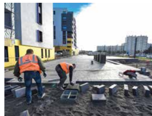
Une grande place sans voiture est en cours d'aménagement rue Rosa-Parks.

En septembre dernier, la Ville a cédé à Nantes Métropole une parcelle de près de 2 900 m 2 dans la nouvelle rue Rosa-Parks afin de réaliser une esplanade le long de la ligne de tram, entre l'avenue de la Libération et la gare Pont-Rousseau. Un nouvel espace réservé aux piétons et aux cyclistes, adapté aux personnes à mobilité réduite. L'accès aux voitures sera exclusivement pour les secours, les livraisons et les déménagements. Des arbres seront plantés pour créer une promenade, agrémentée de bancs et de pontons. Les travaux, démarrés en octobre, s'achèveront au printemps. Un autre chantier s'ouvrira avant l'été juste à côté : l'aménagement de l'avenue de la Libération.