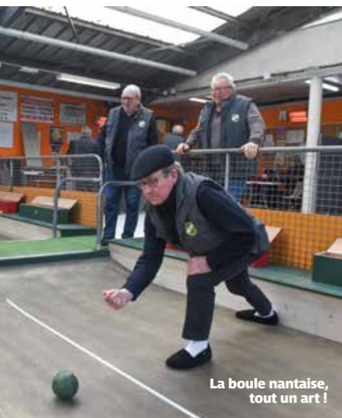
La boule nantaise, tout un art !

Les trois pistes utilisées par la Ragonnaise ont été refaites. Le sable a été remplacé par une résine, un revêtement plus roulant.