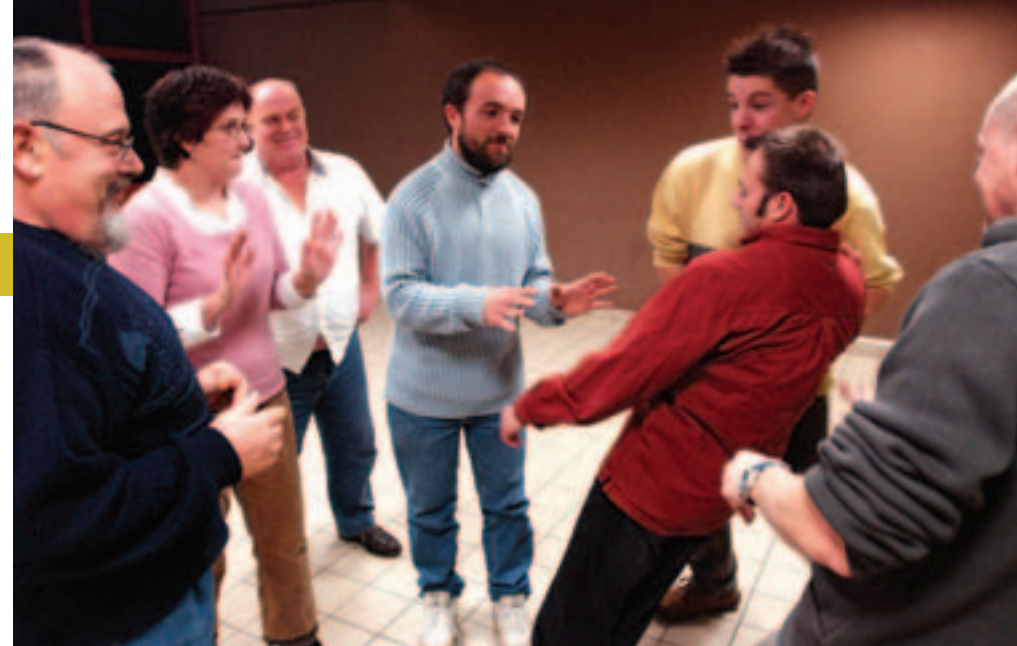
Une nouvelle compagnie de théâtre à Rezé.