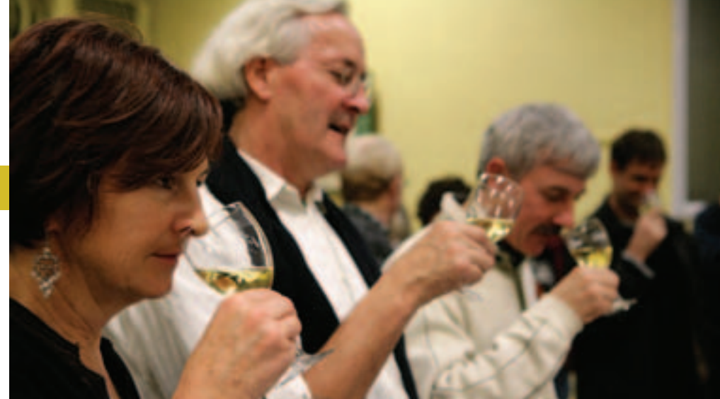
A la santé des vendredis animés !