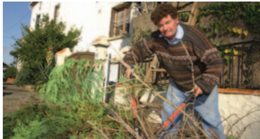
Brûlage des végétaux du 1 er octobre au 30 avril.

■ Le service municipal de prévention de la santé assure un accueil, une écoute et une orientation pour toute personne en situation difficile (santé, contraception, drogues, alcool, victimes de violence...). Permanence le lundi de 14h à 17h et sur rendez-vous au 02 40 75 32 88 29 avec les infirmières du service municipal. Anonyme et gratuit.