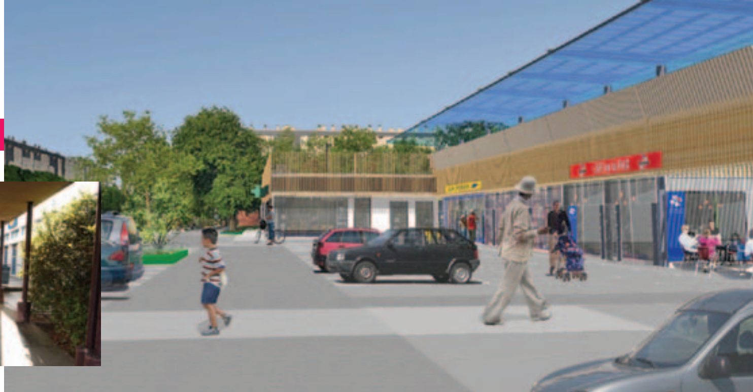
L'aspect du centre commercial, une fois rénové.