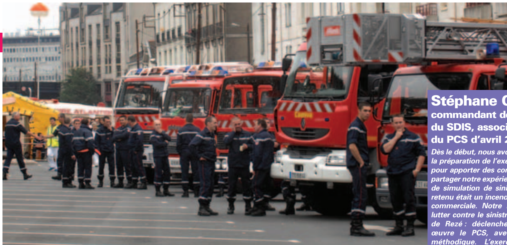
En cas d'accident grave, une bonne coordination entre les secours et la Ville est nécessaire.