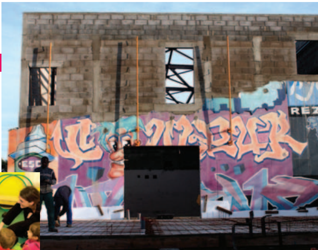
Le programme des investissements sera poursuivi : la Barakason (photo), l'église Saint-Pierre, la construction du stand de tir, l'extension de l'école Jean-Jaurès,...