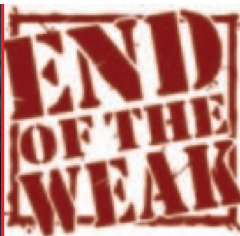
End of the weak

Valses tristes, clins d'œil jazz, java, rock ou musette, mots burinés composent son