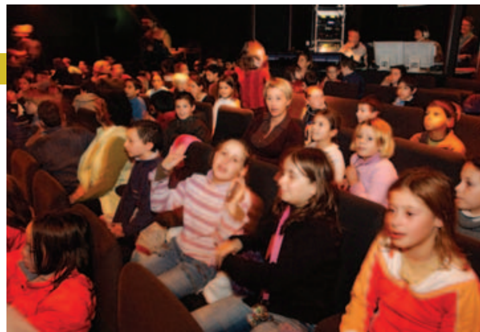
L'école municipale de musique et de danse invite 193 enfants à découvrir le monde du spectacle vivant.