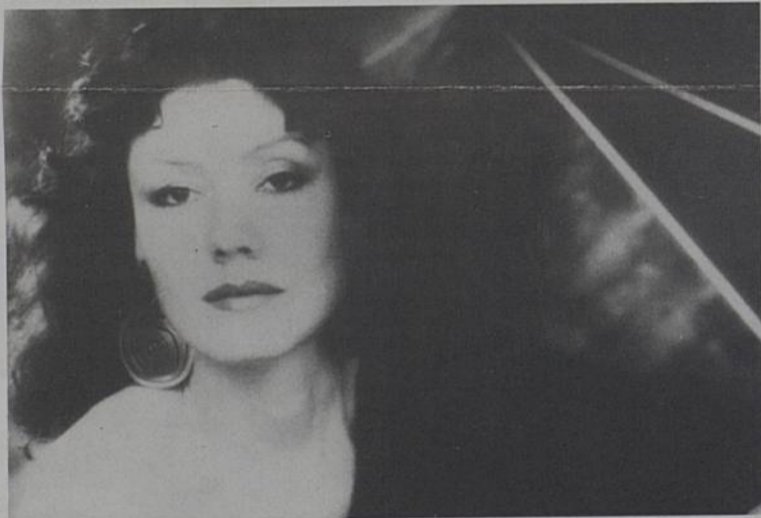
« La Républicaine » Théâtre de Rezé les 21 et 22 octobre.

RENSEIGNEMENTS : abonnements et réservations pour tous les spectacles : ARC, 43 rue de la Commune - 40 05 05 00 du mardi au samedi de 11 h à 13 h et de 14 h à 19 h.