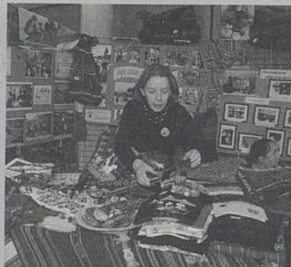
Pour vos cadeaux de Noël, pour aider Amnesty, venez nombreux à l'expo-vente des 30 novembre et 1 er décembre.

Comme chaque année, Amnesty International et des artisans s'engagent : samedi 30 novembre de 14h à 19h et dimanche 1 er décembre de 10h à 19h, à l'Hôtel de Ville (salle Moyano Delgado, 1 er étage), 30 artisans exposeront et vendront leurs créations. Chaque visiteur y trouvera des idées de cadeaux originales.