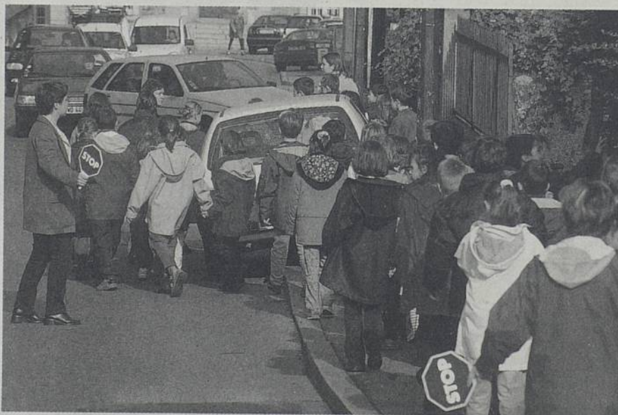
Une voiture garée sur un trottoir et c'est la circulation des piétons qui est mise en danger.

« Laissez les trottoirs aux piétons ! » Tel est le mot d'ordre que la Ville souhaite faire entendre. A partir de mi-novembre, elle va engager une sensibilisation de la population au stationnement gênant. Des interventions seront faites auprès des riverains qui garent leurs véhicules sur les trottoirs, contrevenant ainsi au code de la route (article 417 et suivants).