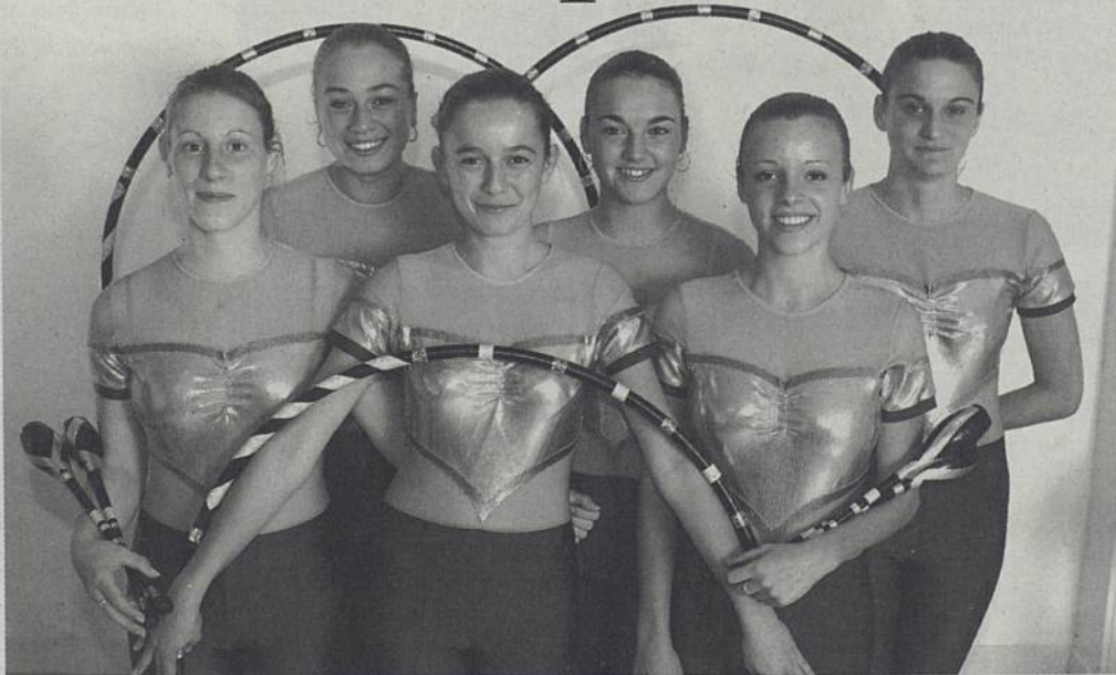
Parmi ceux qui seront récompensés le 5 décembre : le groupe de Gymnastique Rythmique et Sportive (GRS).

Tous les deux ans, la Ville et l'Office municipal du sport (OMS) organisent Les Trophées du sport. Objectif : récompenser les sportifs et les bénévoles des associations rezéennes qui se sont mis en valeur par leurs résultats ou par leur œuvre en faveur de leur association. Vendredi 5 décembre, rendez-vous est pris à 20h au théâtre municipal, rue Guy Lelan, pour une soirée qui promet d'être conviviale et dynamique.