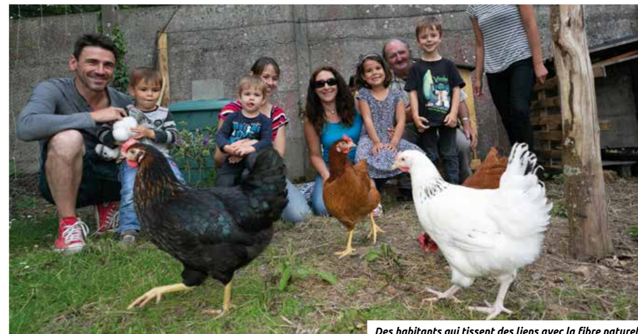
Des habitants qui tissent des liens avec la fibre naturelle.

reze.fr : tout a changé sauf l'adresse La Ville a lancé une nouvelle version de son site web en avril. Plus pratique, plus lisible, plus participatif, le nouveau site a été testé en avant-première par des Rezéens.