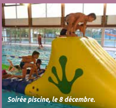
Soirée piscine, le 8 décembre.

Structure gonflable, course, circuit aquatique (corde immergée, équilibre, rapidité...). ... Le 8 décembre, les maîtres-nageurs vous préparent un parcours du combattant. Avec en prime : un cours d'aquaboxing en fin de soirée. Un défi à relever en famille ou entre amis.