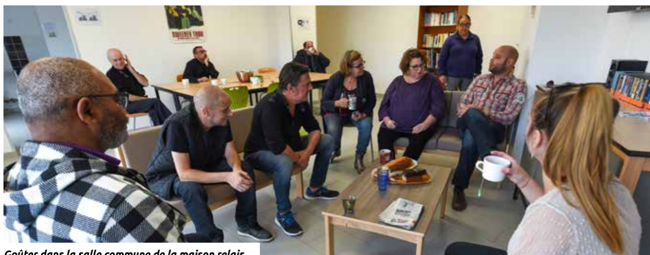
Goûter dans la salle commune de la maison relais.