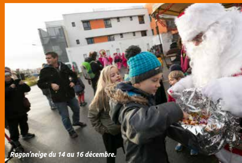
Ragon'neige du 14 au 16 décembre.

Retrouvez toutes les informations sur les animations organisées à Rezé pendant les fêtes de fin d'année en pages 4 et 5.