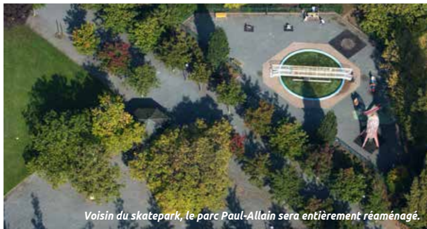
Voisin du skatepark, le parc Paul-Allain sera entièrement réaménagé.