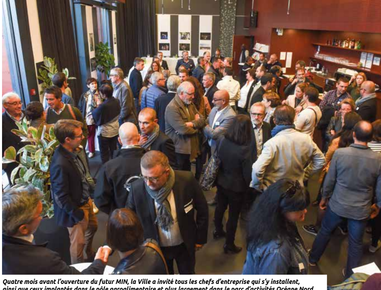
Quatre mois avant l'ouverture du futur MIN, la Ville a invité tous les chefs d'entreprise qui s'y installent, ainsi que ceux implantés dans le pôle agroalimentaire et plus largement dans le parc d'activités Océane Nord.