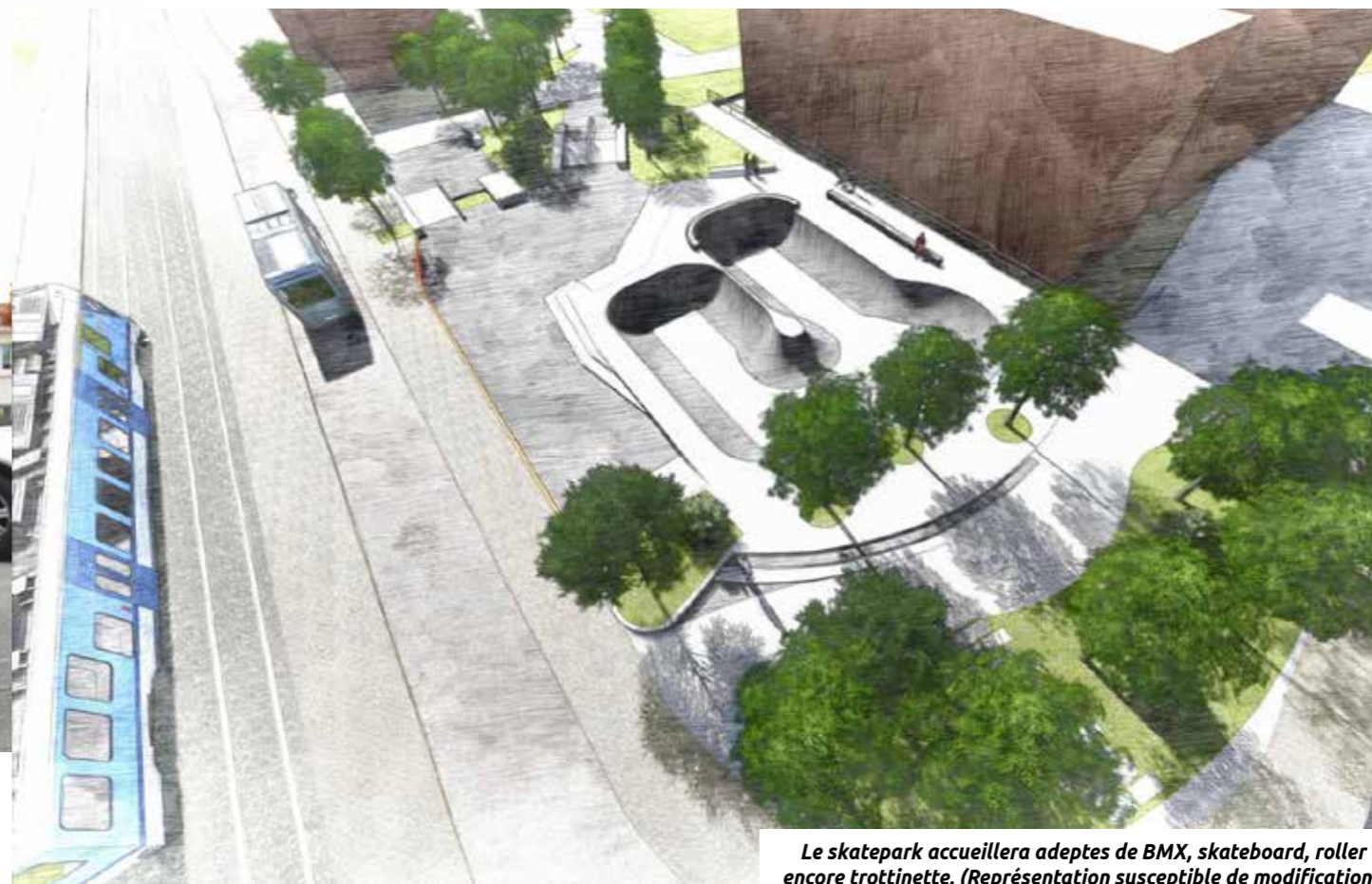
Le skatepark accueillera adeptes de BMX, skateboard, roller ou encore trottinette. (Représentation susceptible de modifications.)