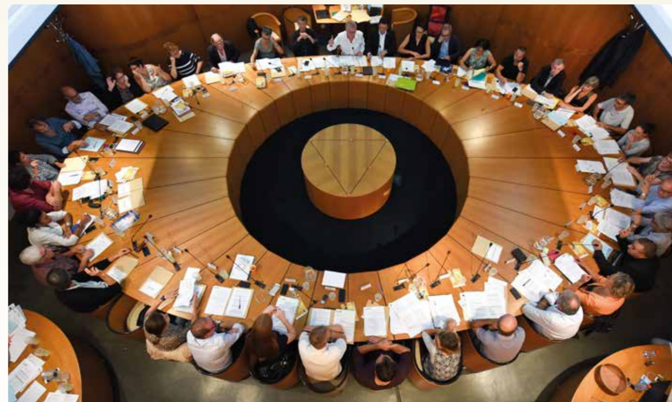
Groupe de la minorité