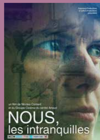
Ciné-débat, le 14 décembre.

Vendredi 14 décembre à 20h30. Cinéma Saint-Paul, 38, rue Julien-Douillard. Tarif : 4€. Rens. 02 40 75 41 91.