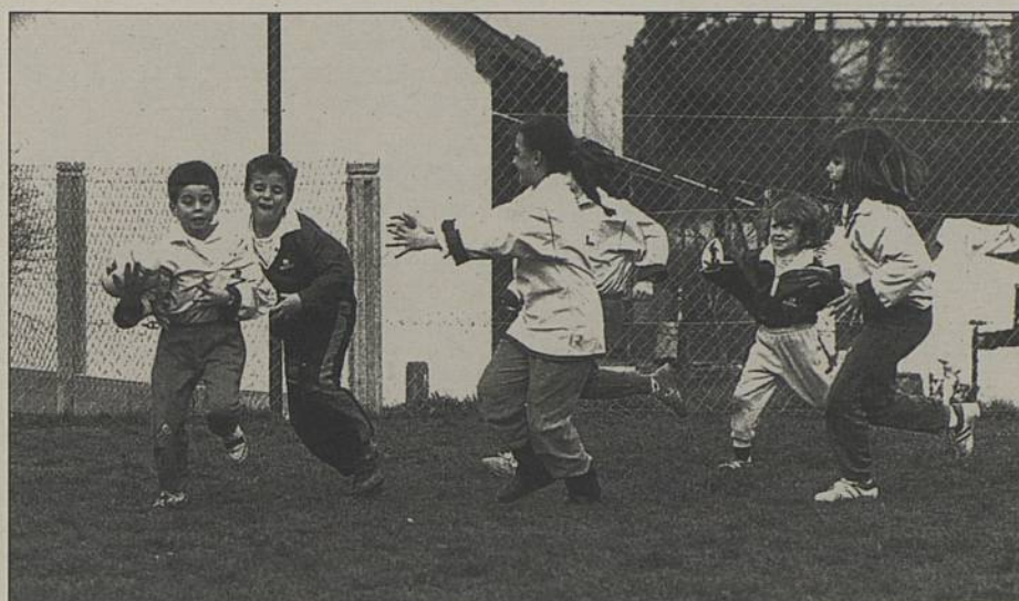
Initiation à l'école du Port au Blé (archives)

Depuis trois ans, l'ASBR mène dans certaines écoles une initiation au rugby. Cet apprentissage se fait sous l'égide de l'USEP et avec la participation des instituteurs. L'inspection académique et la Fédération Française de Rugby soutiennent également l'opération. La première année, 90 enfants suivaient l'expérience, cette année, ils seront 448 !