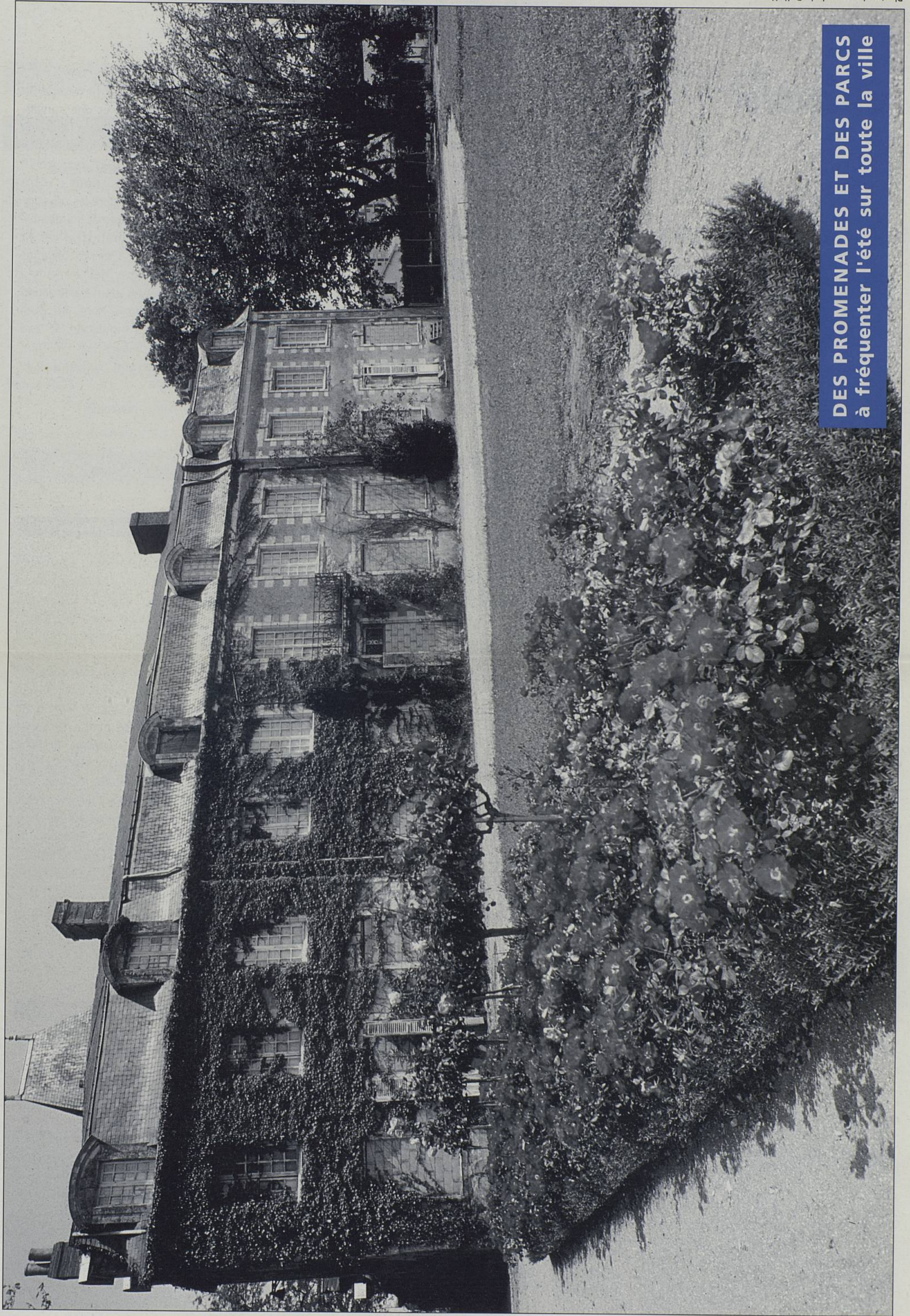
Photo : Le parc de la Ballinière