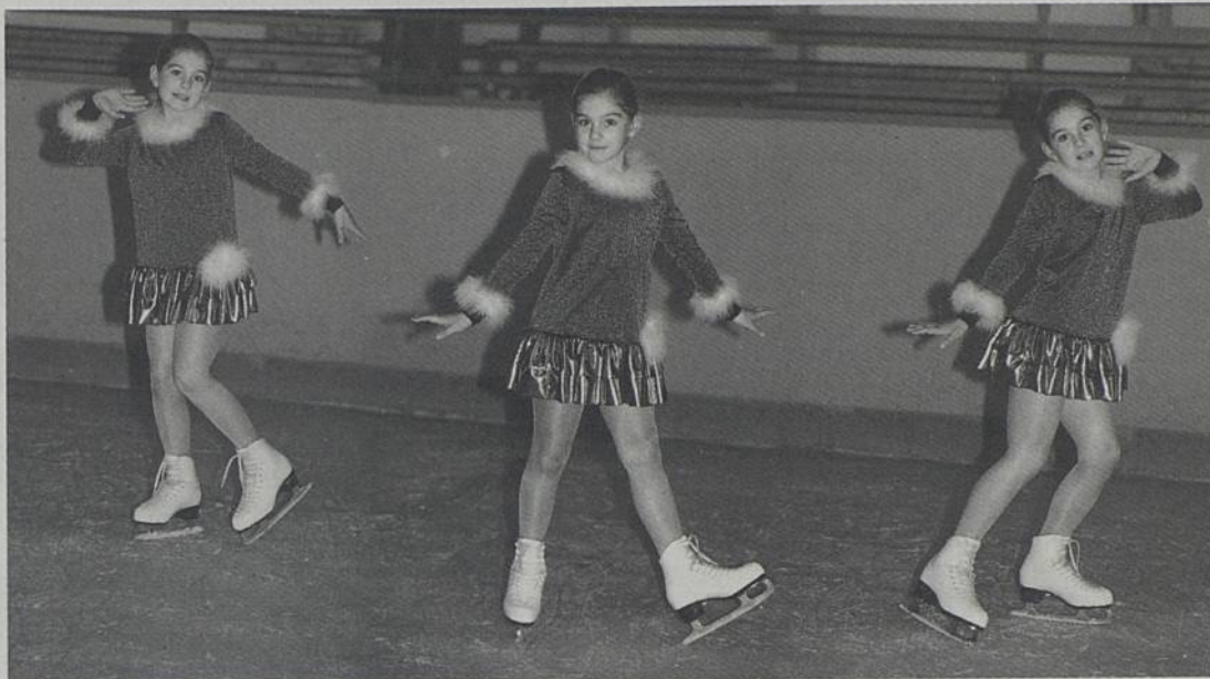
Un gala de danse sur glace aura lieu le 19 à la patinoire de la Trocardière.

● Danse sur glace - Pour ses 30 ans, le club de danse sur glace (CPGLO) propose un gala de fin d'année le 19 à 20h à la patinoire de la Trocardière. Adulte : 7,62 € (50 F) ; enfants de 8 à 16 ans : 3,81 € (25 F) ; gratuit pour les moins de 8 ans.