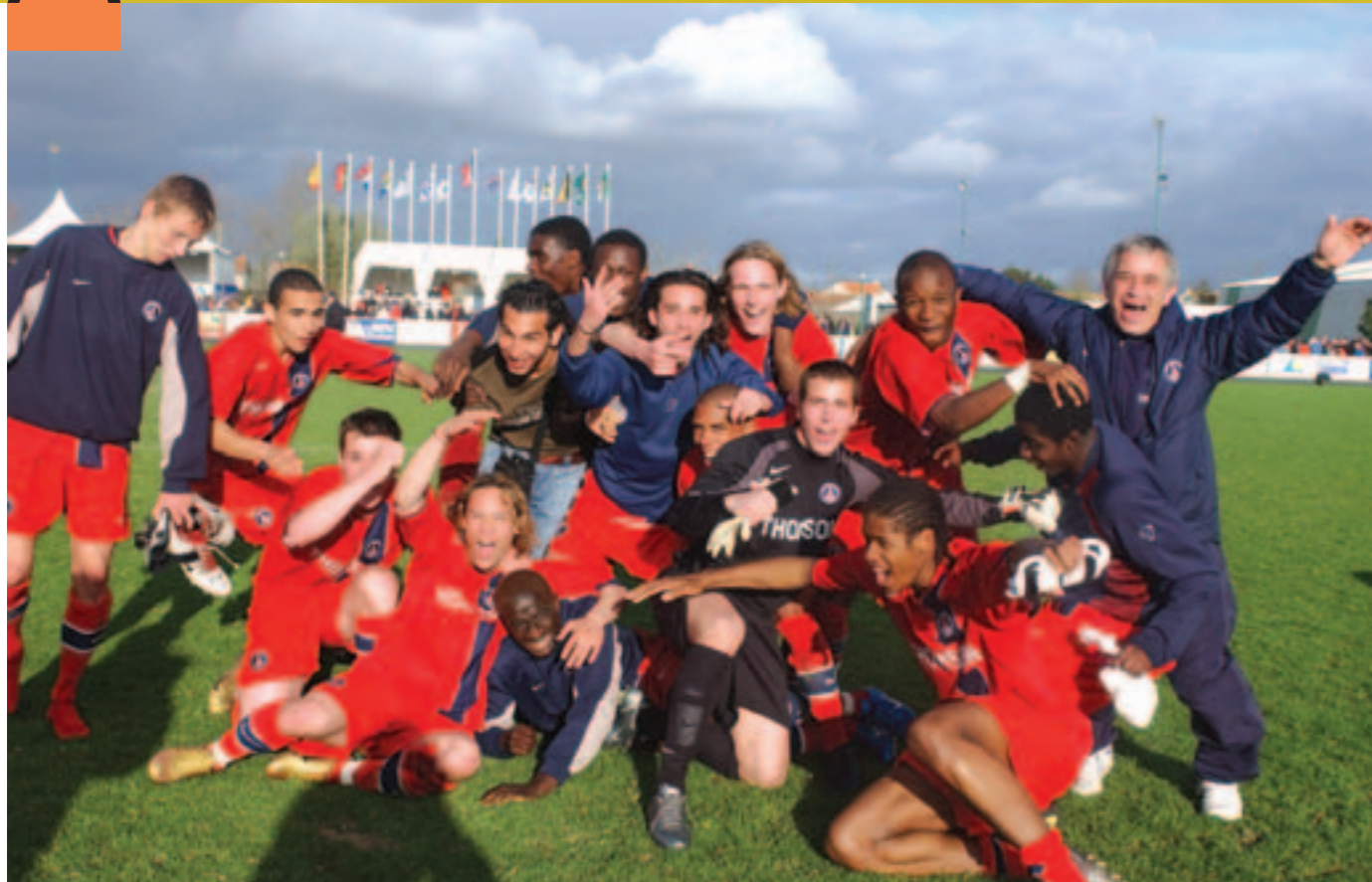
Scène de joie pour le PSG, vainqueur de l'édition 2004.