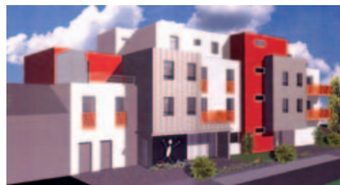
Site de la Carterie : la future crèche occupera une partie du rez-de-chaussée de cet immeuble, l'autre étant pour les anciens.

* Le 4 e Contrat Enfance est un engagement mutuel avec des objectifs définis d'amélioration de l'accueil des jeunes enfants : les efforts de la Ville sont soutenus proportionnellement par la Caf.