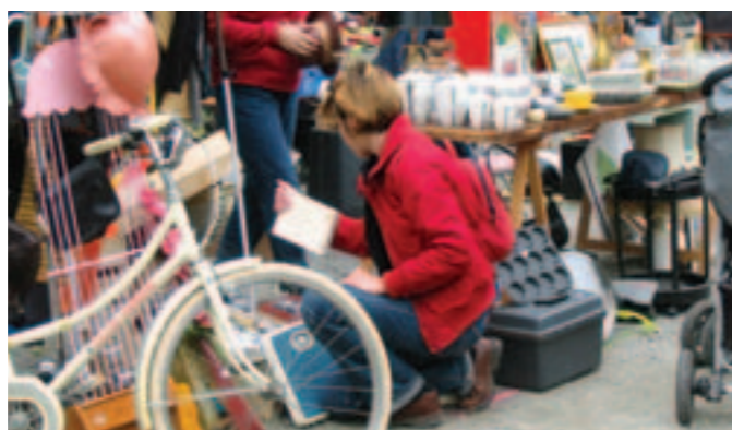
Chiner le 9 avril dans la cour de l'école de Ragon.

Tous les ans en avril, les parents d'élèves de la PEEP et l'équipe enseignante de Ragon organisent un vide-grenier pour participer au financement des sorties des enfants.