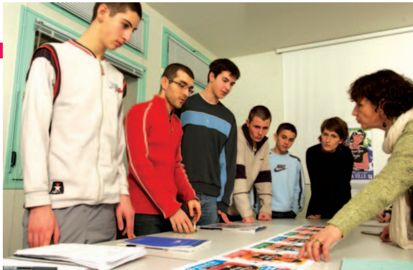
Préparation de la manifestation : les jeunes organisateurs choisissent l'affiche.

A partir de 14h30 à l'hôtel de ville, les jeunes auront la possibilité de participer à deux débats au choix parmi quatre thèmes : "Temps libre : loisirs et/ou culture ?", "Des lieux pour les jeunes ?", "Bouger dans l'agglomération, facile ?", "Trouver sa place dans la société : comprendre, participer, s'engager ?". Les débats se dérouleront en deux parties : débat entre les jeunes, dialogue avec les élus, les services municipaux et les associations. En clôture à la Barakason, les groupes Dahlia et Les spécialistes. Carte blanche à DJ Nark, issu du quartier du château à Rezé et animateur des ateliers hip-hop à Rezé.