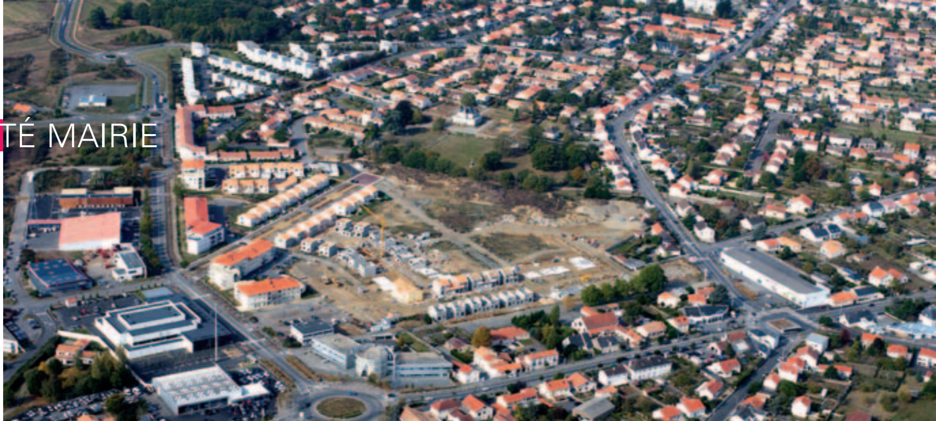
L'urbanisation de la Butte de Praud va de pair avec l'agrandissement et le réaménagement du parc.

Les Rezéens sont invités à donner leur avis sur le zonage et le règlement du Plan local d'urbanisme (PLU). Un document qui va préciser les règles pour aménager, construire, protéger et développer la ville.