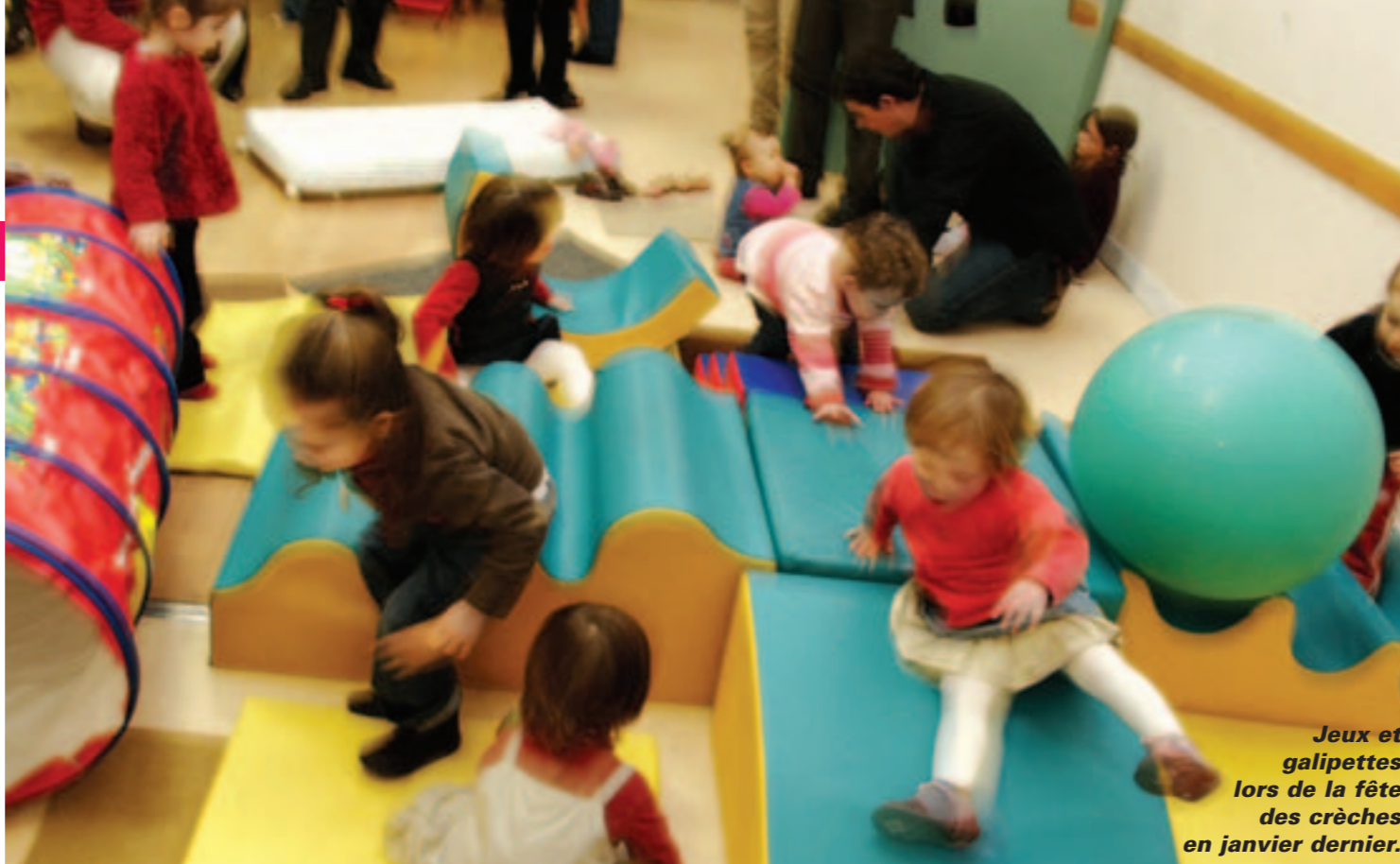
Jeux et galipettes lors de la fête des crèches en janvier dernier.

Pour répondre aux nombreuses demandes, la Ville ouvre une crèche, en construit une autre et s'adapte aux besoins des familles.