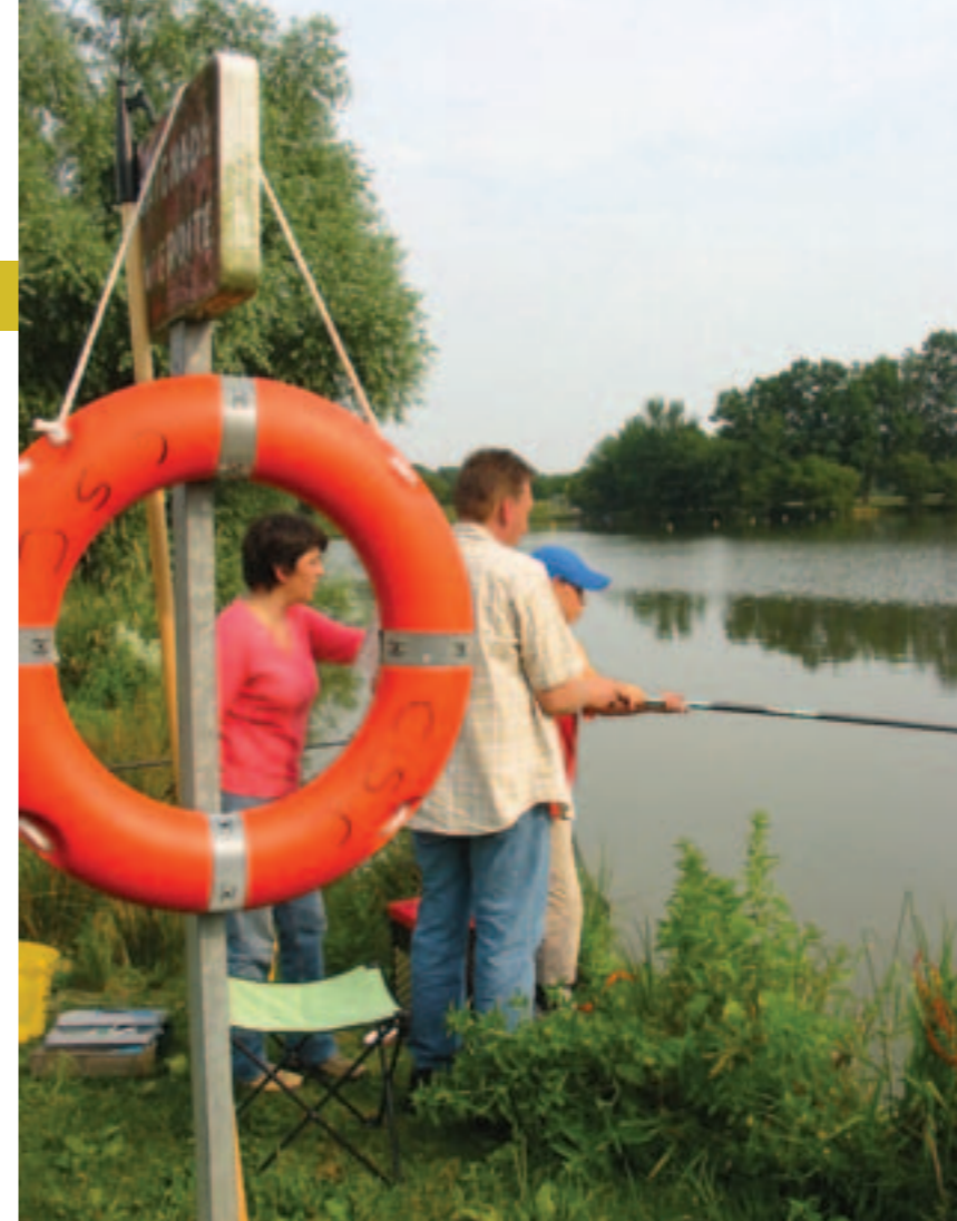
Découverte des techniques de pêche au CSC Jaunais-Blordière.