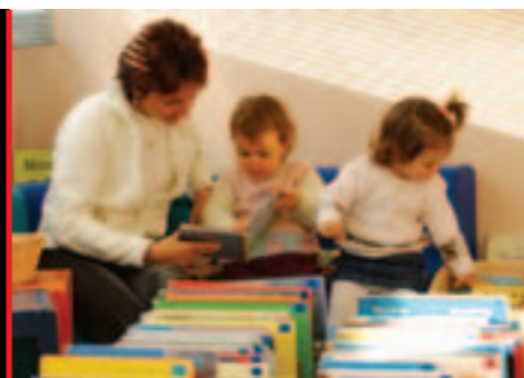
Bébés lecteurs à la bibliothèque.