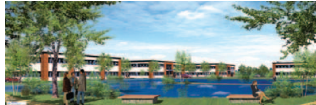
Projet Espaces Océane.

depuis des années. Les jeunes, qui sont en centre de formation, sont heureux de retrouver une ambiance familiale", note le président de l'Entente. Il souhaite "préserver le caractère convivial, même si les meilleurs joueurs", vedettes de demain, suscitent bien des convoitises chez les dirigeants de clubs. Les passionnés du ballon rond se contenteront d'apprécier le spectacle, gratuit, offert par ces jeunes venus du monde entier.