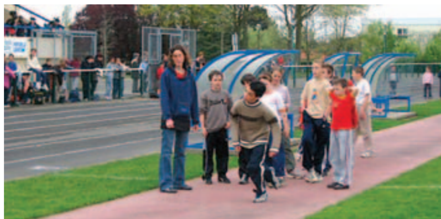
Les CM1 et CM2 sur la ligne de départ du Triath'jeunes.

Course, saut, lancer. Le 19 avril, les élèves de CM1 et CM2 s'élanceront sur la ligne de départ du Triath'jeunes.