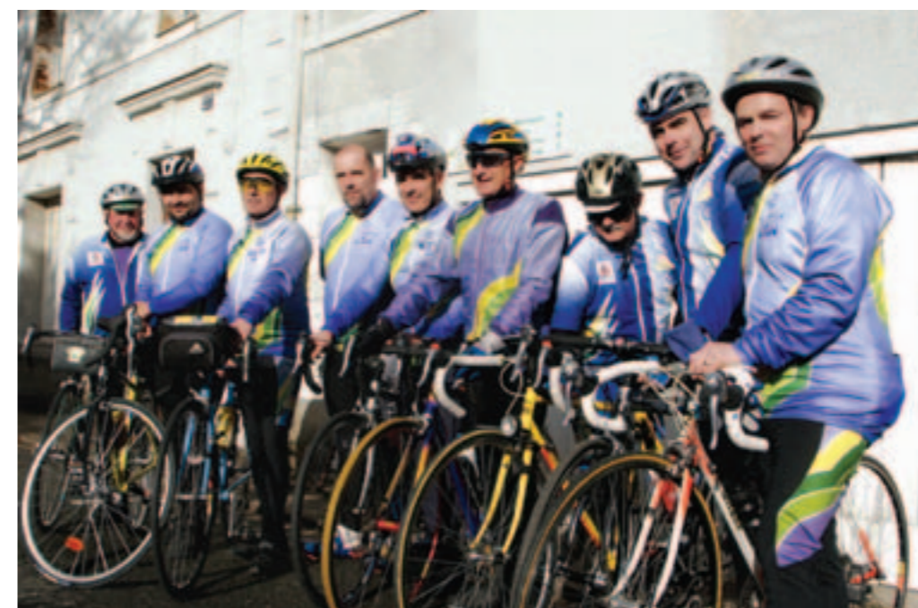
Deux raisons d'arborer le sourire : un nouveau local et une nouvelle randonnée en septembre.

Permanence le jeudi de 17 h à 18 h 30 au local 29, rue Jean-Baptiste-Vigier. Tél. 02 40 05 11 13.