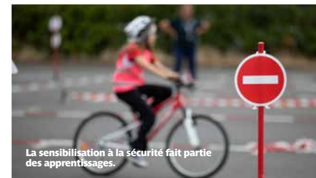
La sensibilisation à la sécurité fait partie des apprentissages.