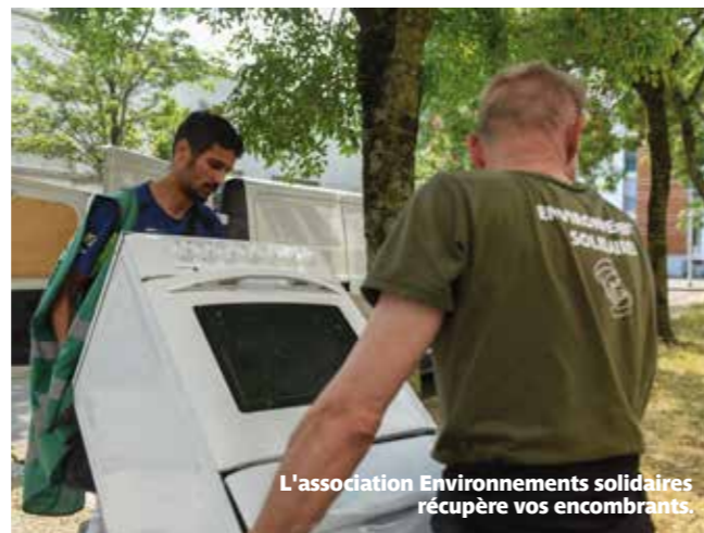
L'association Environnements solidaires récupère vos encombrants.