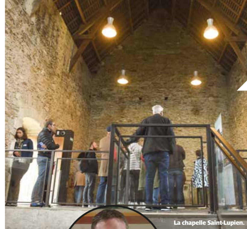
La chapelle Saint-Lupien.