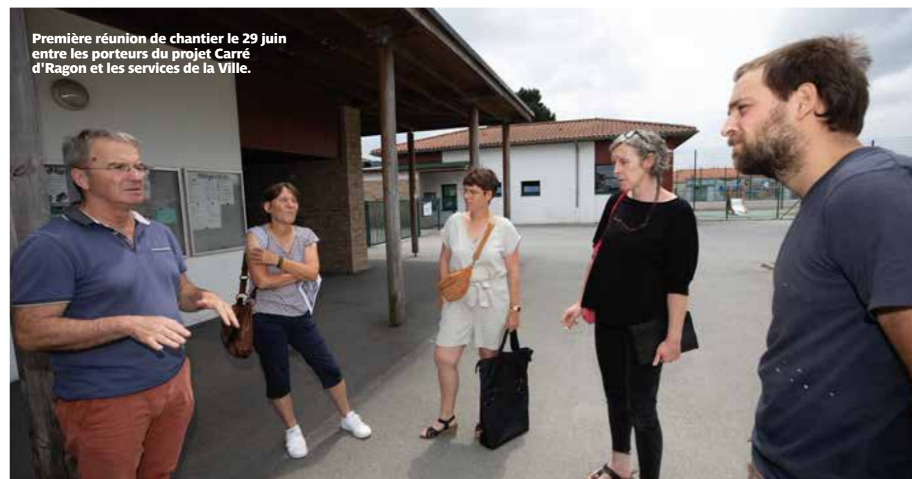
Première réunion de chantier le 29 juin entre les porteurs du projet Carré d'Ragon et les services de la Ville.

Lire en page 6 : Les sept projets lauréats