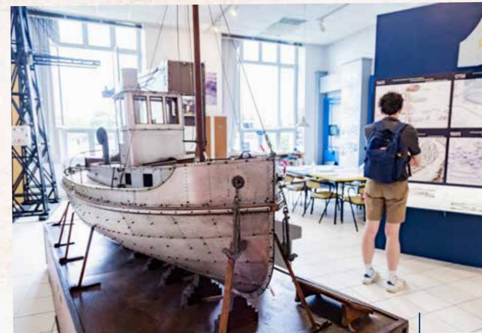
À découvrir, l'exposition permanente "Bâtisseurs de navires".