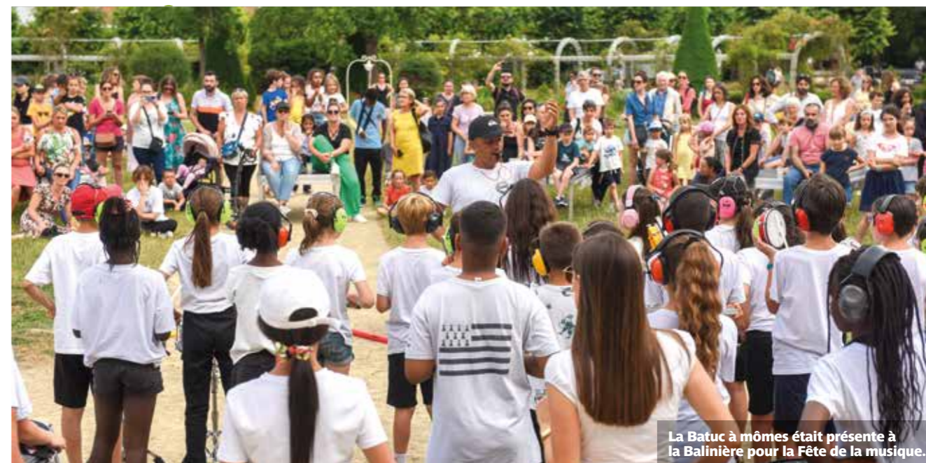
La Batuc à mômes était présente à la Balinière pour la Fête de la musique.