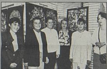
3e prix concours affiche "les déchets" classe de 4e Techno J. Perrin