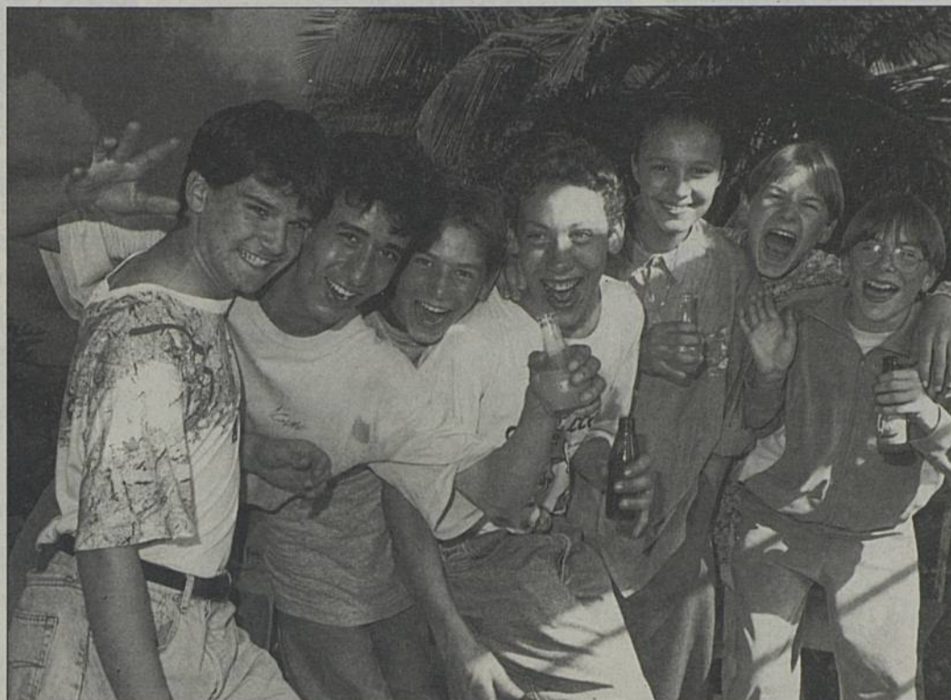
Nouveau club dans les anciens locaux de la bibliothèque, allée du Dauphiné.

T ous les jeunes de 13 à 25 ans, Rezéens ou non, vont pouvoir accéder à différentes activités en bénéficiant d'un tarif préférentiel. La carte «Rezé jeunes tonic» donnera droit à tout un éventail de réductions : mini-camps, sorties, soirées, activités sportives proposées par le service jeunesse ; piscine, patinoire, médiathèque, spectacles de la MIC et de l'ARC, cinéma St-Paul, développement de photo chez Photo Jet, cours de code et de conduite