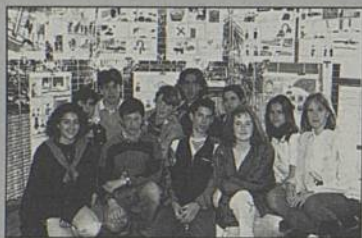
Classe de 4e collège Pont Rousseau : 1er prix concours BD

Deux classes rezéennes se sont distinguées : une classe de 3ème du CES Pont-Rousseau qui a remporté le 1er prix de la catégorie « Bande dessinée » et les élèves de 3ème Techno du lycée Jean Perrin qui ont obtenu le 2ème prix de la catégorie « affiches ». Félicitations aux lauréats et à leurs professeurs.