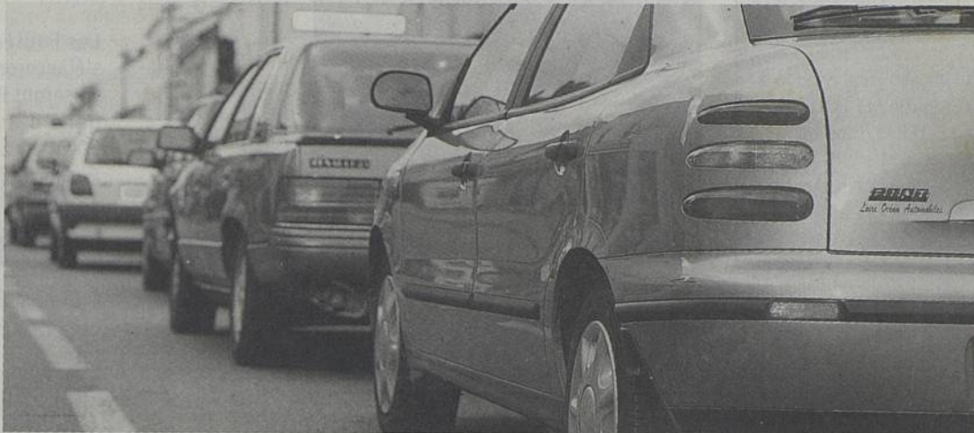
À Trentemoult, rues intérieures et quais seront accessibles aux piétons. À Pont-Rousseau, sont concernés : la place Sémard, la rue F. Faure, (jusqu'à Barbonnerie) et le bas des rues Fraix et Vigier.

Faire ses courses sans le stress des voitures, discuter en pleine rue ou profiter des terrasses, cela sera possible à Rezé, autour de la place Sémard et dans Trentemoult où des navettes assureront des traversées de la Loire toute la journée !