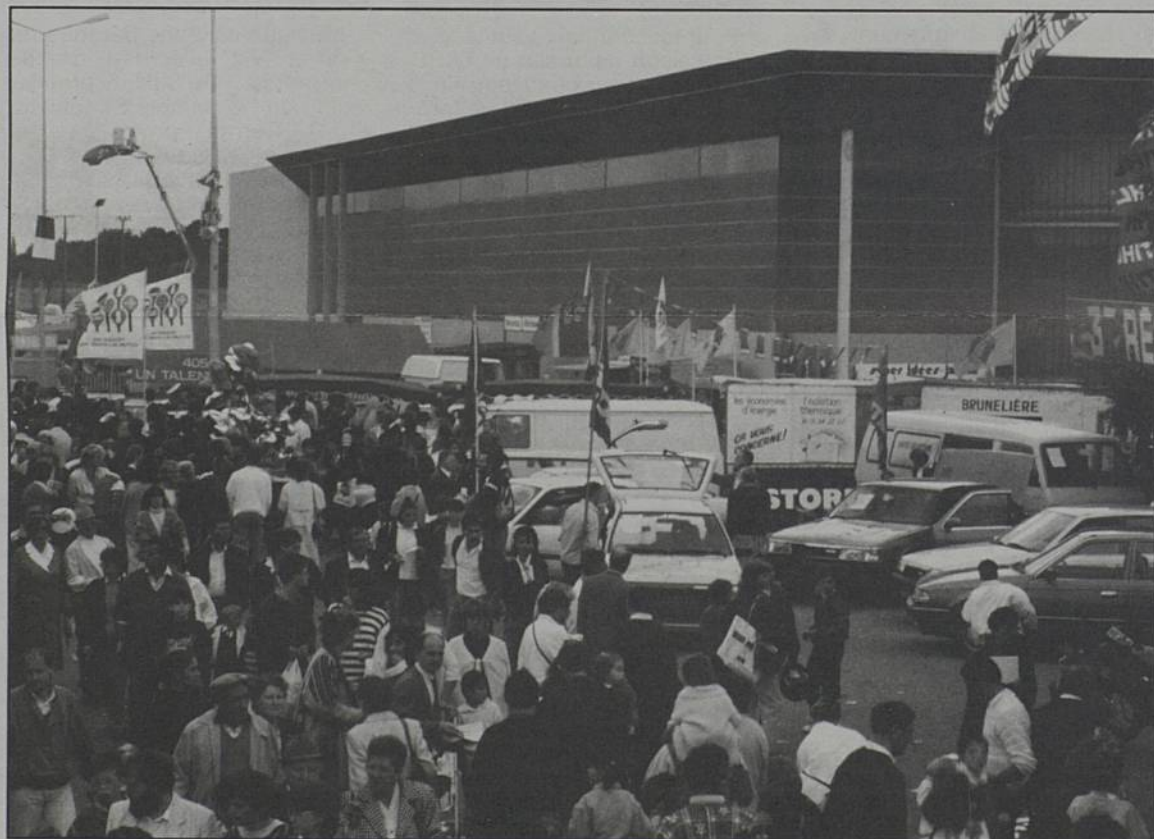
Scène de foire, extérieur jour, 1988