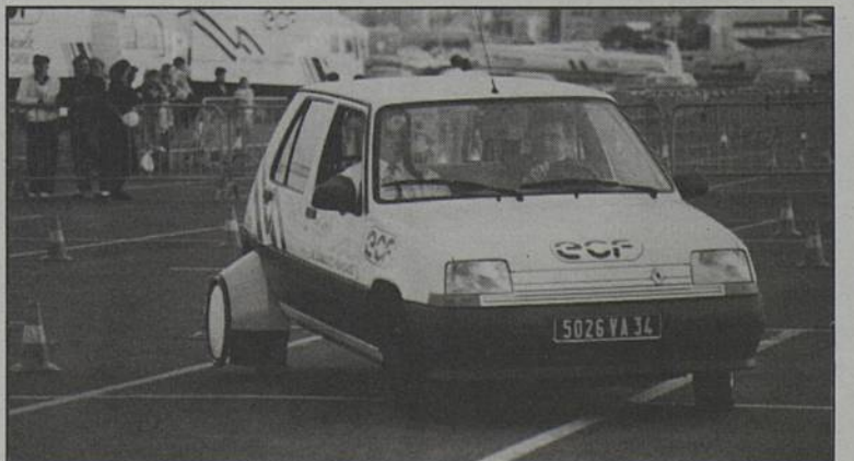
Une voiture pour simuler les dérapages.

Animations de 10 h à 13 h et de 14 h à 19 h à l'extérieur et en permanence dans le chapiteau.