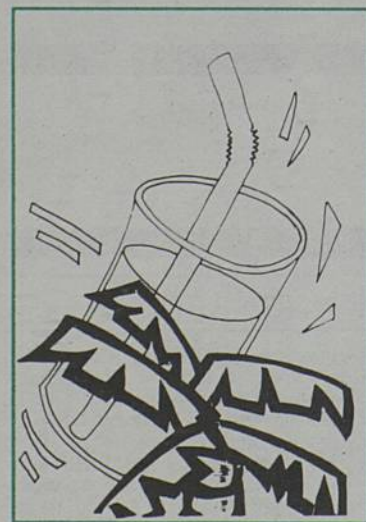
Cocktail Zéro°, boire et choisir.