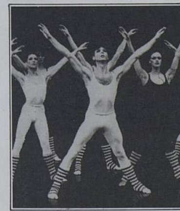
Théâtre chorégraphique de Rennes